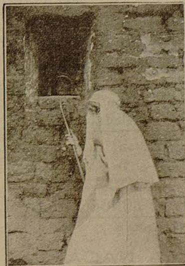
Una escena de la película «El campamento de la tribu de Asra» (Selig Polyscope Co.)

Ibrahim estaba descansando en el patio de su alcázar en compañía de Jesda, su hija favorita, cuando le anunciaron que el temido Mahomet estaba preso y era conducido a su presencia. Jesda, que había oído contar el valor y las hazañas del caudillo, pidió a su padre que le permitiese quedarse durante la entrevista.