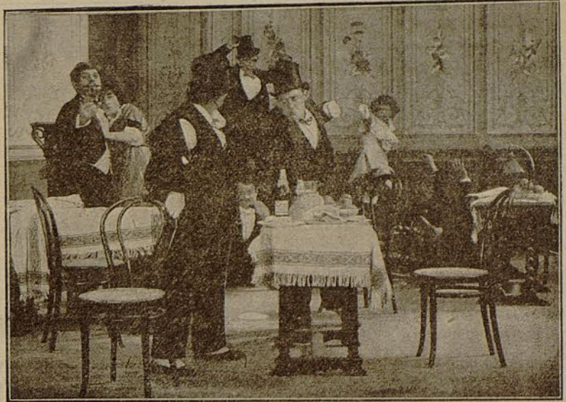
Otra escena de la película «Don Picorete contra don Picorete» (Gaumont)

Terminada la convalecencia, lo que preveíamos sucede. Denise se casa con el pintor, que ignora la existencia de un hijo, suyo no, pero sí de su mujer Denise. Esto, que en otro