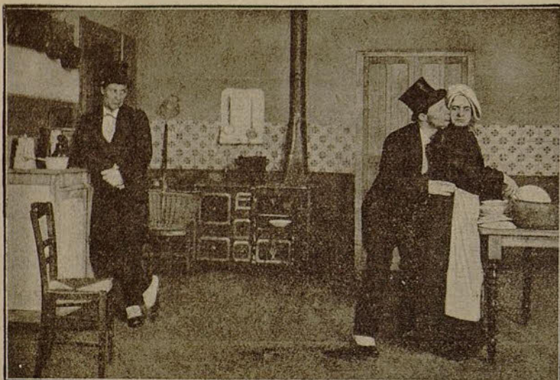
Una escena de la película «Don Picorete contra don Picorete» (Gaumont)

Ocurrirá en esto exactamente lo mismo que cuando se creó, sobre el 10 por 100 por impuesto de timbre, el 5 por 100 para extinción de la mendicidad y protección a la infancia.