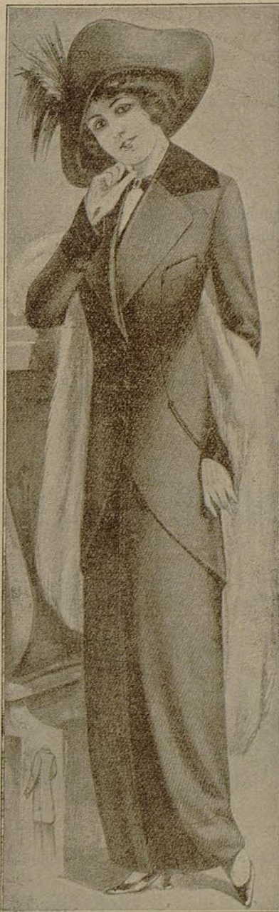
Elegante traje sastre

es el periódico de mayor circulación en su género