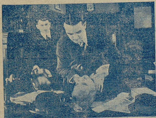
Una escena de la gran película «DEUDA DE HONOR»