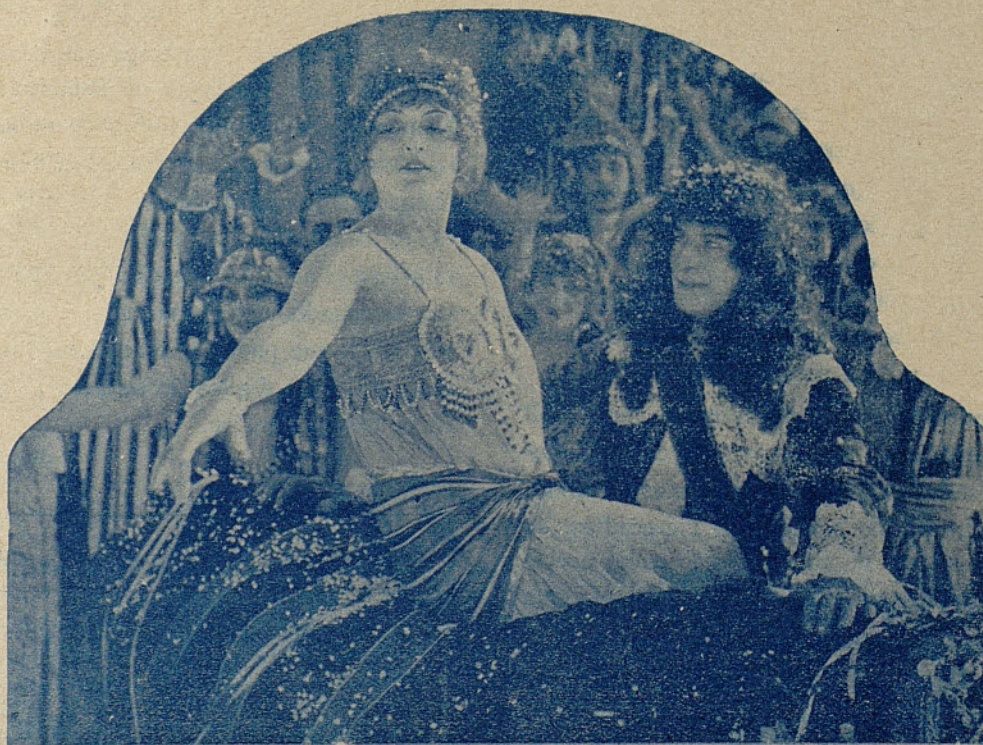
Escena de «EL HOMBRE QUE DUDA». Película de 1.700 metros, en cuatro partes, del «Programa Selecto Gaumont», que dentro poco se proyectará en los cines de esta ciudad,

Se han pasado de prueba los episodios cuarto, quinto, sexto, séptimo y octavo de "Las dos niñas de París", continuando siendo de interés el desarrollo del argumento, si bien se nota, y es lástima, alguna situación de casualidad buscada, que debiera tenerse en cuenta evitar, y no obstante, adolecen de ello muchos films que, como el que nos ocupa, son excelentes en gusto artístico, trabajo de operador y asunto escogido.