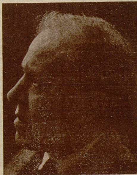
JOSÉ SANTPERE, primer actor y director del Teatro Español

El verdadero «As» del vodevil, que con su arte y gracia ingénita cada día consigue sumar más admiradores al número incalculable que ya posee.