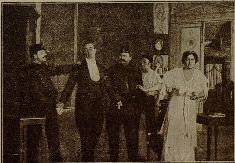
Otra escena de la película «La atracción del fango»

Los agentes, a ruegos de la artista, se retiraron, algo admirados de lo extraño del suce-