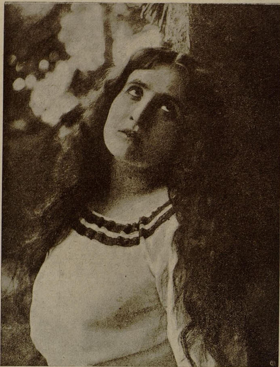
Sig. a Pina Fabri

Distinguida actriz italiana de la casa editora de películas «Milano Films», de Milán