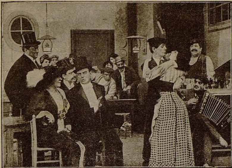
Una escena de la película «La atracción del fango»

Reaños», reunión de hampones y de prostitutas de la más baja estofa.