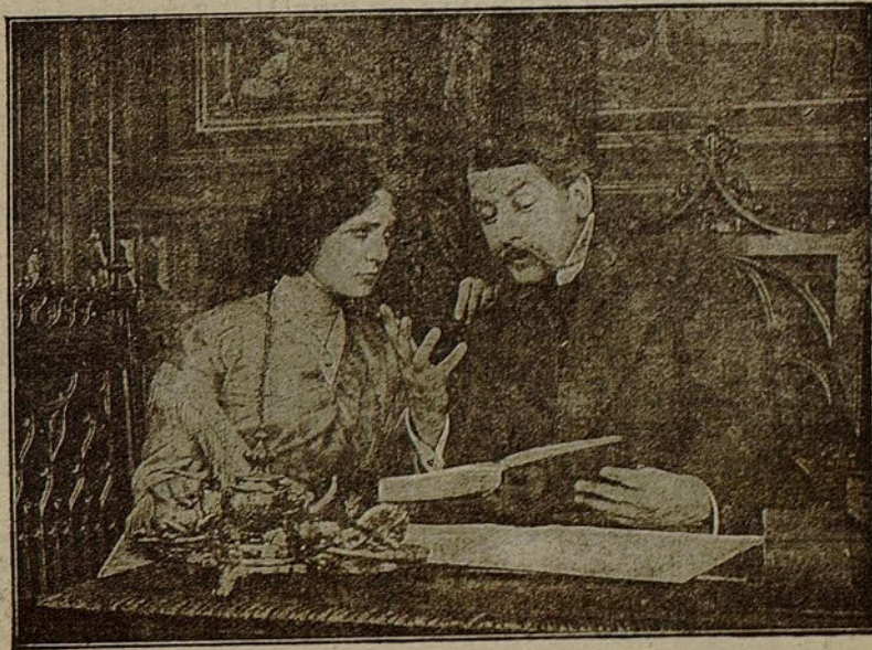
Escena de la película «Como aman las esquivas»

Mas en realidad, las esquelas de Mauricio eran por ella ávidamente leídas y algunas de ellas hacían batir su corazón de tal modo que