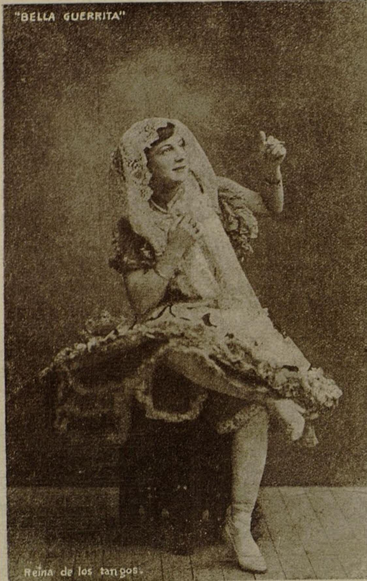
Reina de los tangos.