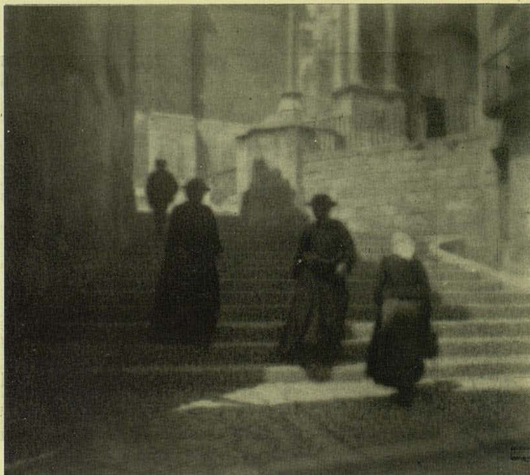
DEO GRATIAS... BROMUR