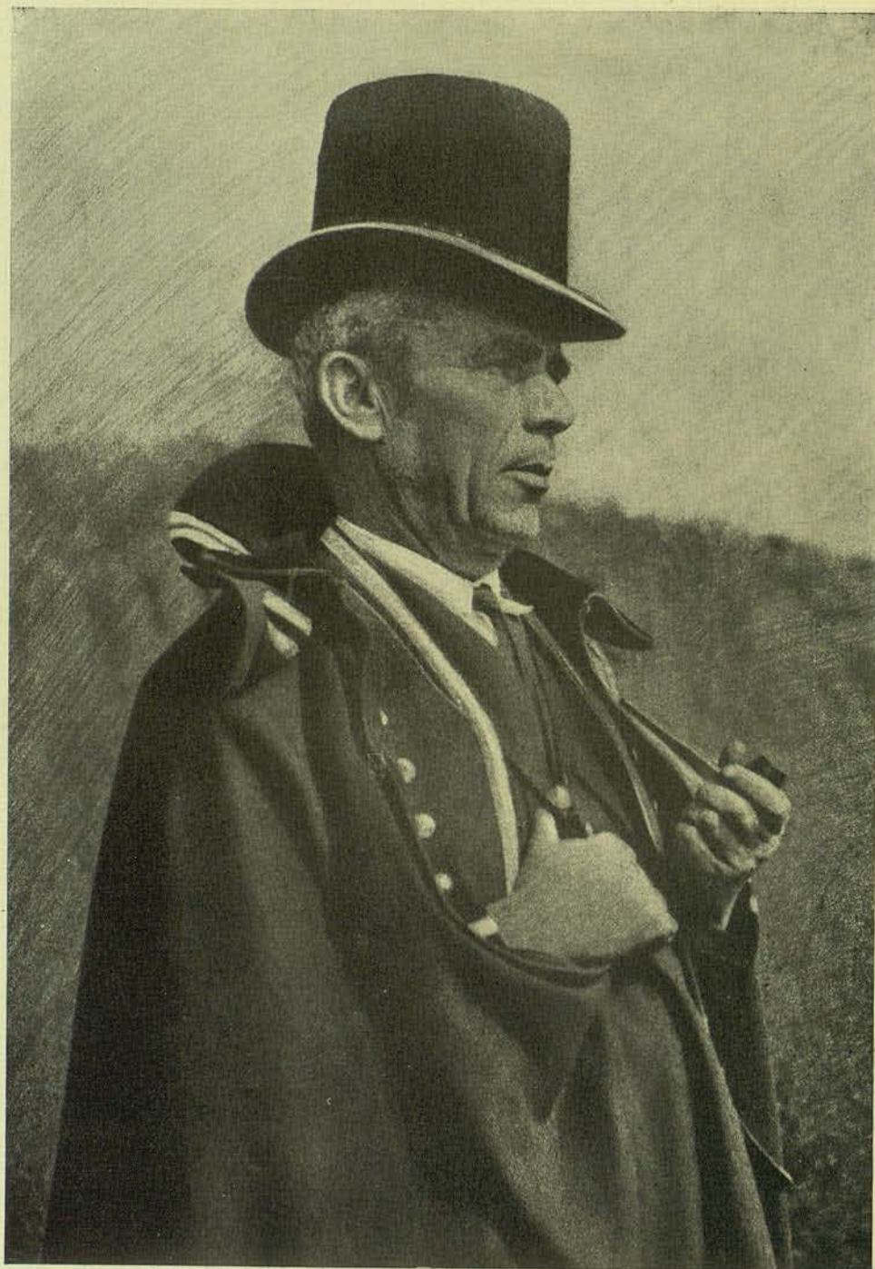
MOSSO D'ESQUADRA BROMOLI