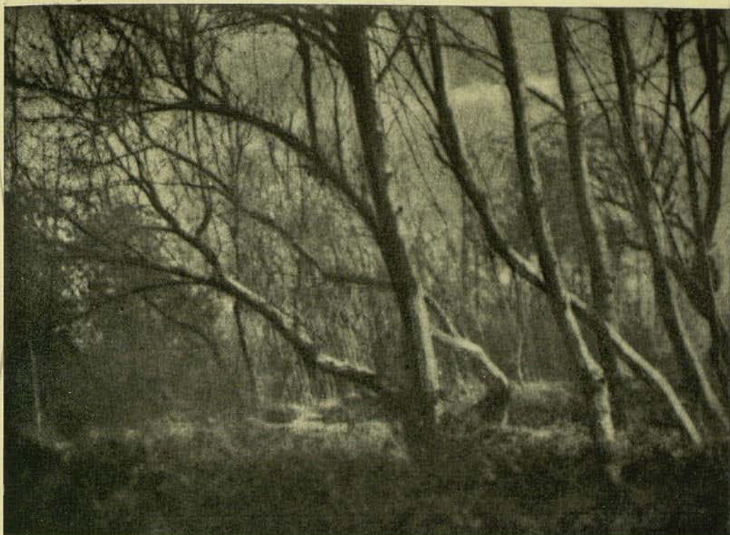
PAISATGE D'HIVERN BROMOLI