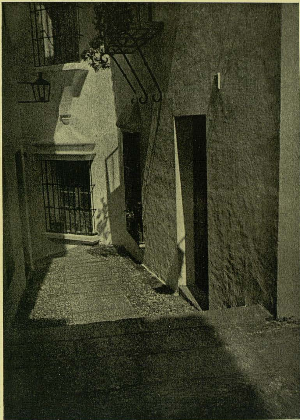
DEL POBLE ESPANYOL BROMUR