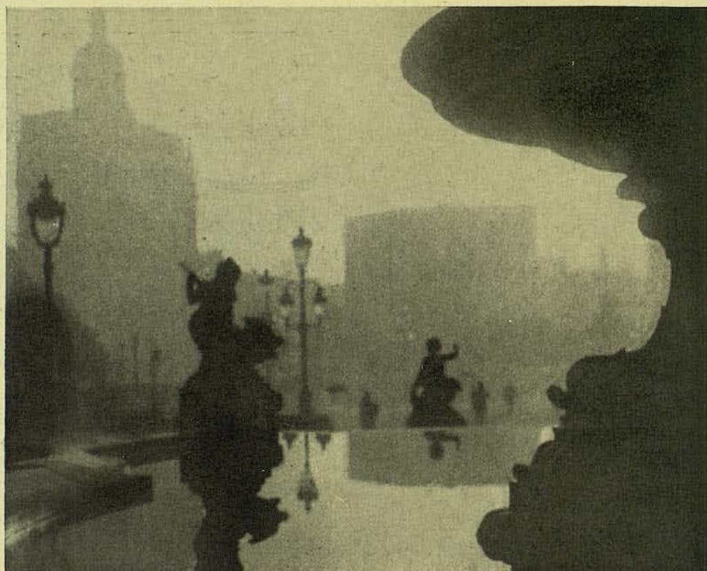
DE LA CIUTAT BROMUR