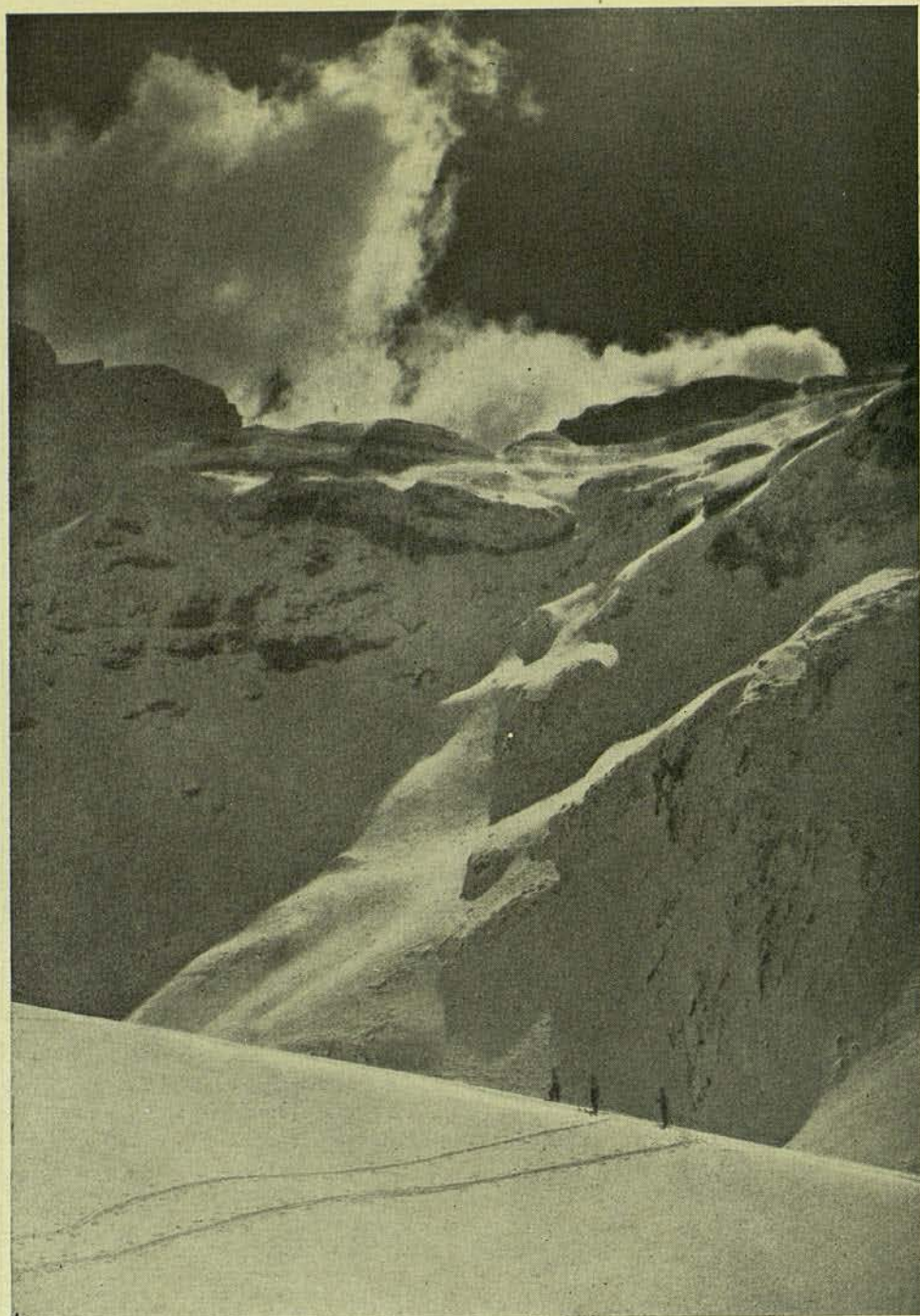
EL PAREDÓN (APEX) BROMUR