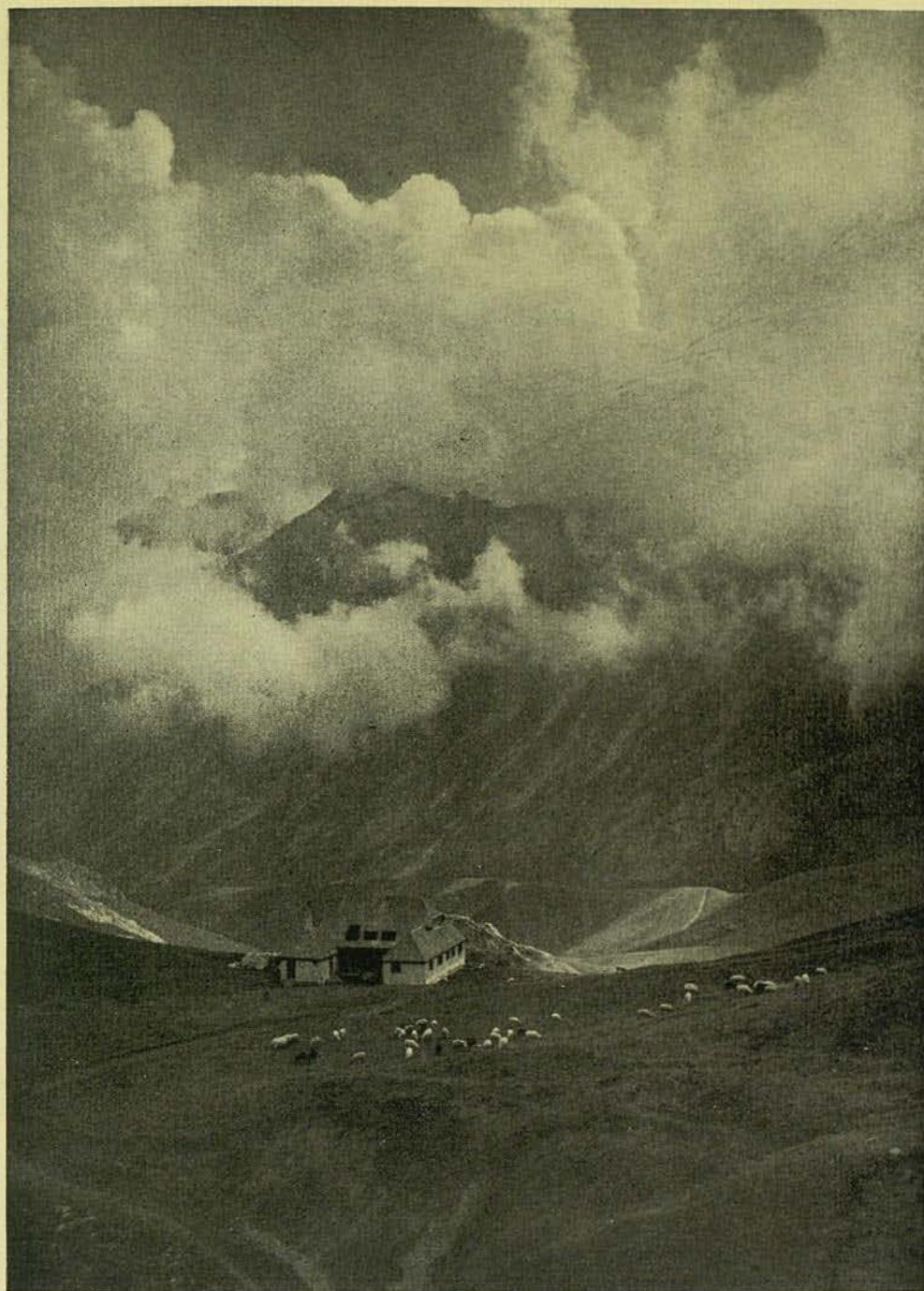
LLUM DE MUMTANYA BROMER