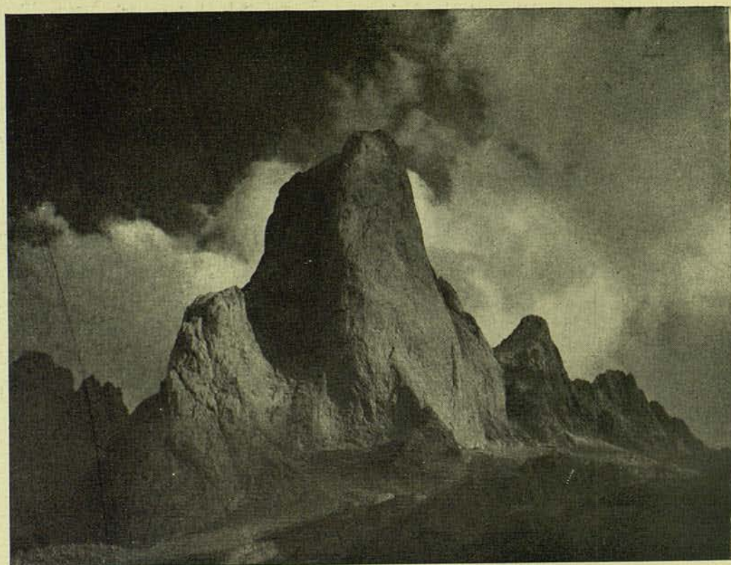
EL TARONGER DE BULNES BROMUR