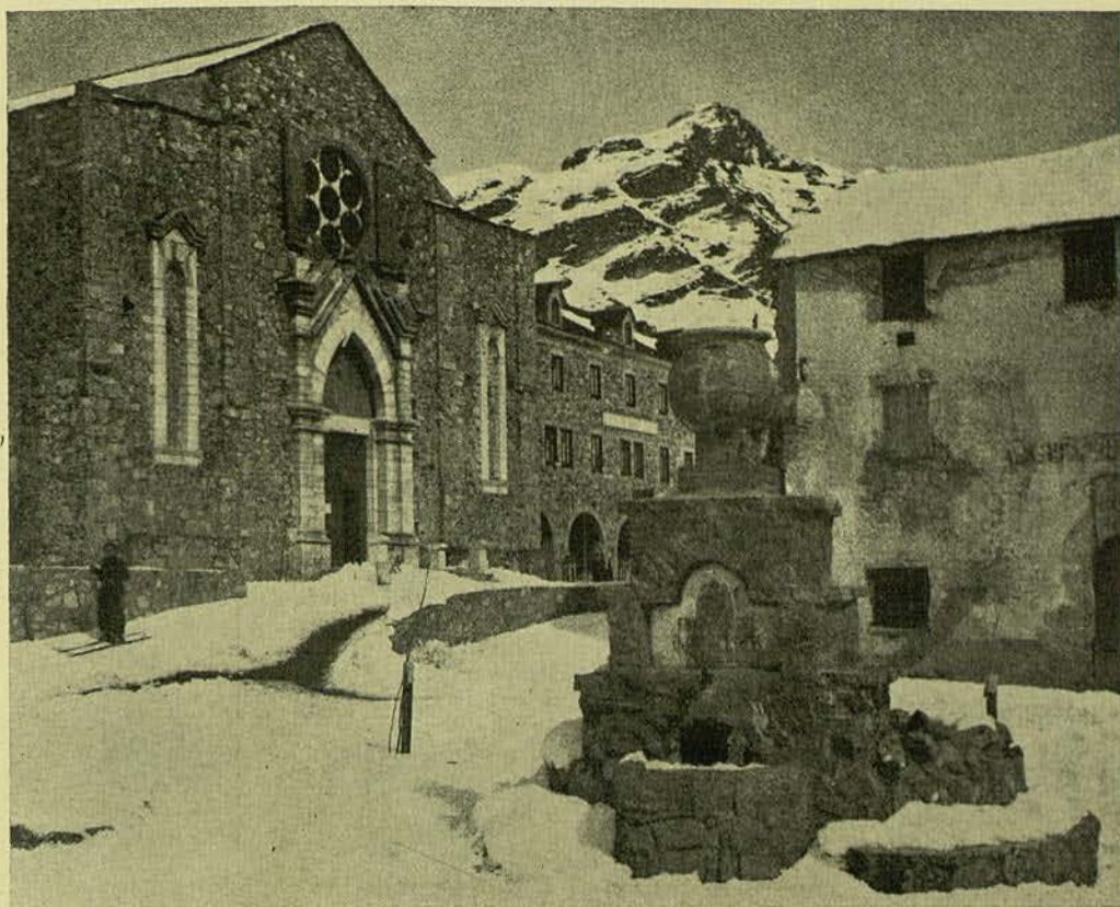
DE CATALUNYA BROMUR