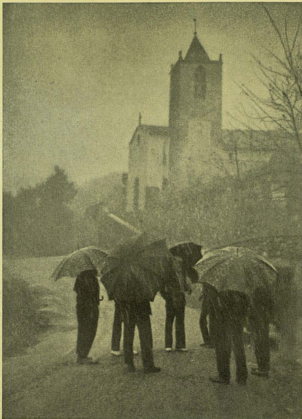
DIUMENGE D'HIVERN BROMOLI