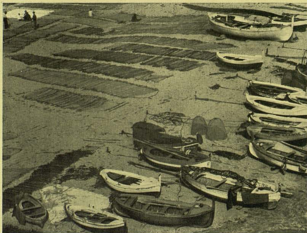
BARQUES I XARXES BROMUR