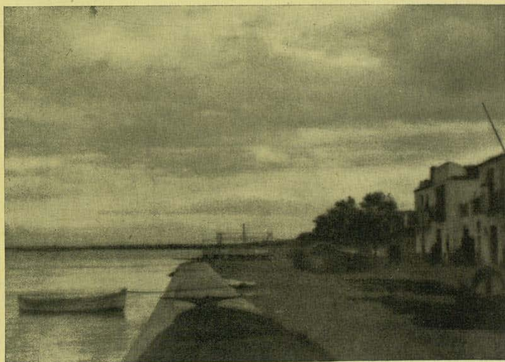
DIA GRIS... BROMUR