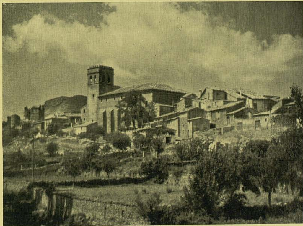
EL POBLE BROMUR