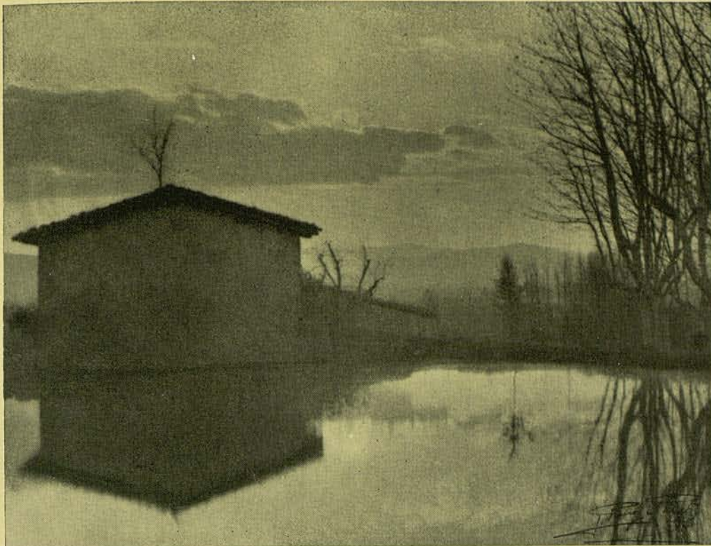
EL MOLÍ BROMUR