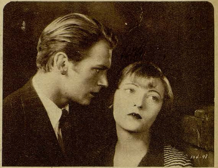
Dorothy Mackail y Douglas Fairbanks (hijo) en la filmación de "The Barker" próxima cinta especial de Milton Sills para la First National