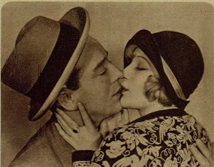
El excelente actor de los estudios Pathé, Monty Banks, y la graciosa actriz, Juana Arthur, en un momento de la película "Flying Lerck".