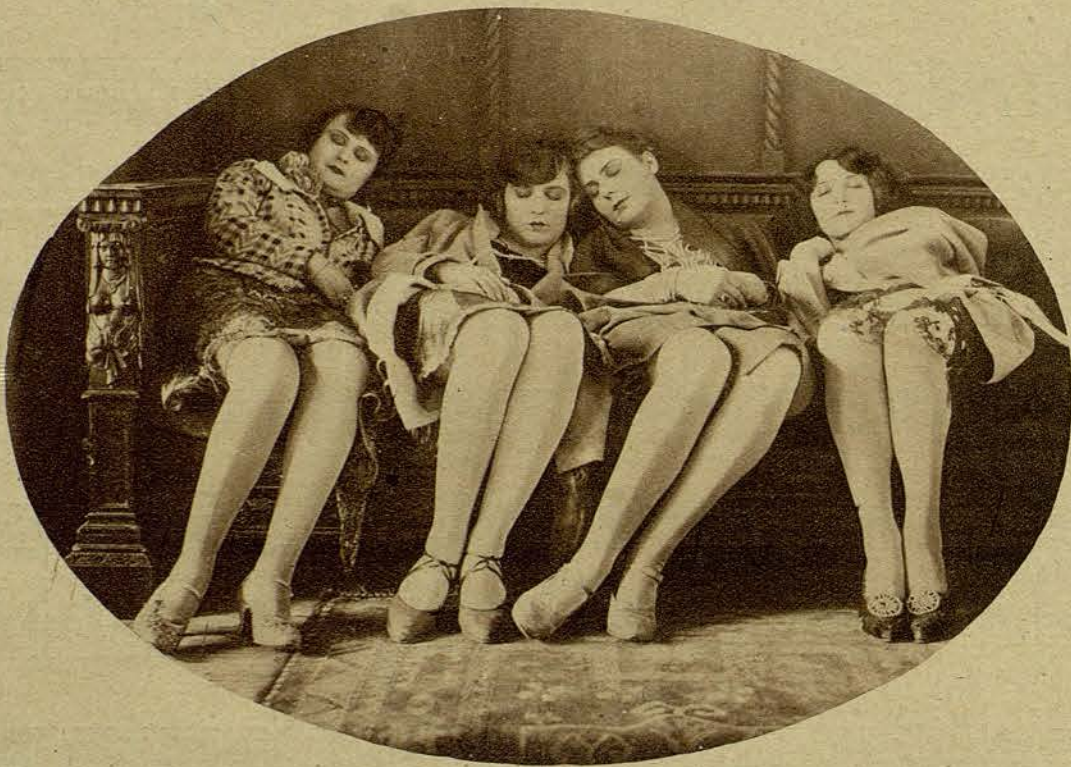
La U. F. A de Alemania, presentará para la temporada próxima una serie de películas lle-