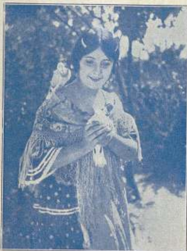
"La paloma cándida, emblema de la inocencia, es digna compañera de la gentil 'osario'."

ADAPTACIÓN CINEMATOGRÁFICA EN CINCO PARTES DE LA ZARZUELA DEL MISMO NOMBRE