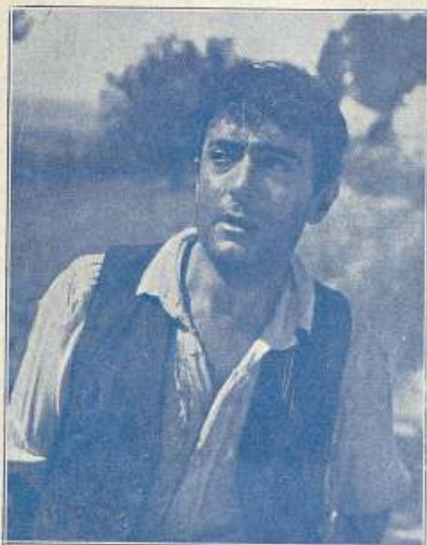
"Tarugo, el gallo montés de la serranía cordobesa".