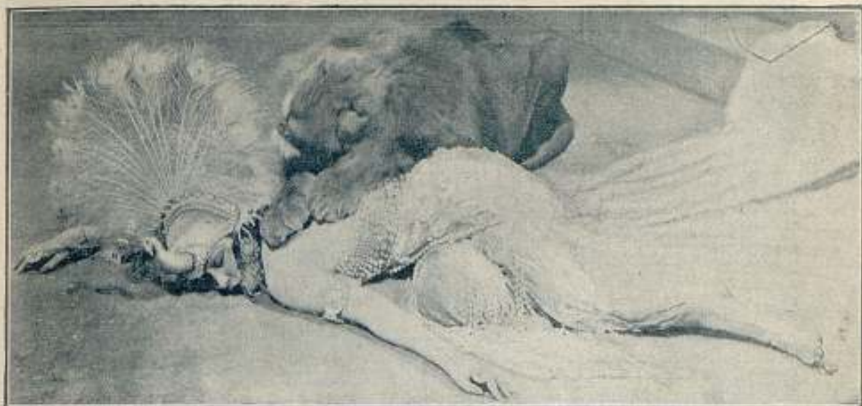
GLORIA SWANSON en una interesante escena de la magistral película EL ADMIRABLE CRICHTON.