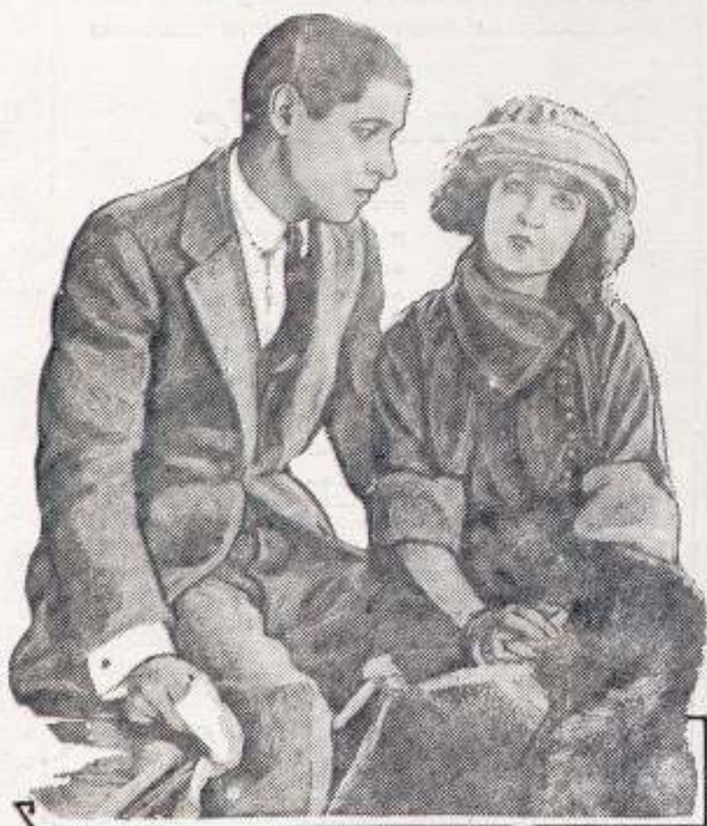
Marguerite Clark in "Scrambled Wives"

« Interpretada magistralmente por la ingénua y bella «estrella» americana