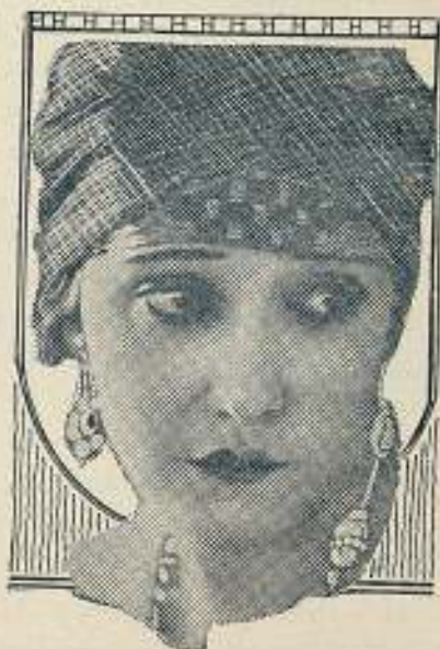
GLORIA SWANSON in PARAMOUNT-ARTCRAFT PICTURES

Miss Swanson es actualmente una estrella que brilla fulgente, con luz propia, en las películas de la Paramount, como habrá notado el que la haya visto interpretar las películas The