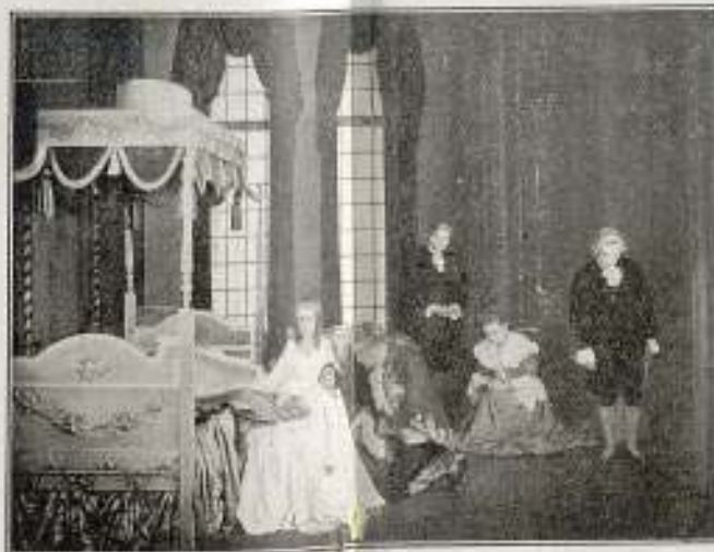
La muerte del hijo