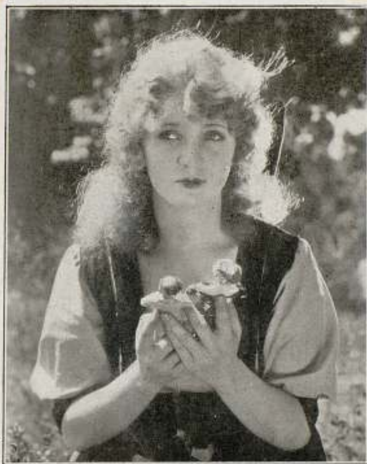
MARY MILES MINTER

Bellísima artista, fiel intérprete de las hermosas comedias de la casa AMERICAN-FILM, tituladas