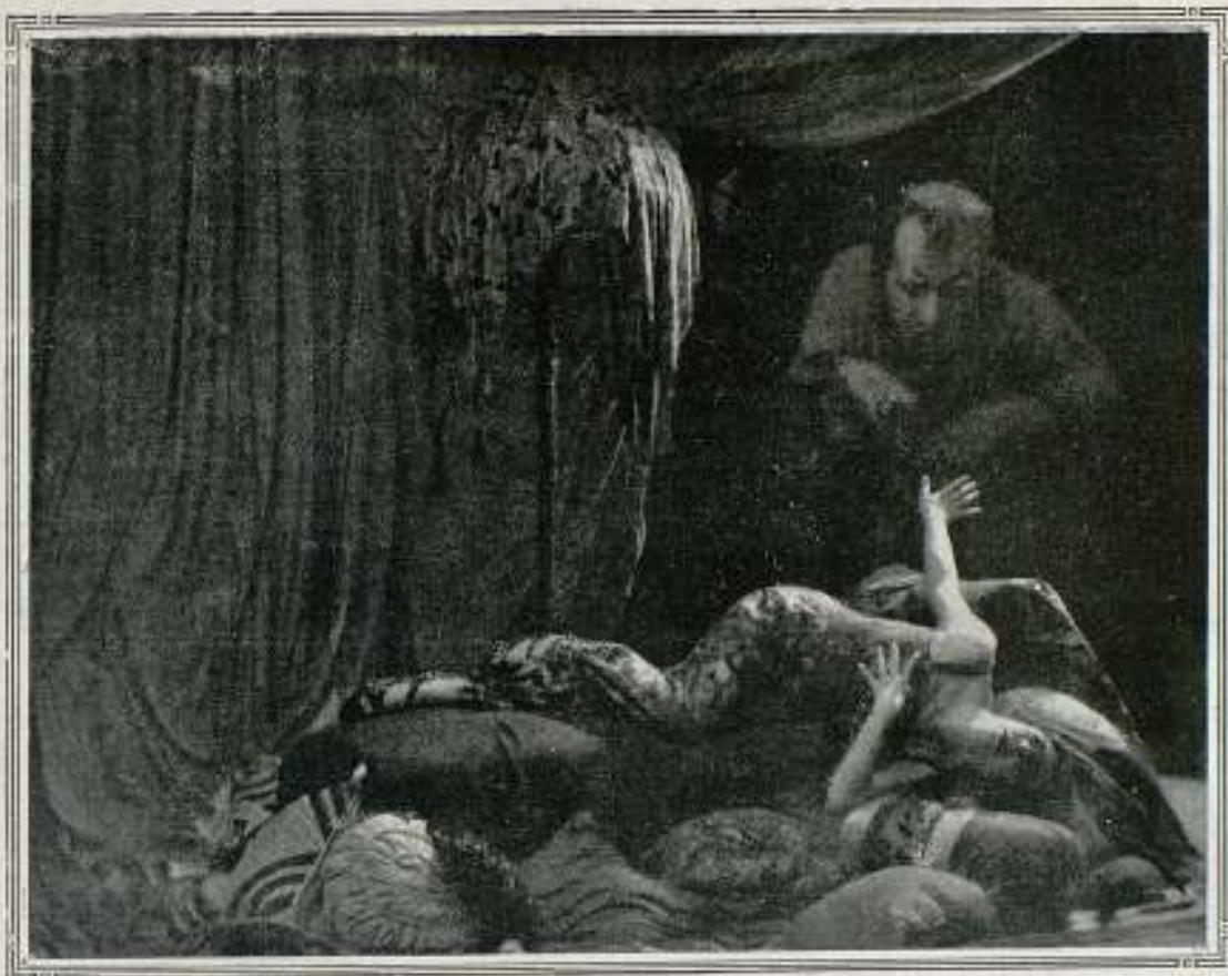
Visiones del Opio