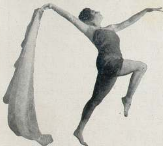
Los siete velos de Salomé

Danzarines clásicos cuya actuación en Barcelona constituye un verdadero éxito