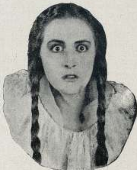
Henny Porten en el papel de «Ana Bolena»

—Si he de decirle la verdad, todas me gustan.