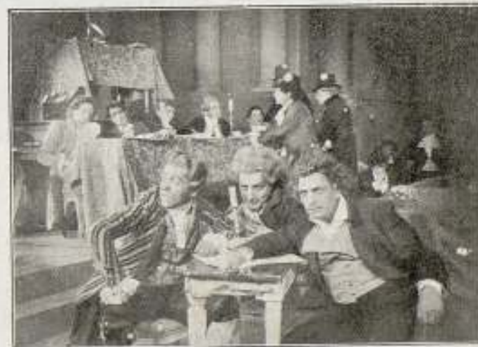
El terrible triunvirato. Robespierre, Danton y Marat