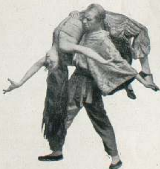
Dance de Opium

DIRECCIÓN: Muntaner, 58, 2.º, 1.º - BARCELONA