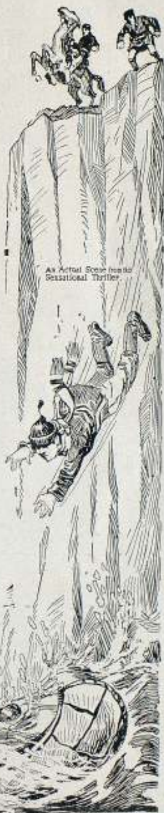
An Actual Scene from the Sensational Thriller