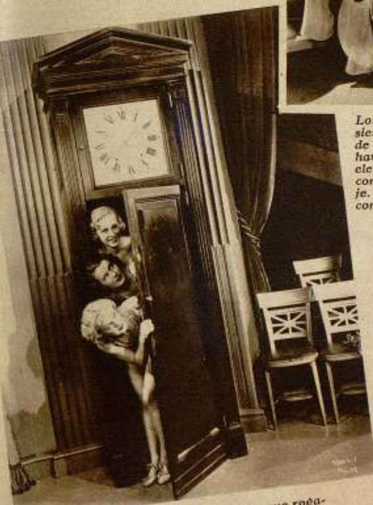
Último modelo de «reloj torre» que rogamos no confundir con un reloj de torre. Tiene baño, calefacción central y teléfono. En él viven las tres gracias que aparecen asomadas a la puerta de la torre.