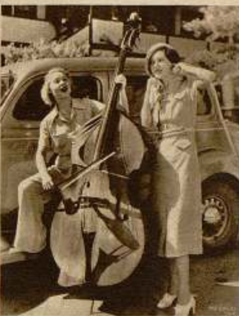
Los americanos, siempre a la zaga de las novedades, han lanzado este elegante modelo de contrabajo de viaje. Lo han lanzado con catapulta.

hardt, basada en la obra de Romain Rolland, «Danton». Actuarán en este film, junto con Laughton, Claude Rains, el intérprete de «El hombre invisible» y Spencer Tracy. Como consejero técnico figura el notable realizador Michael Curtiz.