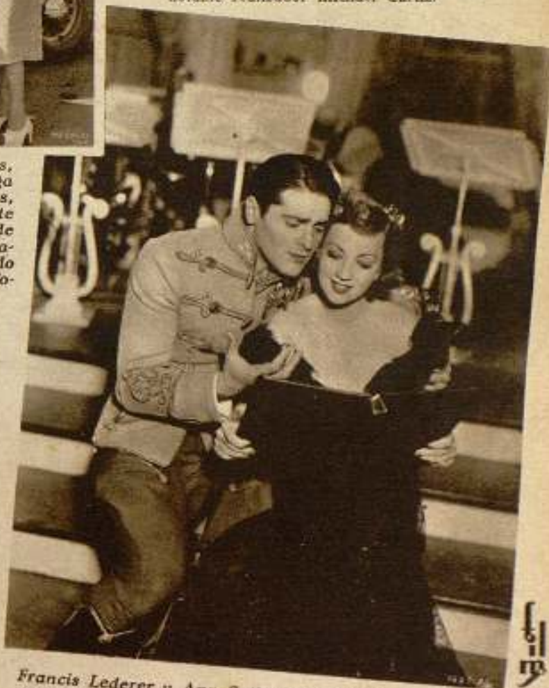
Francis Lederer y Ann Sothern estudiando sus respectivos papeles en la película «Mi esposa es condesa». Hasta en lo de estudiar tienen suerte los actores de cine. Las asignaturas son fáciles. Y bonitas. Y entretenidas. Con un solo texto estudiarán dos personas, lo cual resulta económico. Y cómodo. Y agradable.