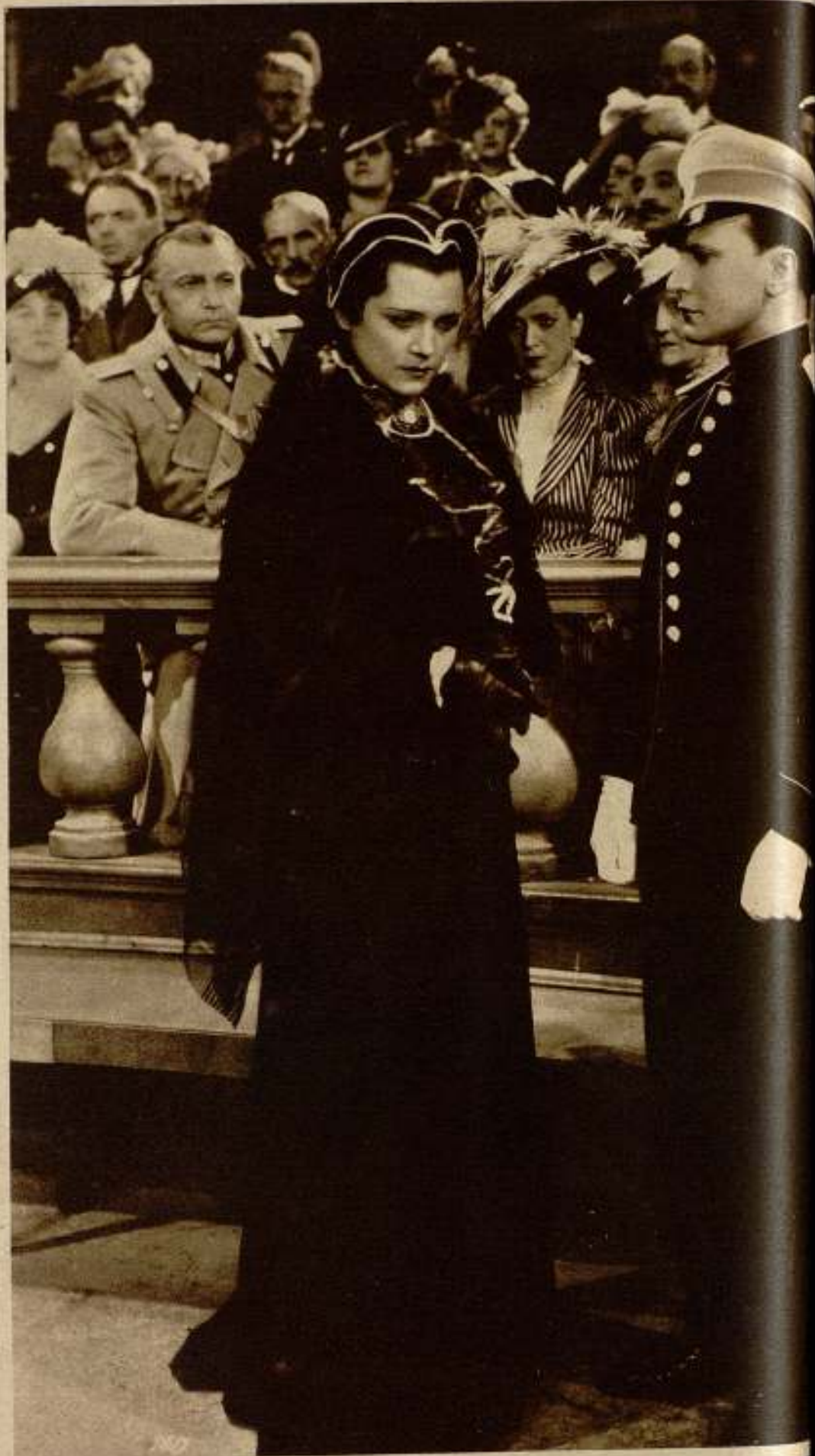
Olga Tschechowa y Hans Scharf-Schoebinger en «Manja».

Como última producción vienesa queremos mencionar la impresión de «Manja». En esta película, que lleva su acción en el siempre interesante y atrayente ambiente ruso, veremos la gran actriz alemana Olga Tschechowa, que hoy podemos considerar como la artista alemana que tiene la mayor cantidad de contratos y, además, los mejores. Olga Tschechowa, que a todos sus papeles da algo de mujer fatal y