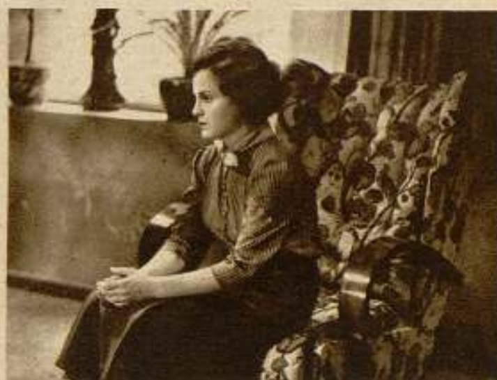
Magda Schneider en «Praters».