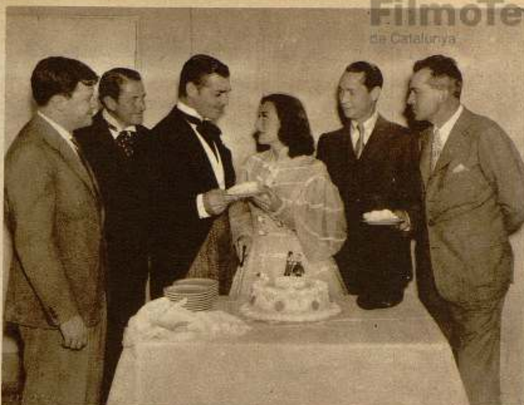
Clark Gable y Joan Crawford celebran el quinto aniversario de la primera película en que ambos colaboraron como estrellas, «Amor en venta». La fiesta tuvo lugar en el escenario de una nueva producción de la Metro en que vuelven a aparecer de estrellas. De izquierda a derecha, el productor Joseph Mankiewicz, Reginald Owen, Gable, Miss Crawford, Franchot Tone y el director W. S. Van Dike.