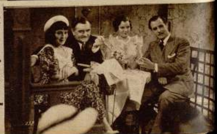
Magda Schneider, Annie Rosar, Fred Hennings y Hans Olden en «Prater».