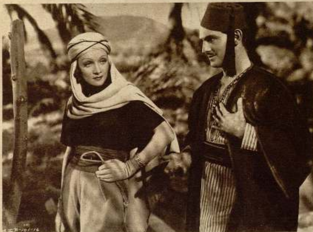
Marlene Dietrich y Joseph Schildkraut en una escena de la película Selznick International «El jardín de Alá»

© Una fidelísima reproducción del «Momento Mori» —cráneo miniatura de metal con un pequeño reloj incrustado, propiedad en vida de María Estuardo— será usado por John Ford, director del superfilm de Katharine Hepburn y Fredric March, para simbolizar la tragedia que le deparó la suerte a la infortunada reina de Escocia.