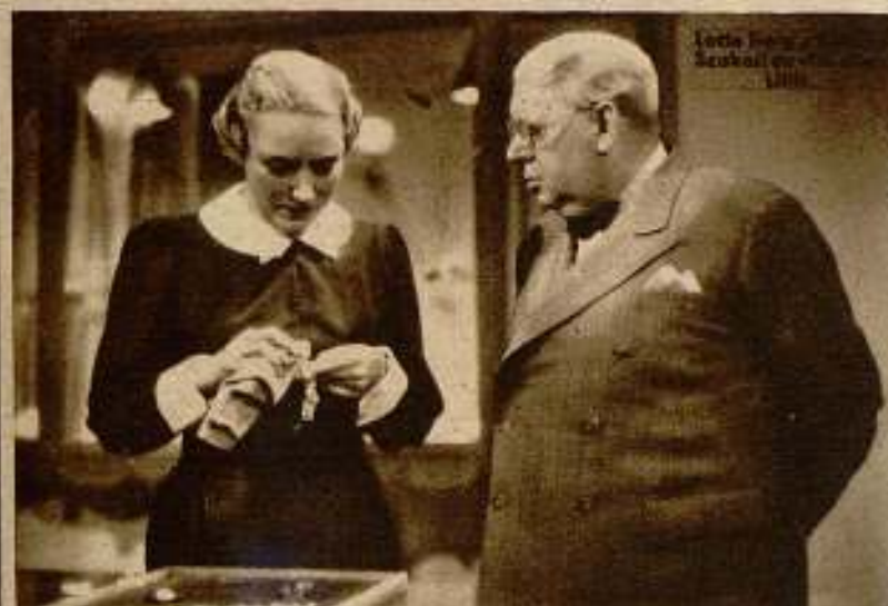
Lotte Lenja y Leo Slezak en «Lili».

Una película corta muy interesante es la que está haciendo Frank Ward-Rossak. La cinta se titula «Máquinas muertas» y se propone hacer campaña contra el paro forzoso. Los asuntos exteriores fueron hechos en fábricas paradas. Los interiores en los «ateliers» de la Selenophon.