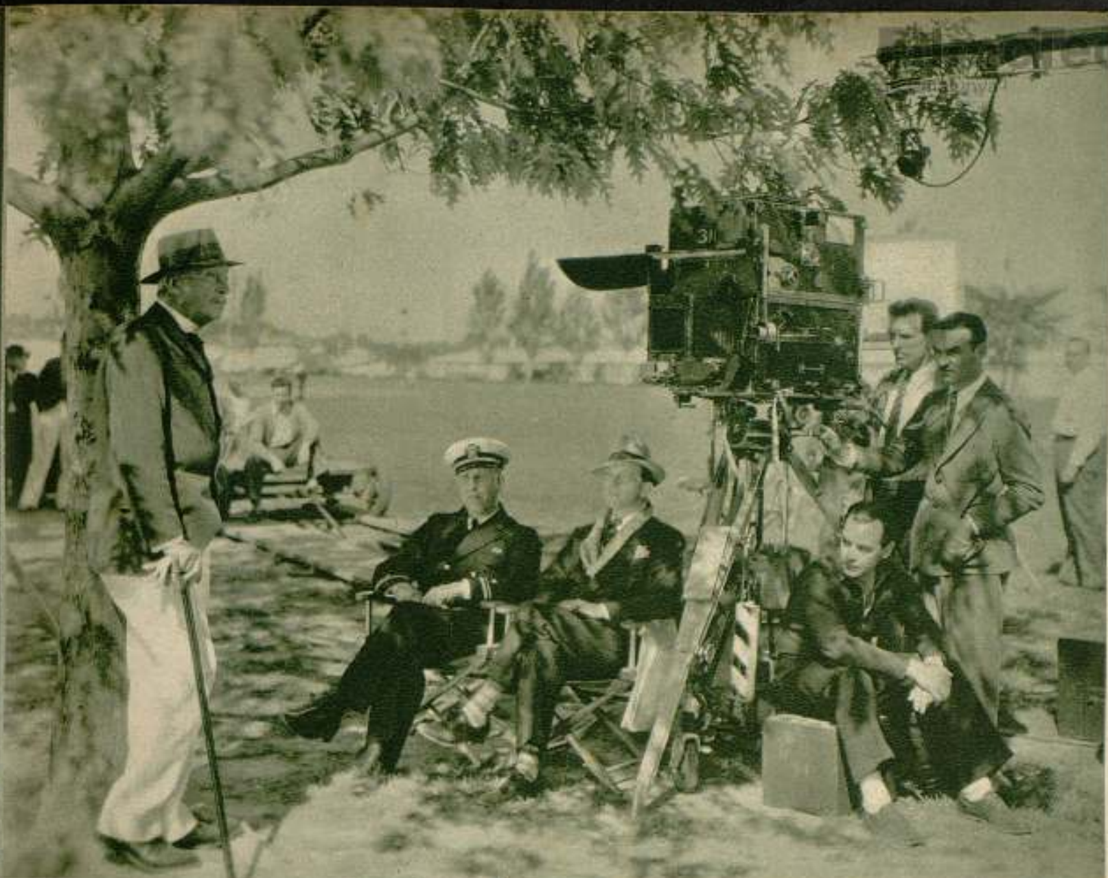
Sir Guy Standing en un momento de la filmación de su última producción «La última singladura», que dirige Alexander Hall.

Dumbor el homere compa le baile evantar os en se dmiraci