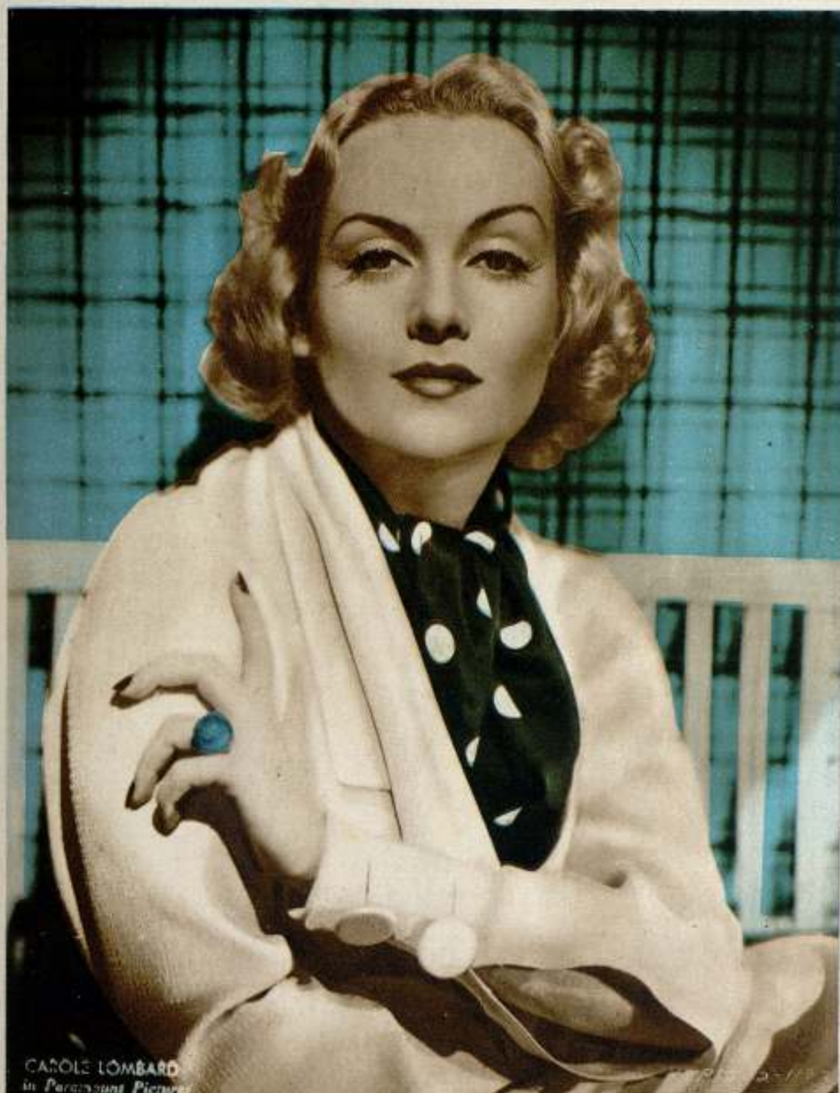
Carole Lombard, estrella de Paramount.