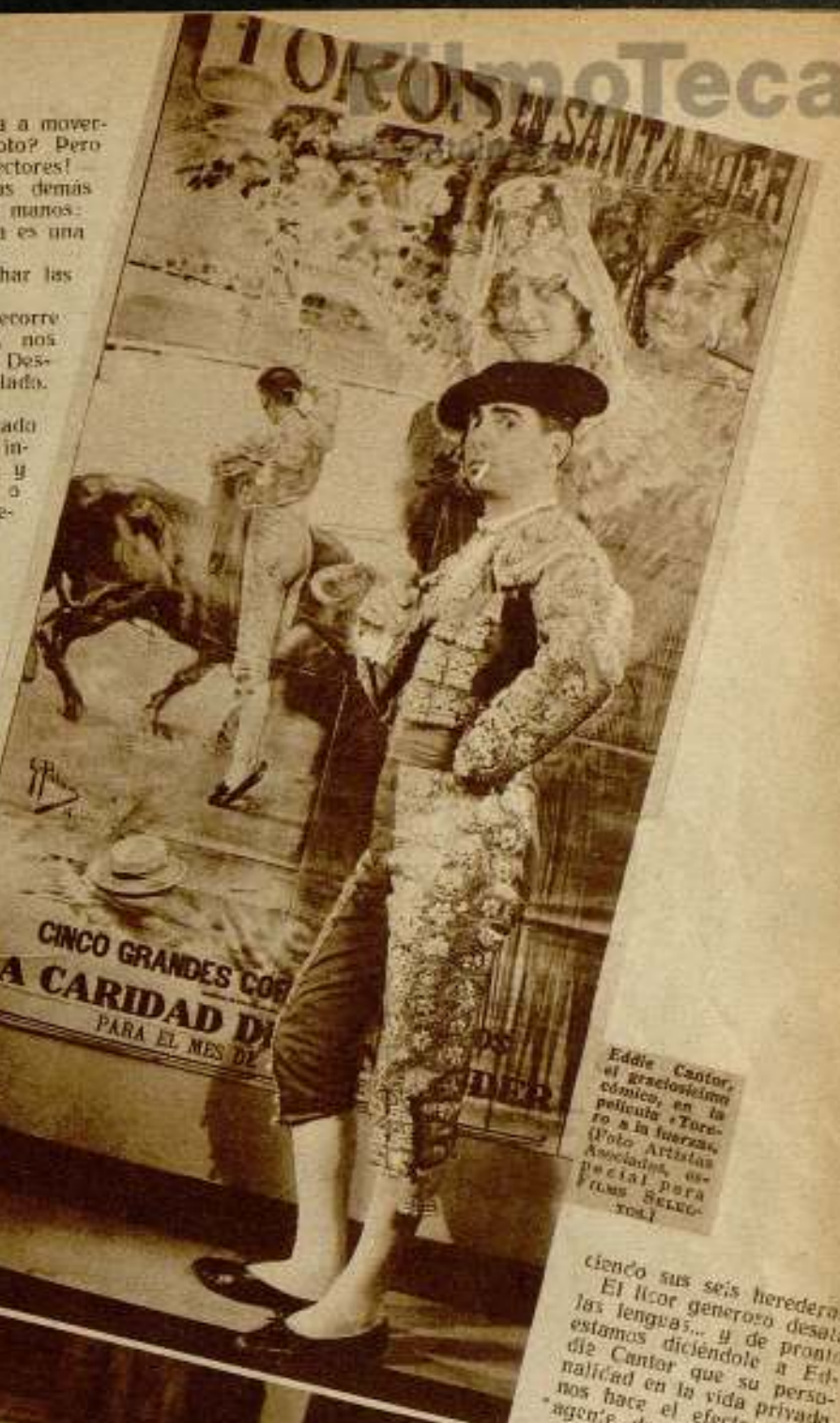
Eddie Cantor, el gracioso cómico, en la película «Torero» a la izquierda. Asociados, en especial, para films Selectos.

ciendo sus seis herederas. El lico generoso desata las lenguas... y de pronto estamos diciéndole a Ed-nalidad en la vida privada nos hace el efecto de un agente de funeraria. El actor se encoge de hombros. Nos mira un instante de soslayo y por fin responde con serenidad digna del Buda: —Eso piensan todos los que me conocen intimamente. De primera intención esperan, al verme, soltar el trapo riendo. No pueden comprender que una cosa es divertirse al público para ganarse la vida, y otra vivir como cualquier persona normal, sujeta a las contrariedades que ofrece la existencia. Y continúan: —Además, la ca-