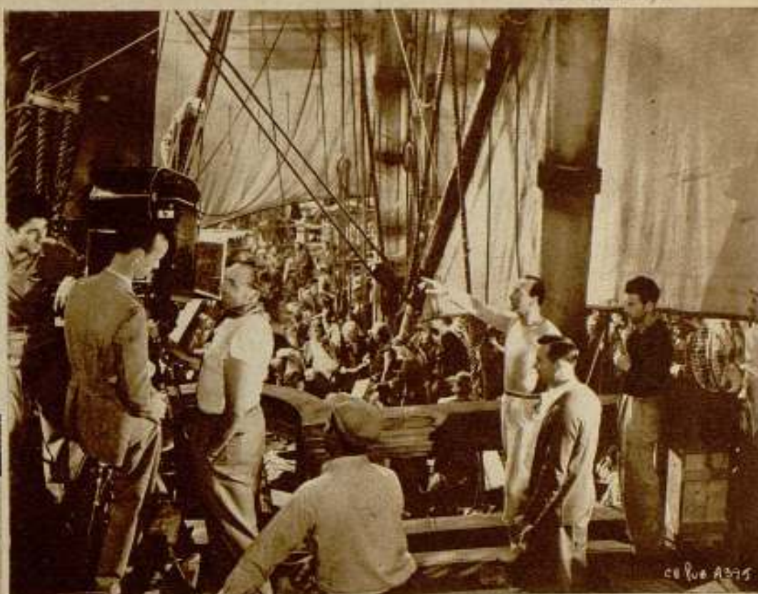
Michael Curtiz, director de la grandiosa película Warner Bros.-First National, «El capitán Blood», prepara el rodaje de unas movidas escenas.

© Margaret Sullivan se trasladará a los escenarios de Walter Wanger, en el estudio de la Paramount, para encargarse del papel protagonista de «The Moon's Our Home» (Nuestra casa es la luna). Se dice que Henry Fonda, uno de los actores contratados por Wanger, se encargará del principal papel masculino y que William