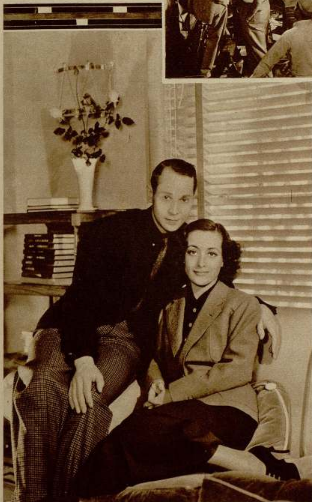
Franchot Tene y señora (Joan Crawford). Primera fotografía de los recién casados en su lujosa casa de Hollywood.

Seiter dirigirá. Por si nuestros lectores no están al corriente de los chismes de Hollywood, les diremos en secreto que todavía, durante un tiempo, el esposo de Margaret.