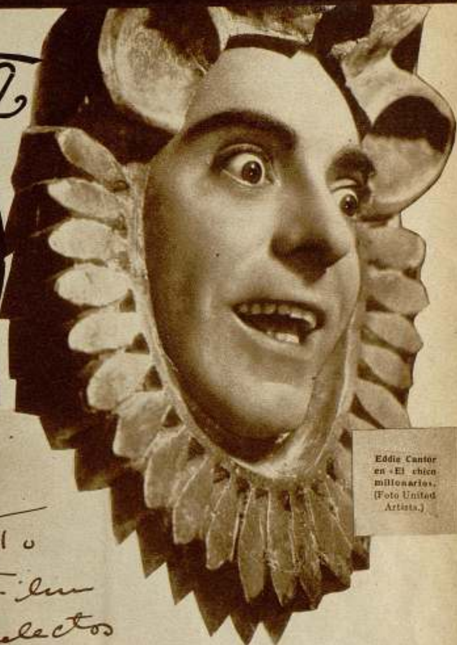
Eddie Cantor en «El chico millonario».