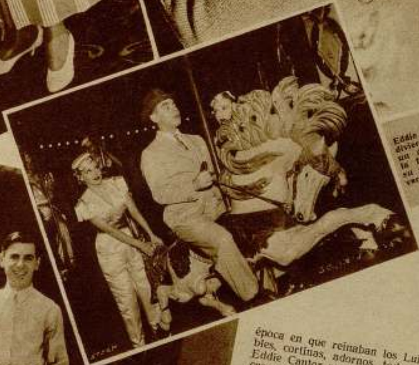
Eddie Cantor se divierte durante un descanso en la filmación de su última y divertida comedia.