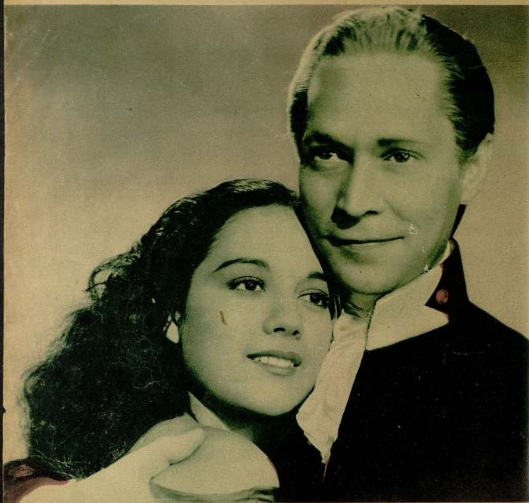
FRANCHOT TONE y MOVITA en la sobresaliente película Metro REBELIÓN A BORDO.