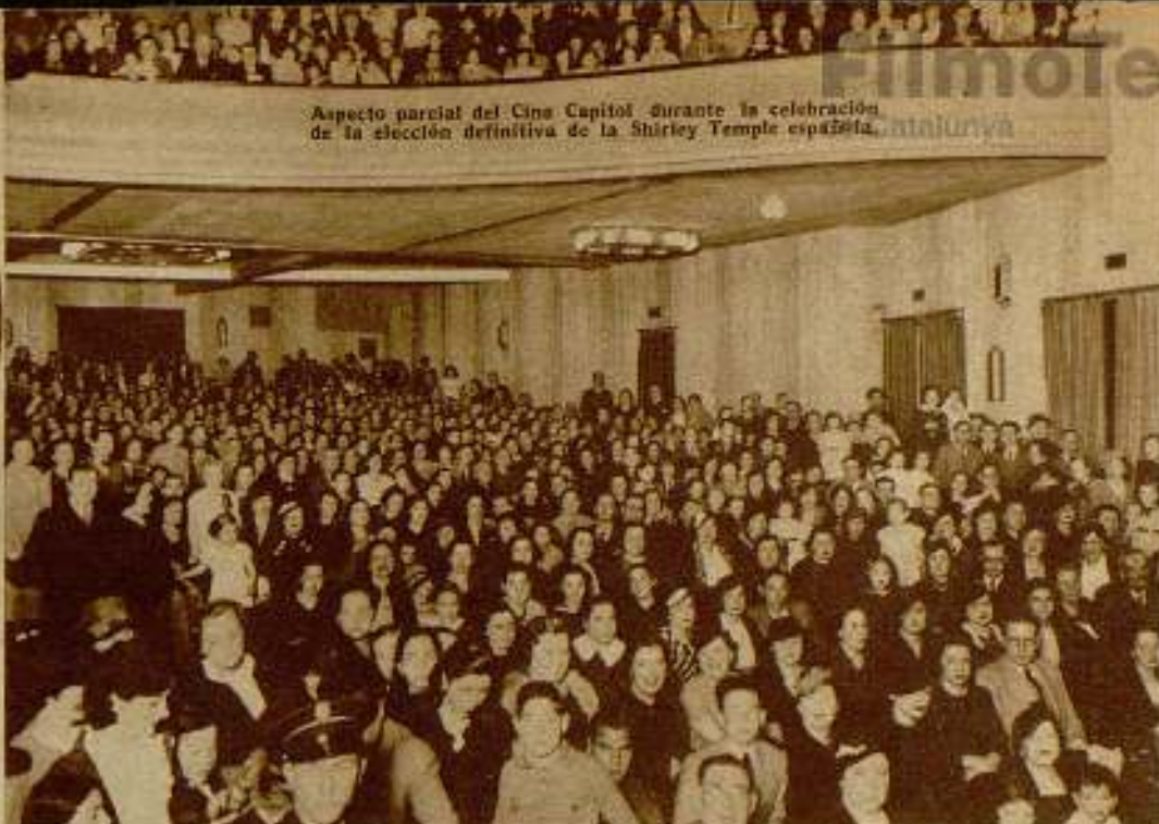
Aspecto parcial del Cine Capitol durante la celebración de la elección definitiva de la Shirley Temple española.

El domingo, día 19, por la mañana celebró una matinal extraordinaria en el