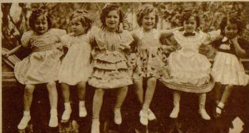
Seis de las siete niñas seleccionadas para la elección definitiva.

Las siete niñas finalistas, cuyos nombres ya damos anteriormente, subieron de una a una al estrado, siendo presentadas al público, que las acogió con grandes aplausos a los que ellas correspondieron con toda clase de saludos, actitudes y gestos cariñosos que hacían resaltar sus infantiles encantos. El jurado, por votaciones suce-