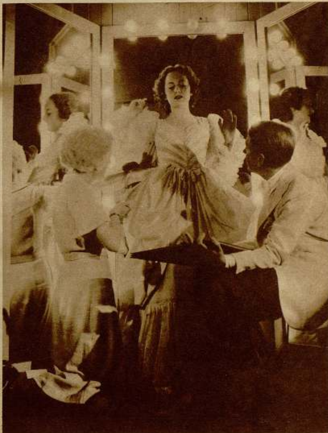
Olivia de Havilland en el camerino, bajo la atenta mirada del creador del modelo, prueba uno de los vestidos que ha de llevar en la película Warner Bros-First National, «El capitán Blood».

—No del todo. Mi apellido es realmente Kiam. Mi verdadero nombre de pila es Alejandro; pero cuando iba a la escuela mis compañeros dieron en llamarme Omar, por sonar mi apellido tan parecido al del gran poeta persa. Pasaron los años, y, siguiendo todos llamándome así, adopté el nombre de Omar, como mi «marca de fábrica». Despertando en todos tanta curiosidad, me parece que no es mala publicidad.