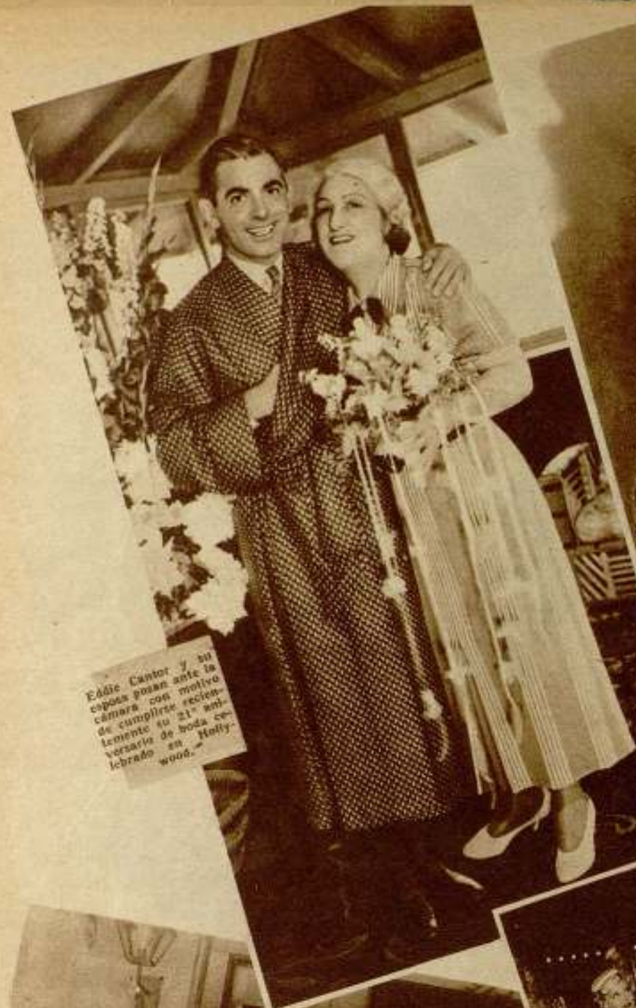
Eddie Cantor y su esposa posan ante la cámara con motivo de cumplir su 21º aniversario de boda celebrado en Hollywood.