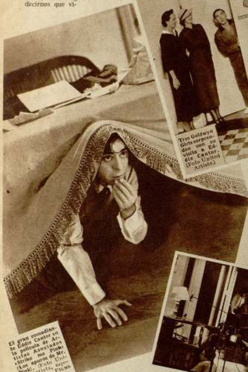
El gran comediante Eddie Cantor en la película de Artistas Asociados «Strike me Pink». (Los apuros de Mr. Pink).

Pero hay uno, especialmente, que a mí me causó gran hilaridad. Cuando el actual rey de Inglaterra vino a Nueva York (era entonces príncipe de Gales), fui invitado a cantar en una de sus recepciones. La invitación llegó a última hora, de modo que no pude decirle a mi mujer dónde iba. Mi mujer, si usted se empeña en saberlo, es algo celosa.