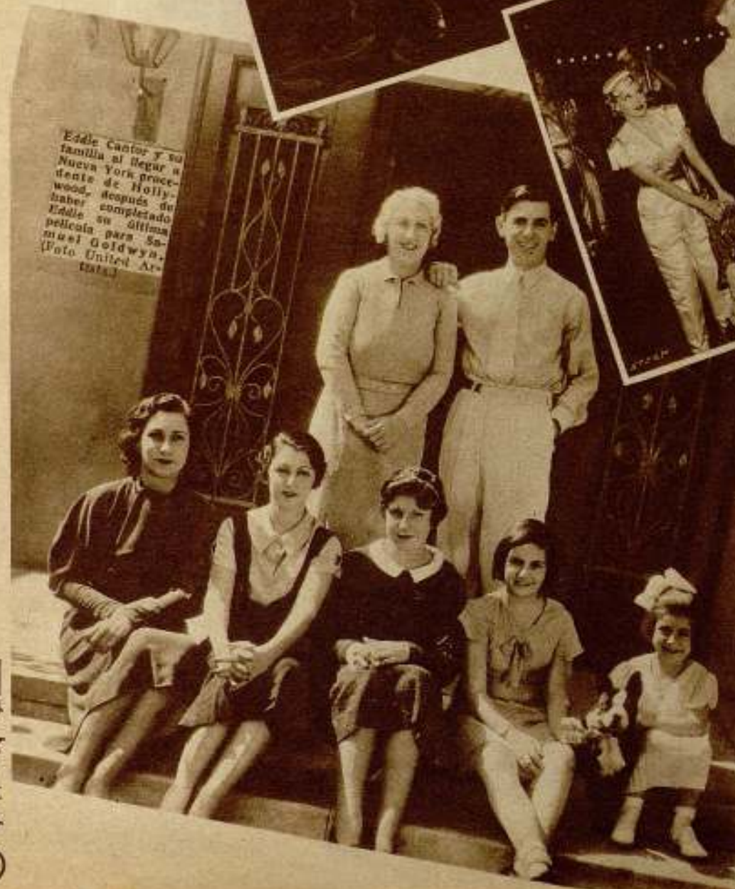
Eddie Cantor y su familia al llegar a Nueva York procedente de Hollywood. Después de haber completado la película para Samuel Goldwyn.

época en que reinaban los Luises. Muebles, cortinas, adornos, todo en casa de Eddie Cantor recuerda las pelucas blancas y los minúes. En plena Babilonia se ha refugiado en un rincón artístico y reminisciente del viejo mundo. Nada indica que el hombre es americano cien por ciento. El lujo en que vive y el refinamiento de su casa es una copia de otras civilizaciones. La verdad es que hemos elegido este día negro y sombrío para entrevistar a Eddie, buscando un contraste entre su personalidad jocosa y llena de gracia y el «split» que se ha adentrado a nuestro espíritu. Pero debemos recordar que no hay nada tan serio como un actor cómico. Ya lo dijo una vez el director Norman Taurog: —Los cómicos no saben reír fuera del teatro. Efectivamente, Eddie, en persona, es de una seriedad aplastante. Nos sentimos defraudados en nuestras esperanzas, pero no queda más remedio que hacer la entrevista. Y, además, nos enteramos de que Eddie celebra su natalicio. Con un espíritu de hospitalidad digno del mejor hidalgo, Eddie hace los honores de la casa.