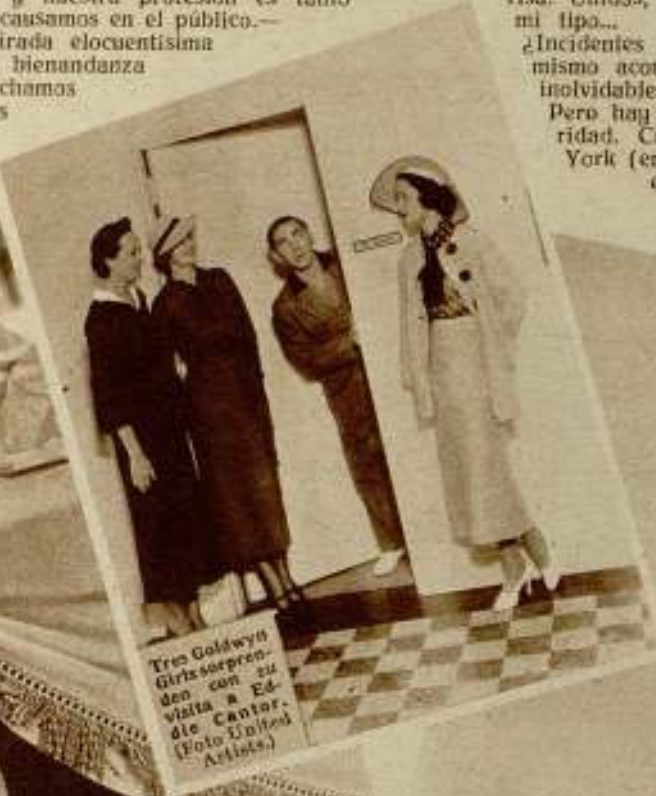
Tres Goldwyn Girls sorprendidas con su visita a Eddie Cantor.