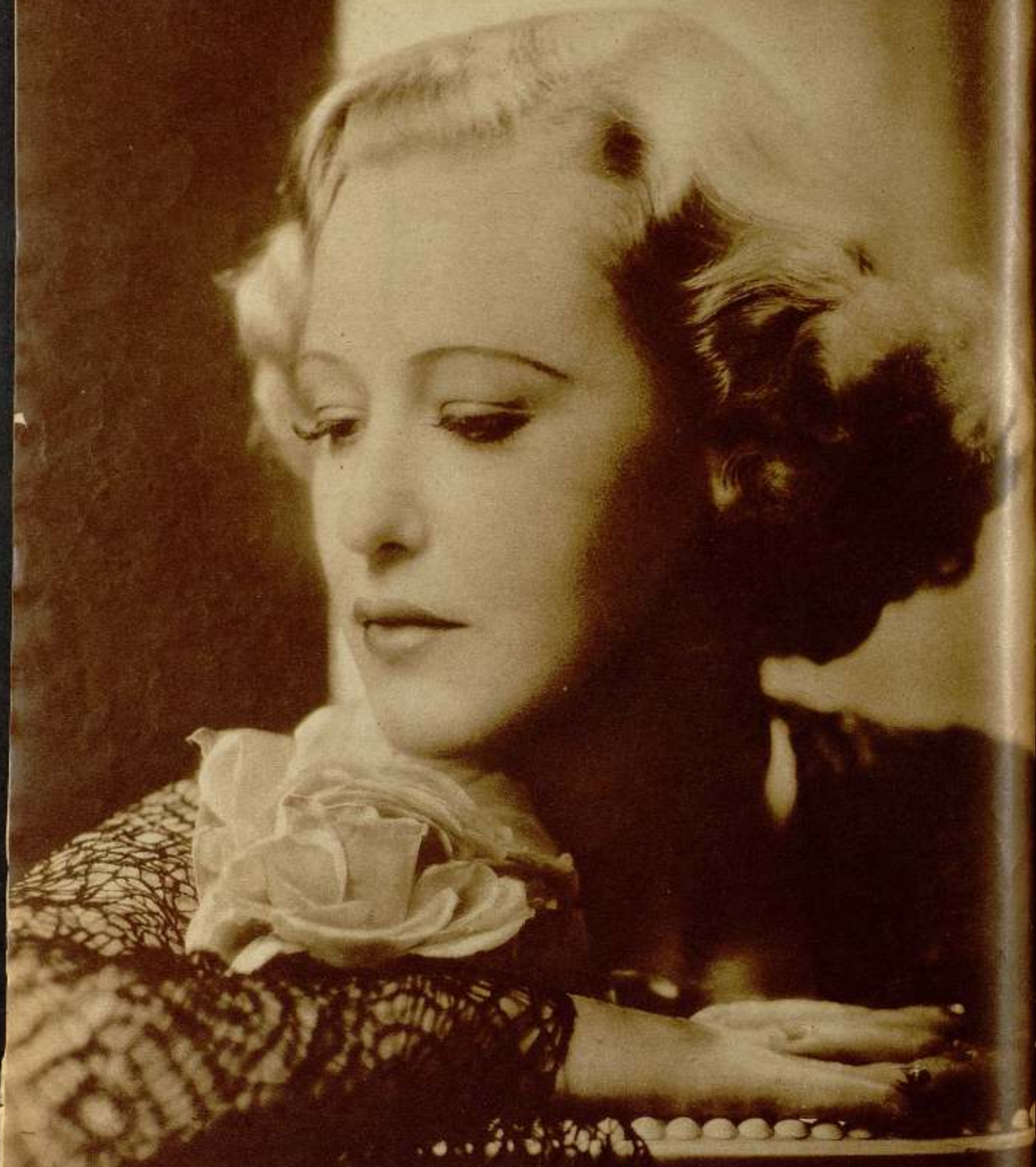
Uno de los últimos retratos de Grace Moore, gran estrella de Columbia, cuyas voz y belleza podrán ser admiradas de nuevo en la película «La princesa encantadora», en la que ha actuado bajo la dirección de Joseph von Sternberg.