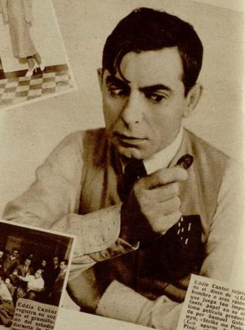
Eddie Cantor sujeta al disco de «Eres hombre o eres ratón?», que juega tan importante papel en su última película producida por Samuel Goldwyn, «Strike me Pink». (Los apuros de Mr. Pink).

ve, como el célebre Garrick, tratando de curar su incurable «spleen» y llegando casi al margen del suicidio, por no encontrar remedio a tan angustioso mal?—