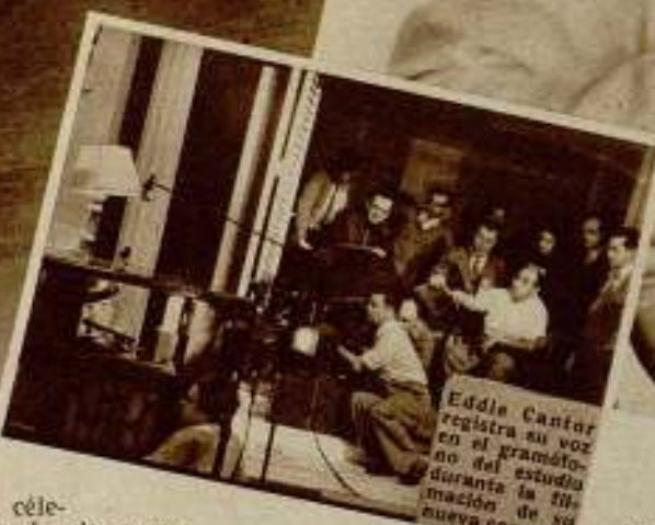
Eddie Cantor registra su voz en el gramófono del estudio durante la filmación de su nueva comedia.