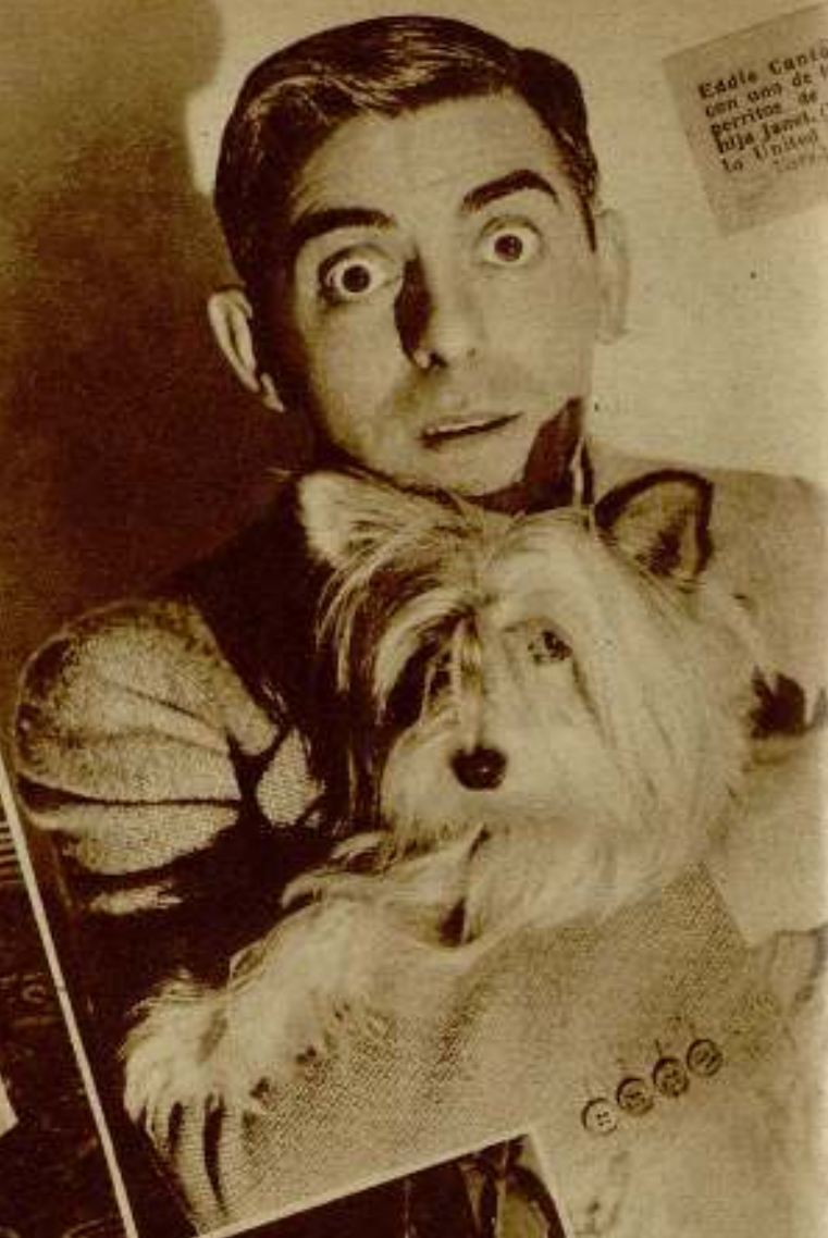
Eddie Cantor con uno de los perritos de su hija Janet.