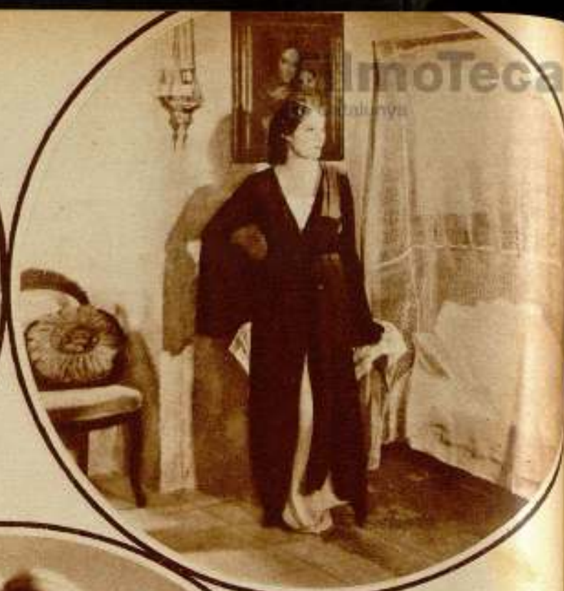
Arriba, izquierda: Otra escena de la película «Maria Elena».