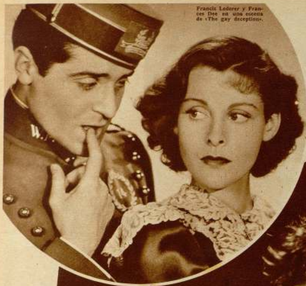
Francis Lederer y Frances Dee en una escena de «The gay deception».

Cuando Lederer, el actor del rostro infantil y la mirada profunda, vino a Hollywood, tenía ya ganada una reputación fílmica excepcional. Hollywood no lo recibió con sorpresa porque lo conocía y admiraba ya a través de sus grandes producciones europeas.