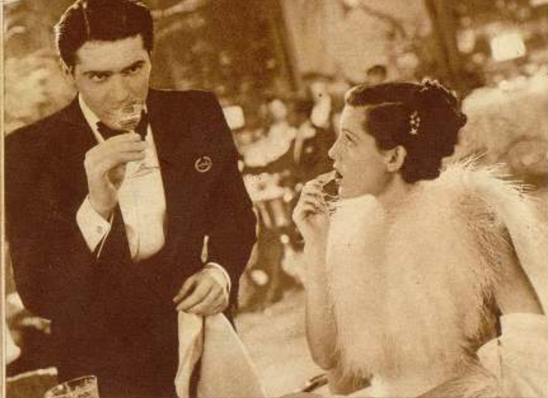
Francis Lederer y Frances Dee en dos escenas de «The gay deception».

Es realmente hoy día un caso excepcional en Hollywood asistir a la filmación de sus películas. Cualquiera que sea el estudio para el que trabaje y el director que le dirija, Lederer es un verdadero colaborador en la dirección de la película y por ello hay que considerarlo también copartícipe en el éxito.