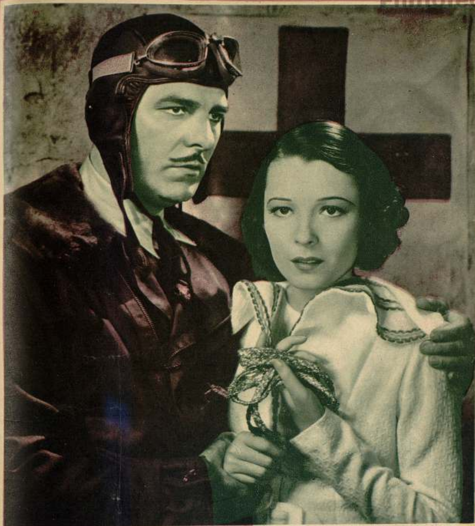
Lupita Tovar y Antonio Moreno en «Alas sobre el Chaco», de la Universal.