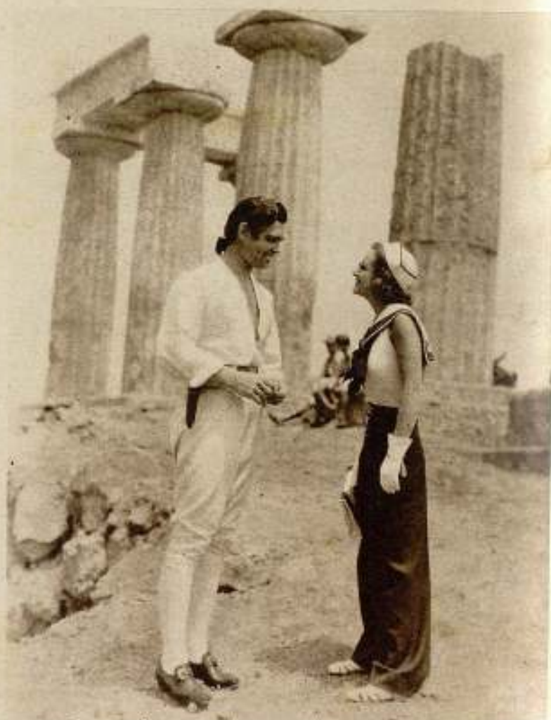
Clark Gable visita a Joan Crawford en un escenario al aire libre, mientras ambas se encuentran en la Isla Catalina, tomando parte en dos diferentes películas de la Metro.