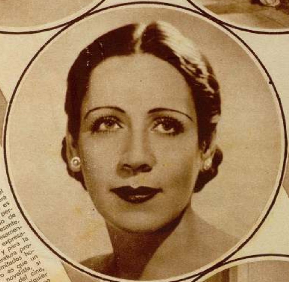
En el centro: Aura Silva, la llamante estrella colombiana, que se educó en Barcelona, desde donde se trasladó a los Estados Unidos. En Hollywood presentó «Canción a cuna» y «Pueblo de Mujeres», interpretando tan artísticamente a las respectivas protagonistas que obtuvo su ingreso en el cine, tomando parte en «Angelina» y en «Deseo de Francia».