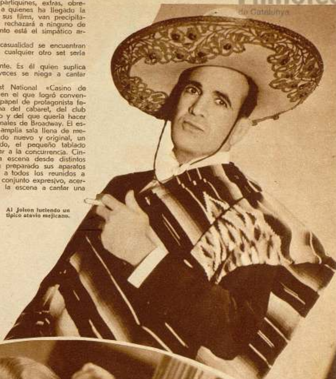
Al Jolson luciendo un típico atavío mejicano.