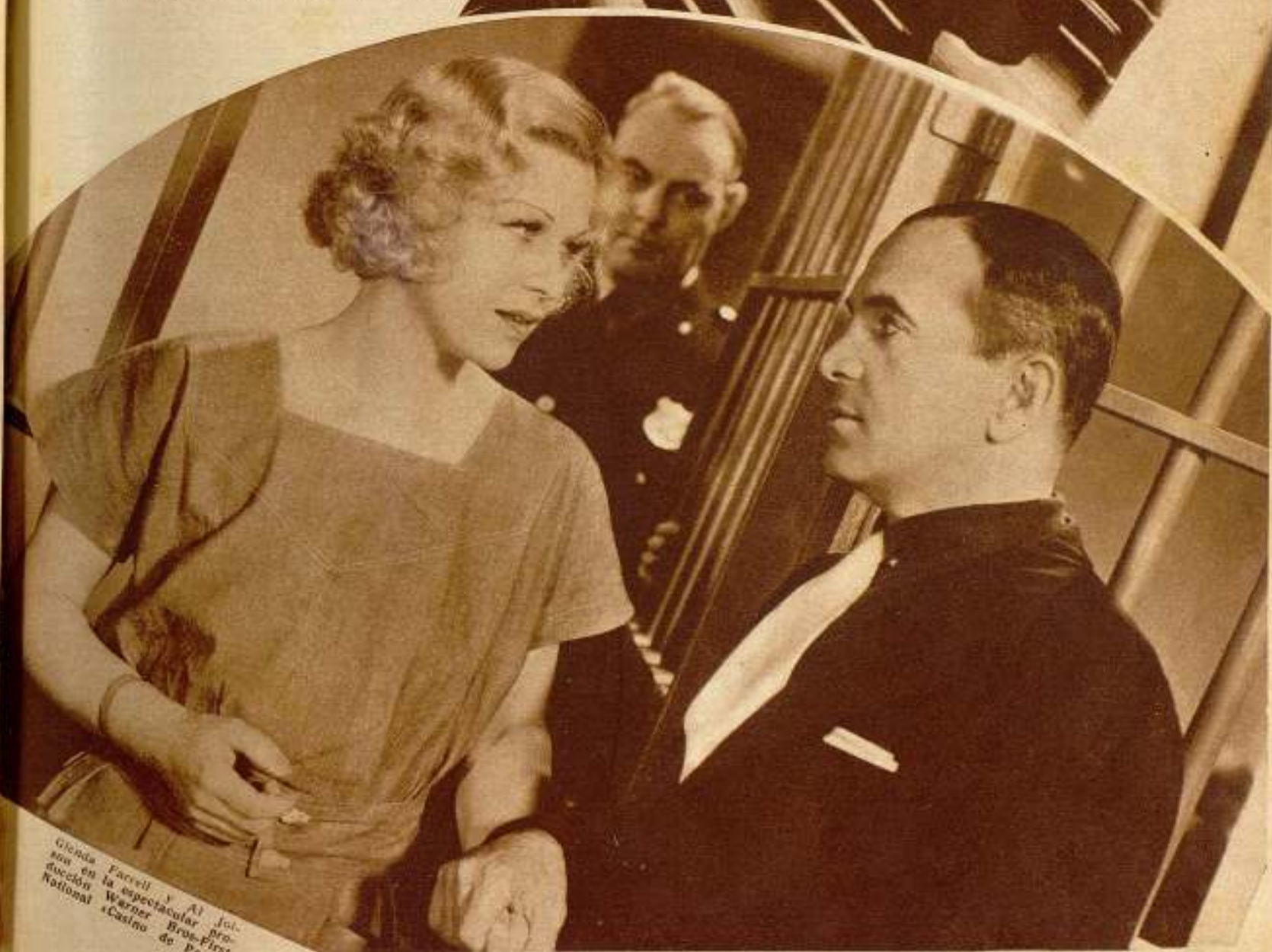
Glenda Farrell y Al Jolson en la espectacular producción Warner Bros-First National «Casino de París».