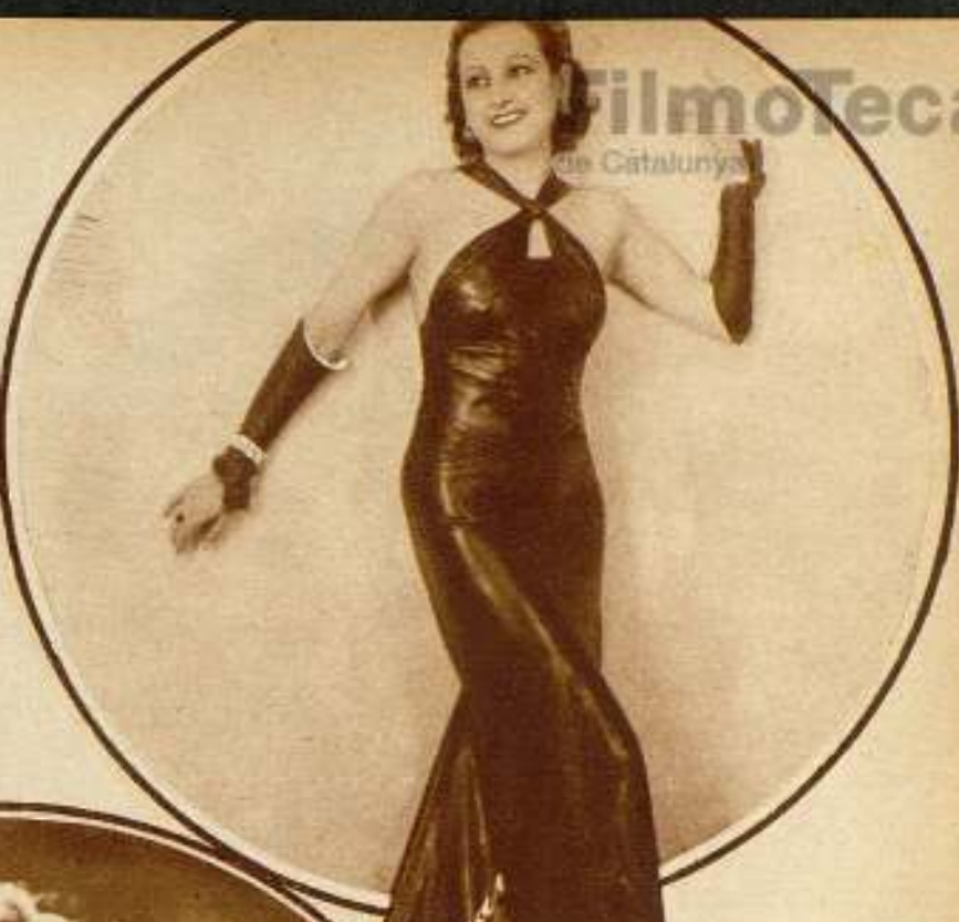
Arriba, izquierda: Otra de las bellas vistas de «María Elena».