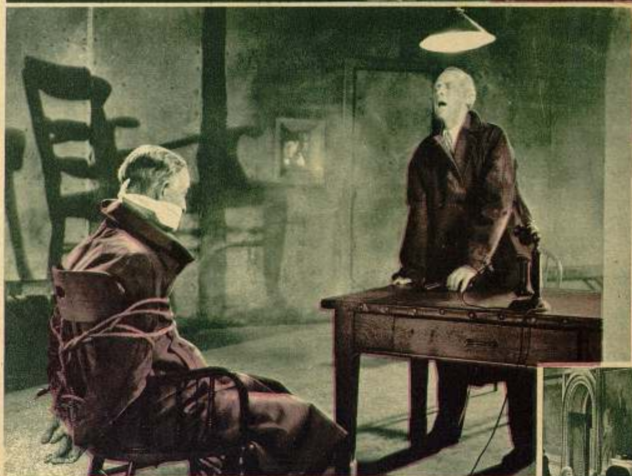
Varias escenas de la emocionante película Paramount «Mercaderes de la muerte».