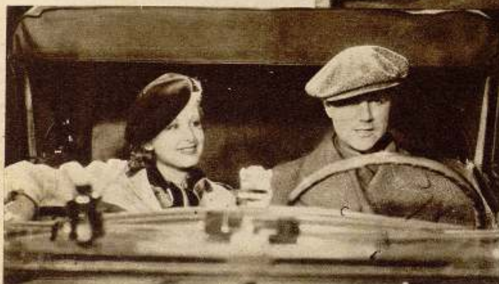
Escenas de la adaptación cinematográfica de la conocida obra del ilustre sainetero don Carlos Arniches «Es mi hombre», en la que se ha revelado como gran astro de la cinematografía hispana el admirado actor teatral Valeriano León.