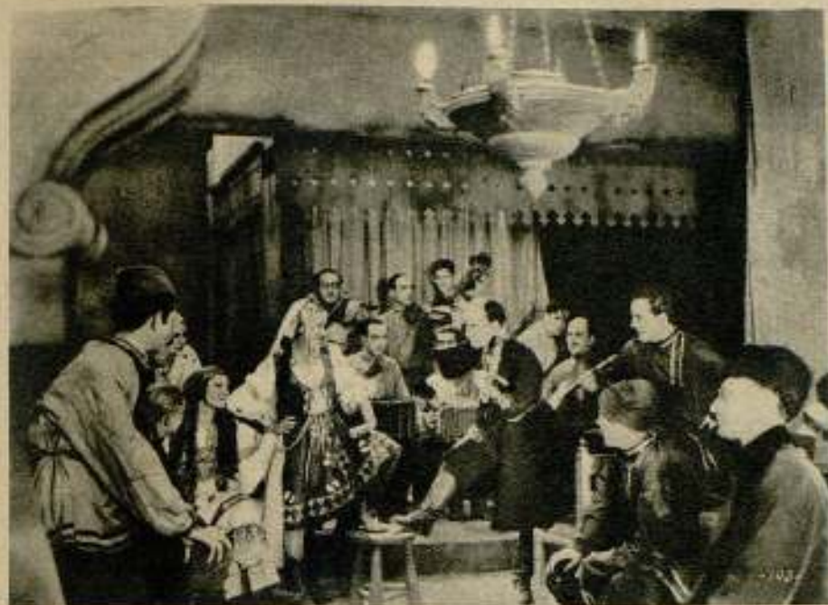
En «Romana rusa» hay escenas de color moscovita como esta, que se desarrolla en la típica taberna, donde se baila y se canta al compás de ricas melodías folklóricas.