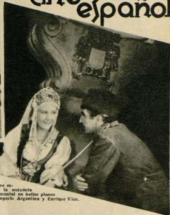
...Y se esboza la anécdota sentimental en bellos planos de Imperio Argentina y Enrique Vico.