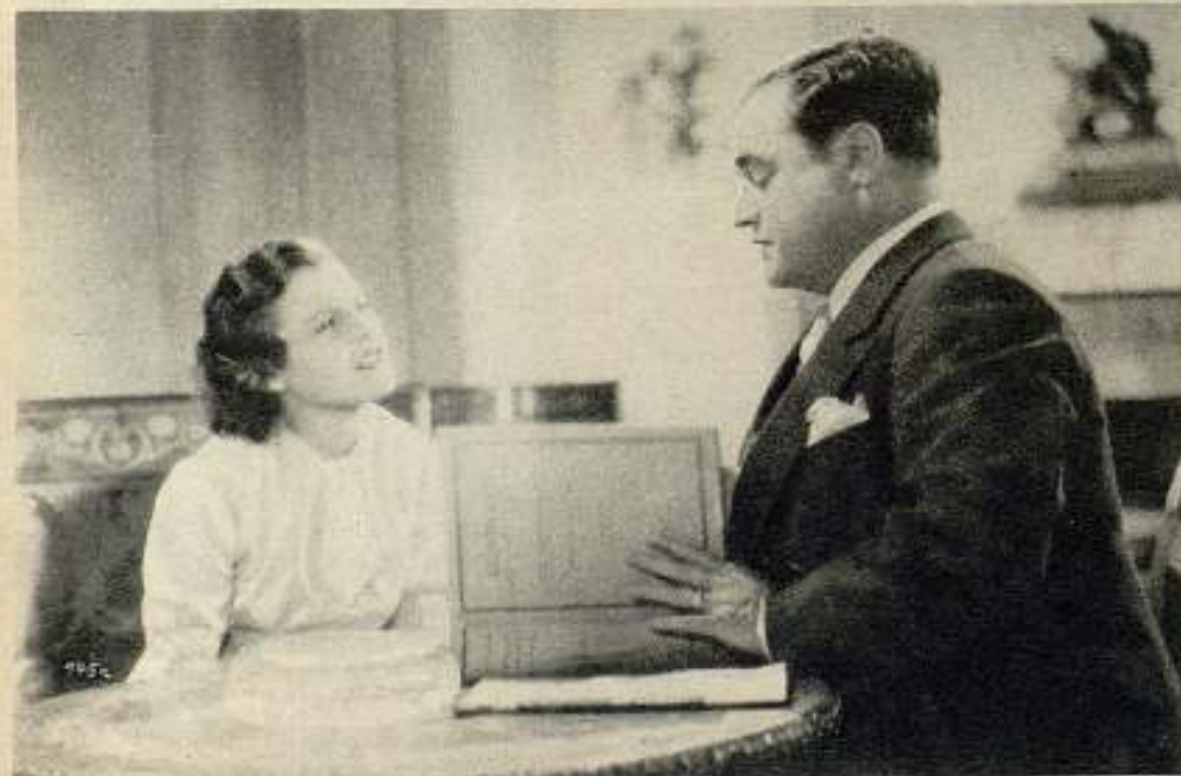
Beniamino Gigli, el famoso tenor de ópera, representa el papel principal en la nueva producción itala "No me olvides", con Magda Schneider como compañera.

La selección de Frank Borzage como direc-