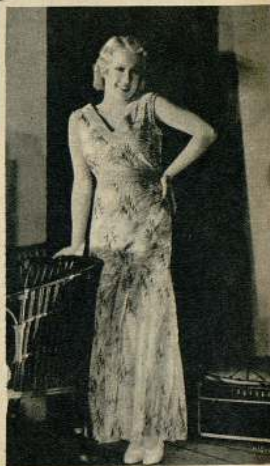
Anita Page era la moderna ingenua, de rostro expresivo y tipo de vampiresa.