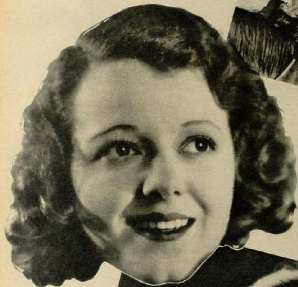
Janet Gaynor y Marion Nixon, encarnadoras del cuento de hadas iniciado por Mary Pickford.

Sugas son estas palabras que nos complacemos en reproducir: «La horizontal despierta en todo ser humano una sensación primaria, idéntica. El negro despierta en todo ser humano una sensación primaria, idéntica. Ningún misticismo, en todo eso.