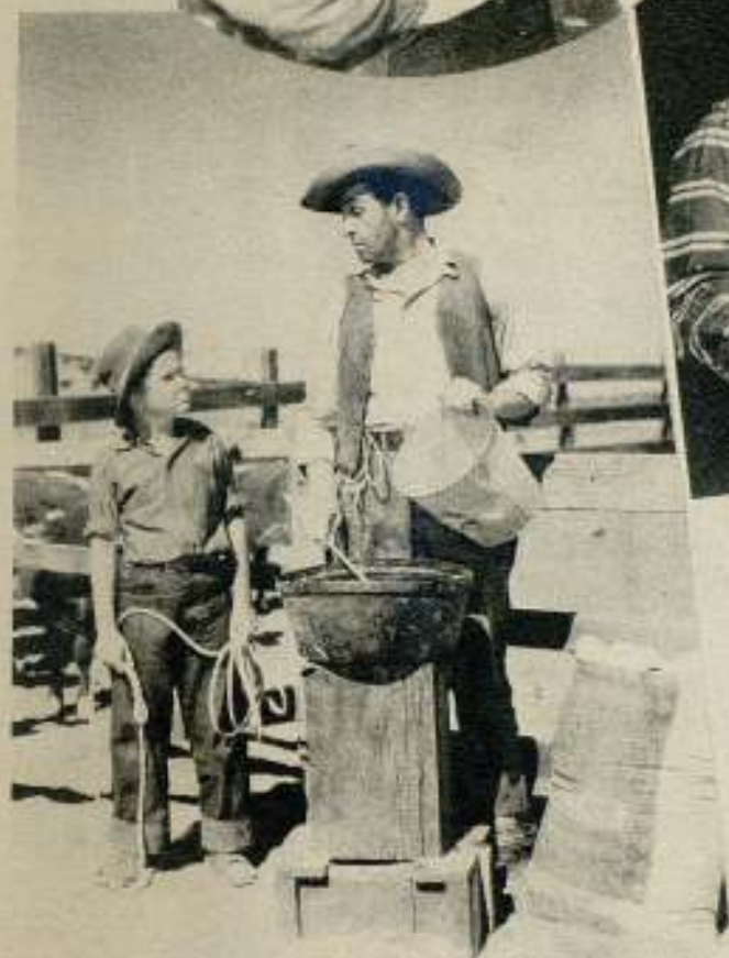
Jackie Cooper en «Un hombrecito valiente».