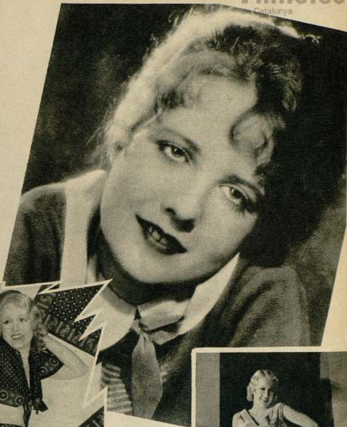
Anita Page cuando hizo su primera película.

la que se deseaban las caricias más suaves, los besos más amorosos, dados en silencio.