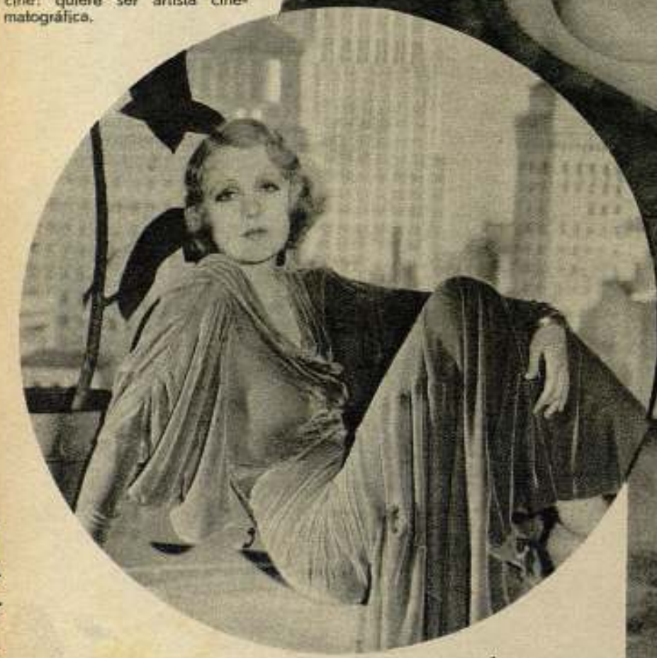
Era la novia blanca del cinema para la que se desvanían las caricias más suaves.

Es una muchacha de su época y ama los de- portes. Pero su pasión es el cine: quiere ser artista cine- matográfica.