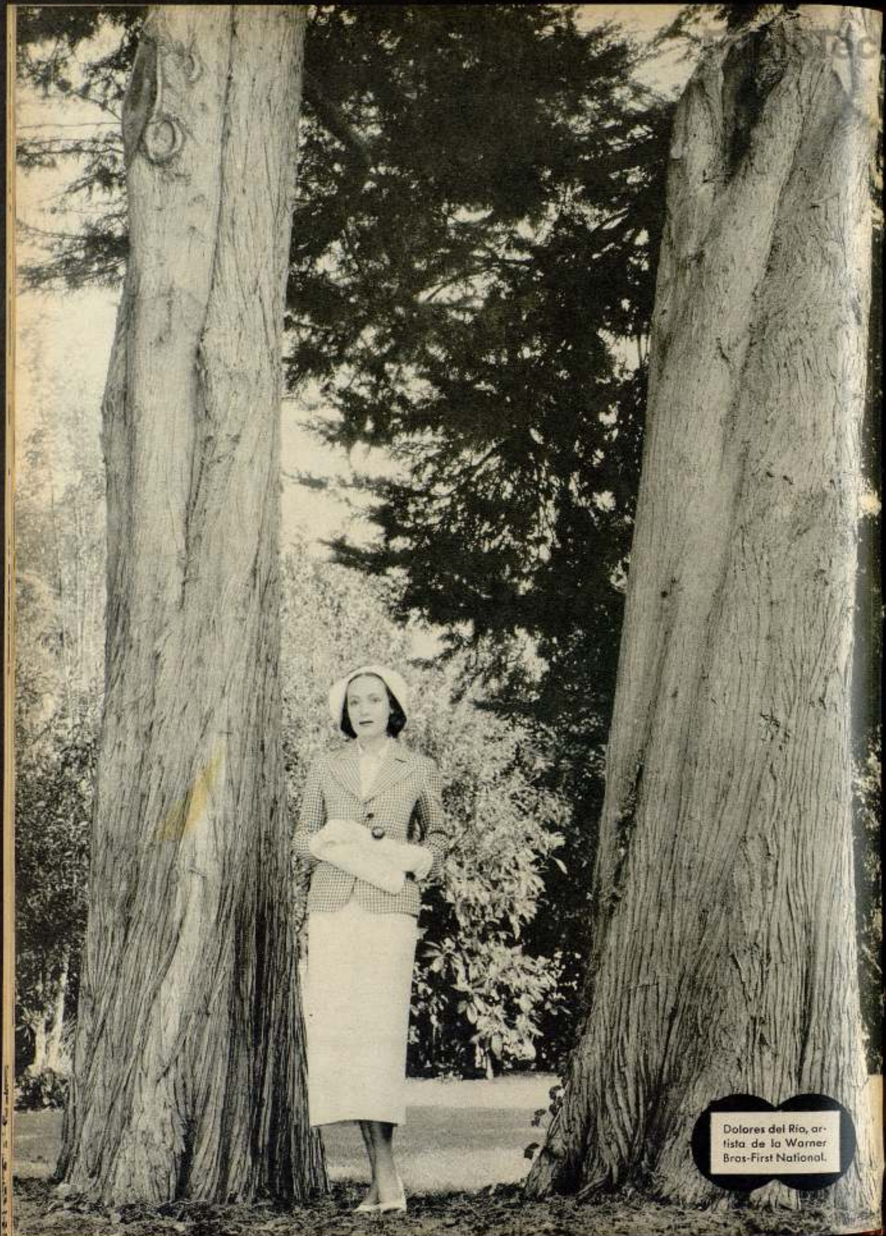
Dolores del Río, ar- tista de la Warner Bras-First National.