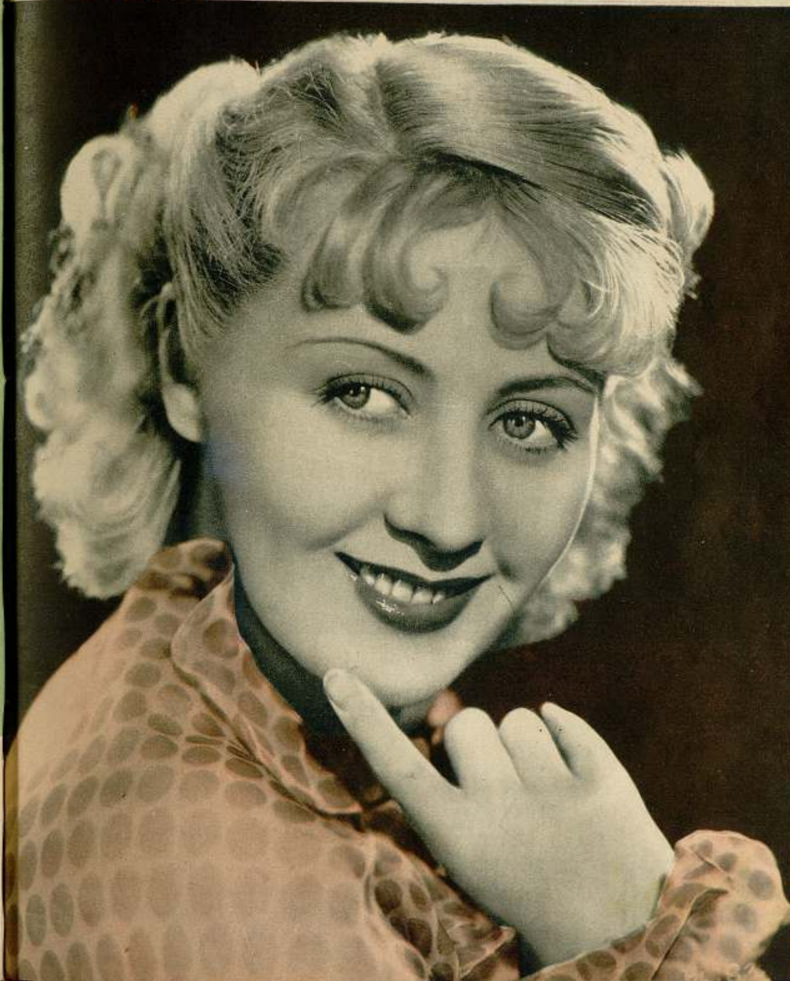
Joan Blondell, bella simpática estrella de Warner Bros First National.

Exija con este número el SUPLEMENTO ARTISTICO y el pliego de novela