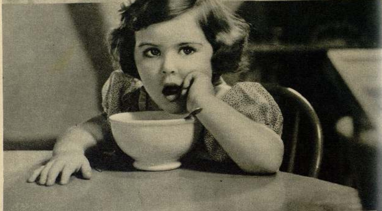
Mary Astor y Baby Jane, principales protagonistas de «Doble intriga», película Universal.