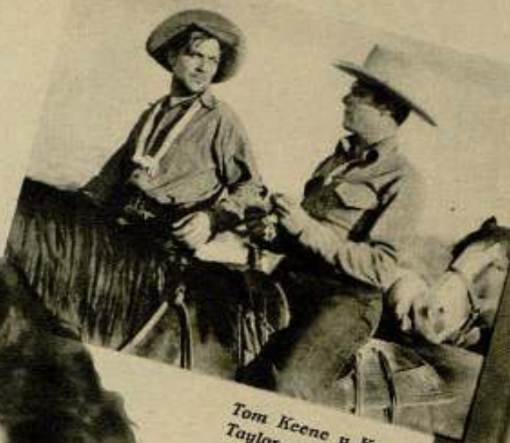
Tom Keene y Kent Taylor en «Paso del sol poniente», película Paramount, inspirada en una célebre novela de Zane Grey