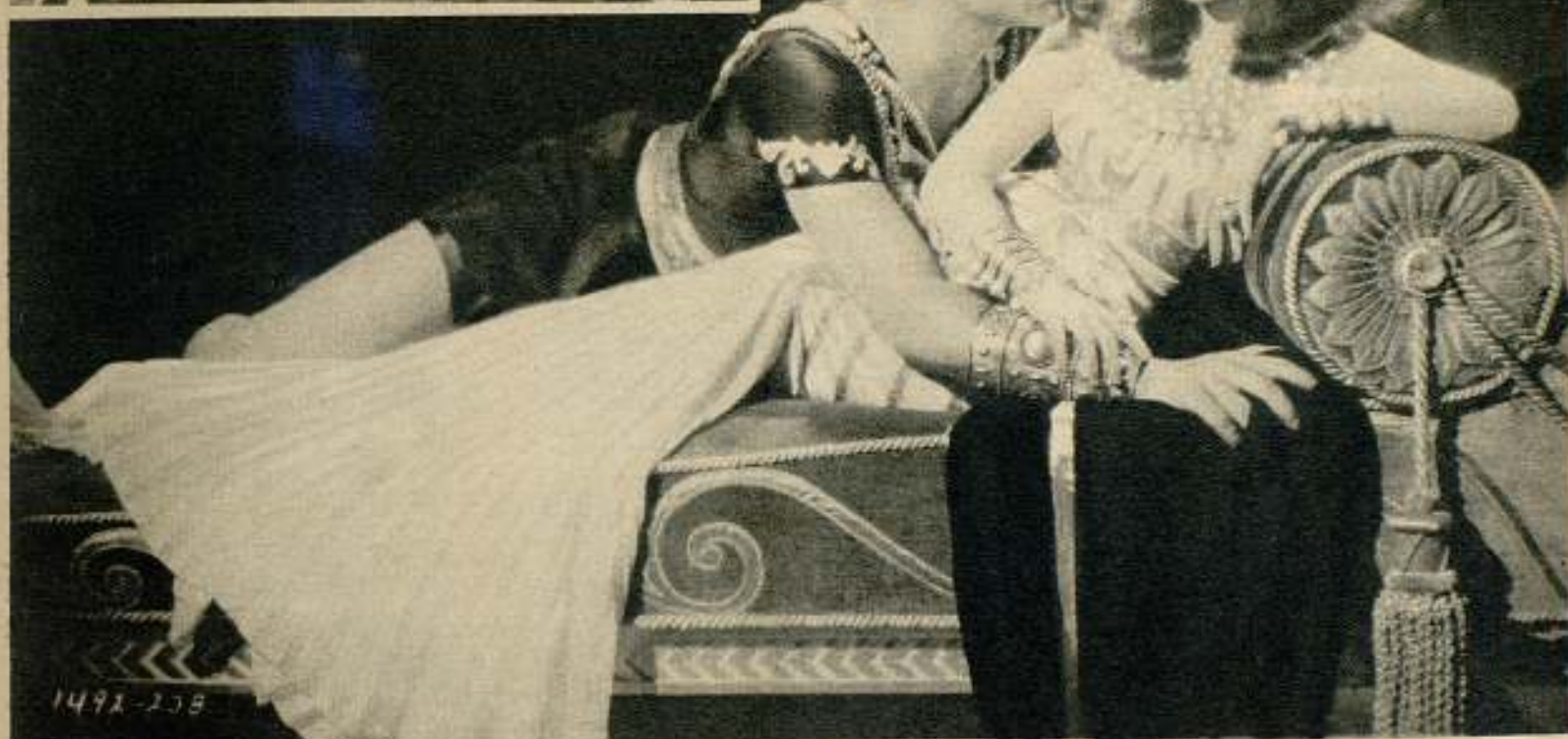
Claudette Colbert en el papel de «Cleopatra», en la película de igual nombre, realizada por Cecil B. de Mille. En esta escena está con Henry Wilcoxon, que caracterizó a Marco Antonio.