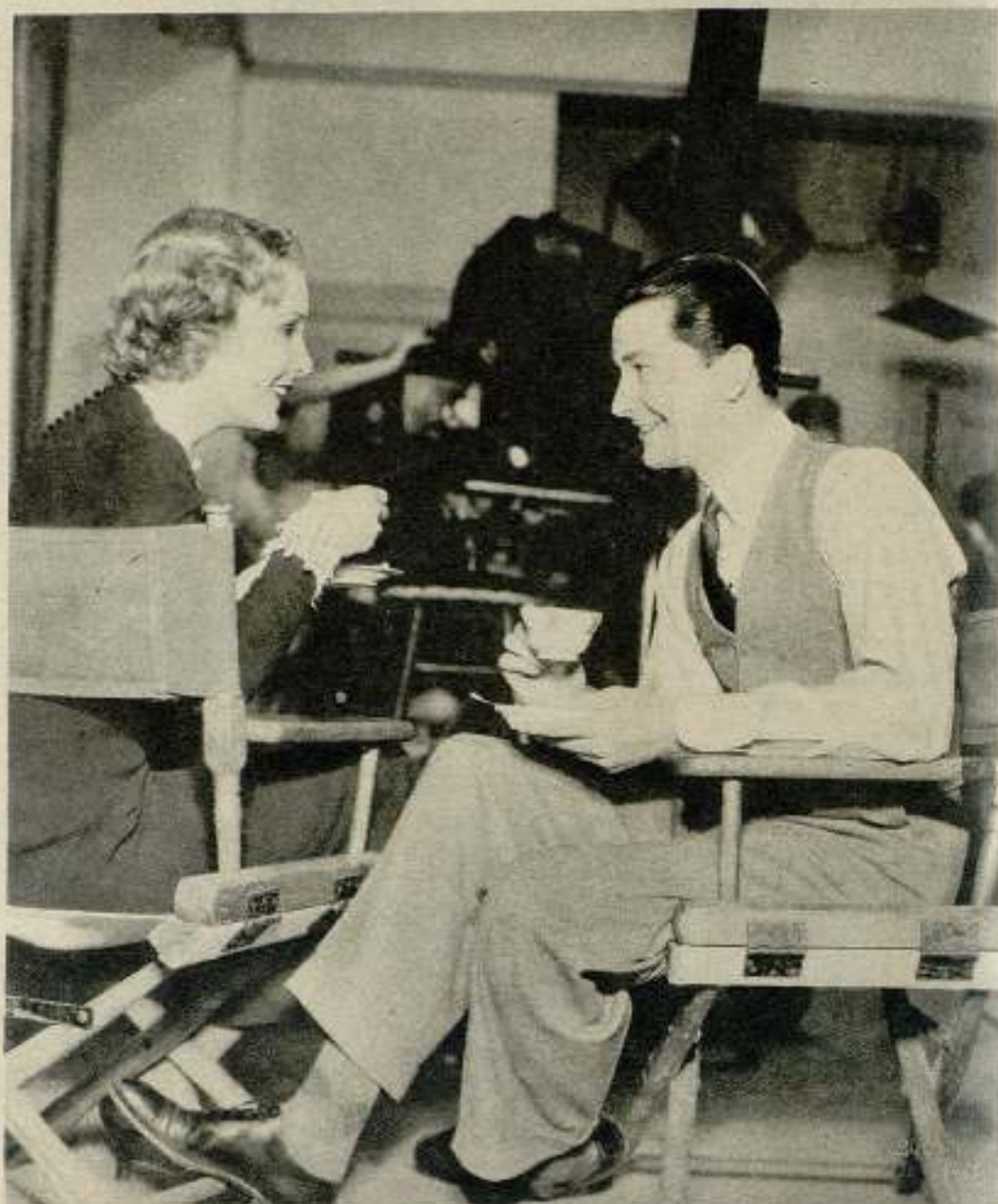
Madge Evans y Robert Young entre escena y escena charlan y toman una taza de té.

Entre las últimas películas rodadas en estudios de la capital argentina, existen algunas que merecen especial mención. Una de ellas, la más recientemente realizada es "Crimen a las 3".