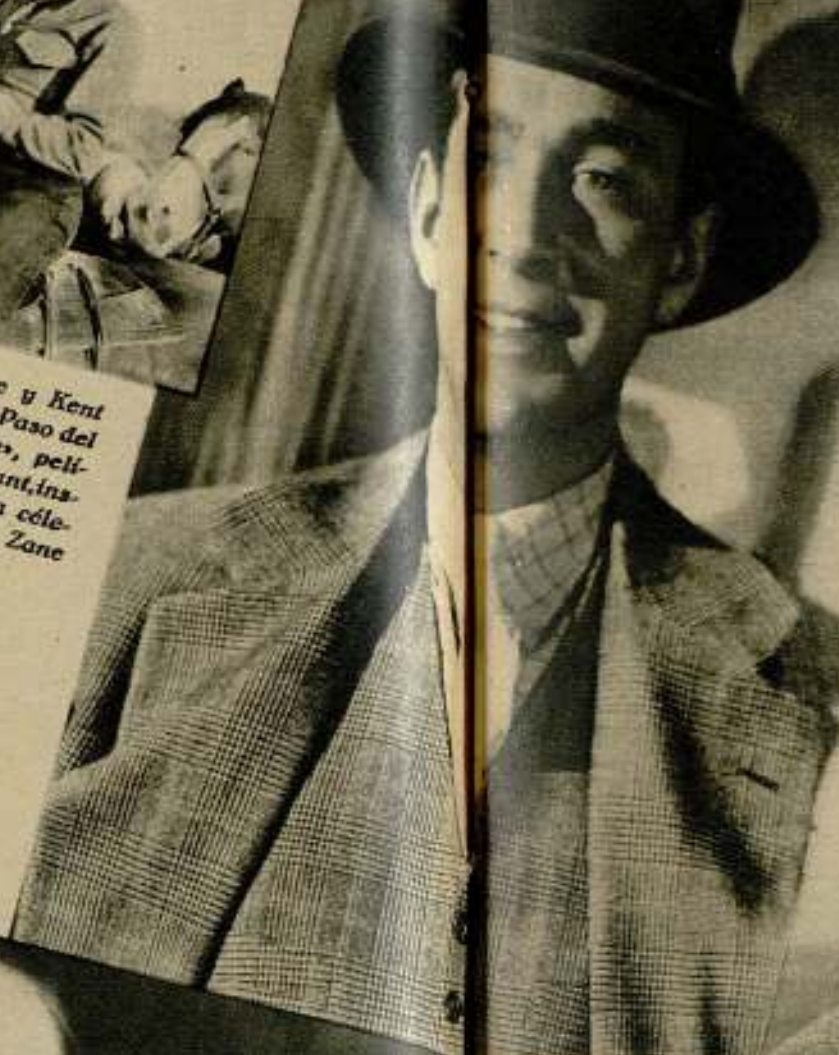
James Dunn y Charles Farrell, héroes de historias ingenuas que exhalan un encanto poético que no deja insensible a ningún espectador.