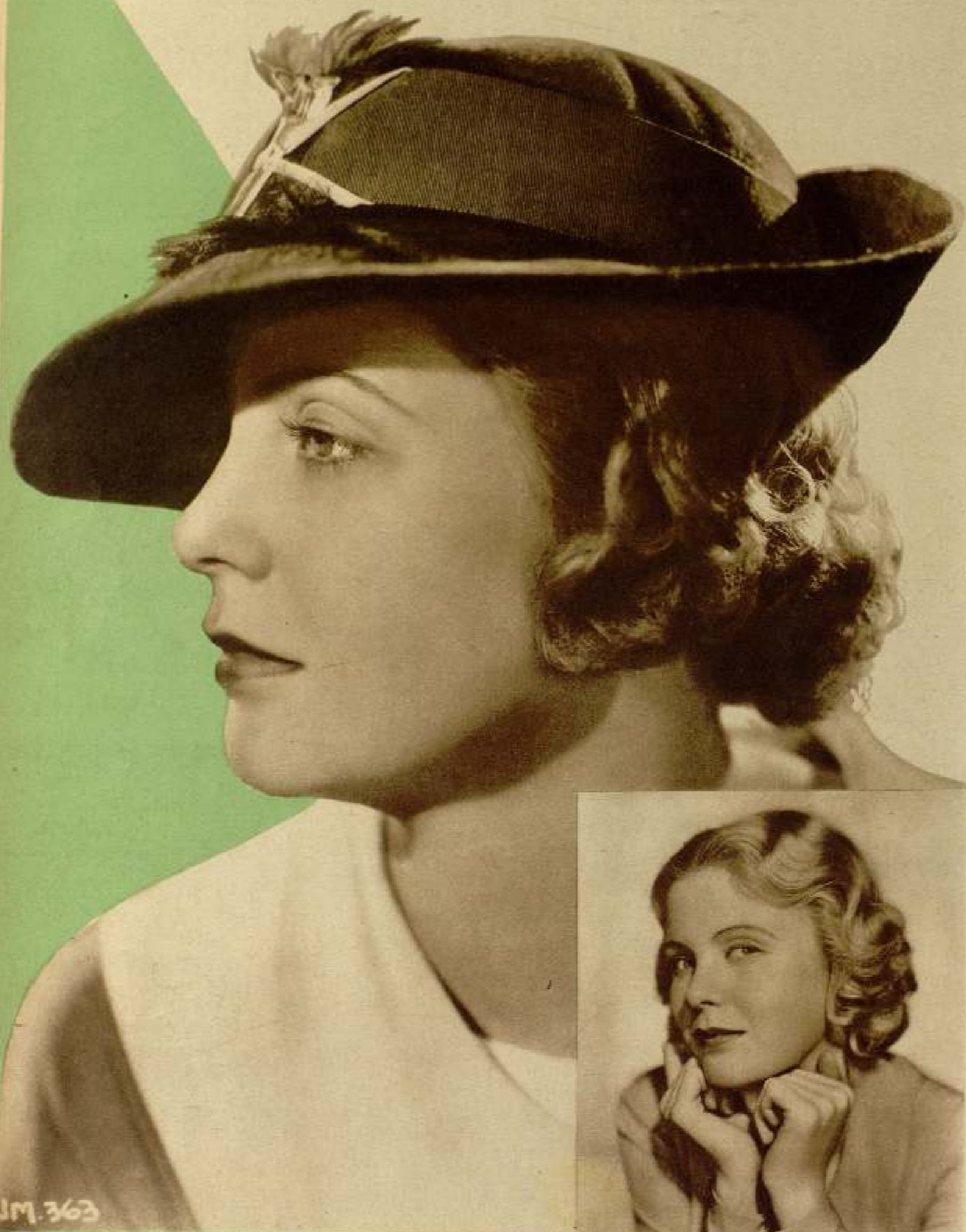
Jean Muir, de la Warner Bros-First National