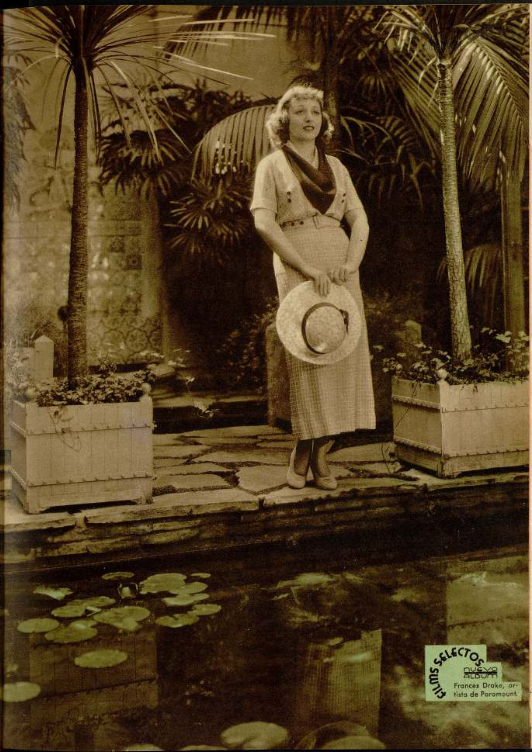
FILMS SELECTOS NUOVO ALBUM Frances Drake, ar- tista de Paramount.

pro- statu- York, tarea Una ald y o el fal trues, in- el la- si yo ex- At is y con arch, in in Mac sido film, igual dar acter erso- dena mme es: mocer n las aliza- ector bri- rdes pro- por ón n ento. guir leta- ellos arte, pa- rea- por e de o al que serie peru cada Qué Sen- ción- n de pe- uedo cada fuer- tanto ten- e re- anto e de Po- te se ten- iente espi- tista cisco stas. enell deas, dió- rata, man- os de na de creo e de illos cep- efec- ción. una am- cero, tirat, e ex- a; es nego genio e así me de la Teó- dra- con- n1.-