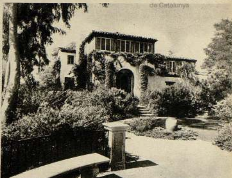
La casa de Claudette Colbert en Hollywood.