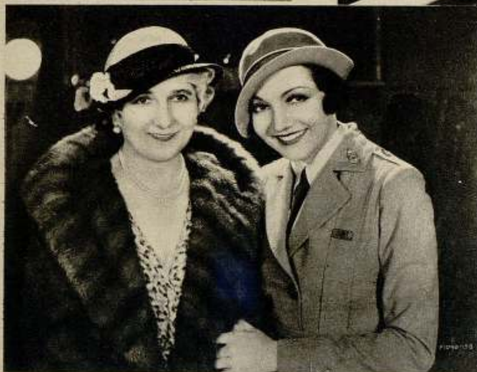
Madre e hija. La madre es la inseparable compañera de Claudette Colbert, en casa, en el estudio y en todas partes. Esta fotografía fue tomada mientras se rodaba la película «El hombre de ayer» (The Man From Yesterday).