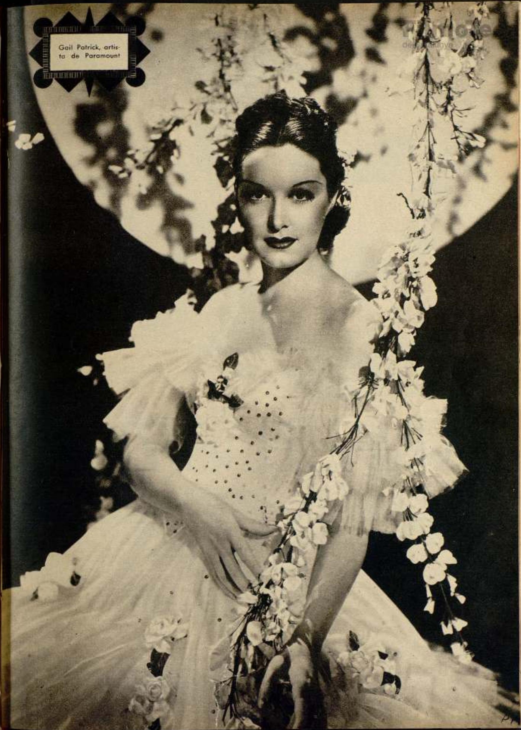
Gail Patrick, artis- ta de Paramount