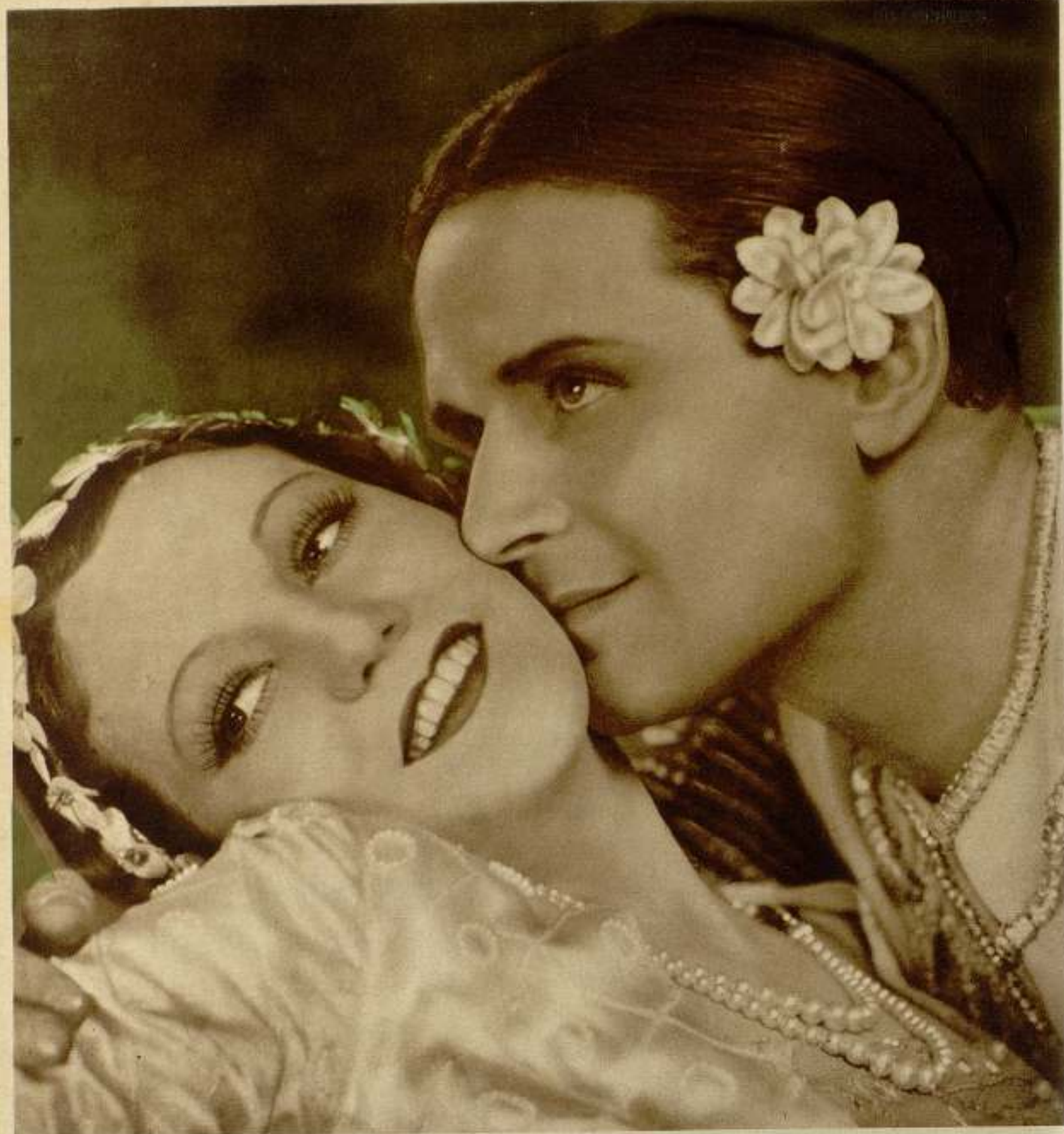
Kate de Nagy y Pierre Blanchard en la película Ufa «El diablo embotellado»