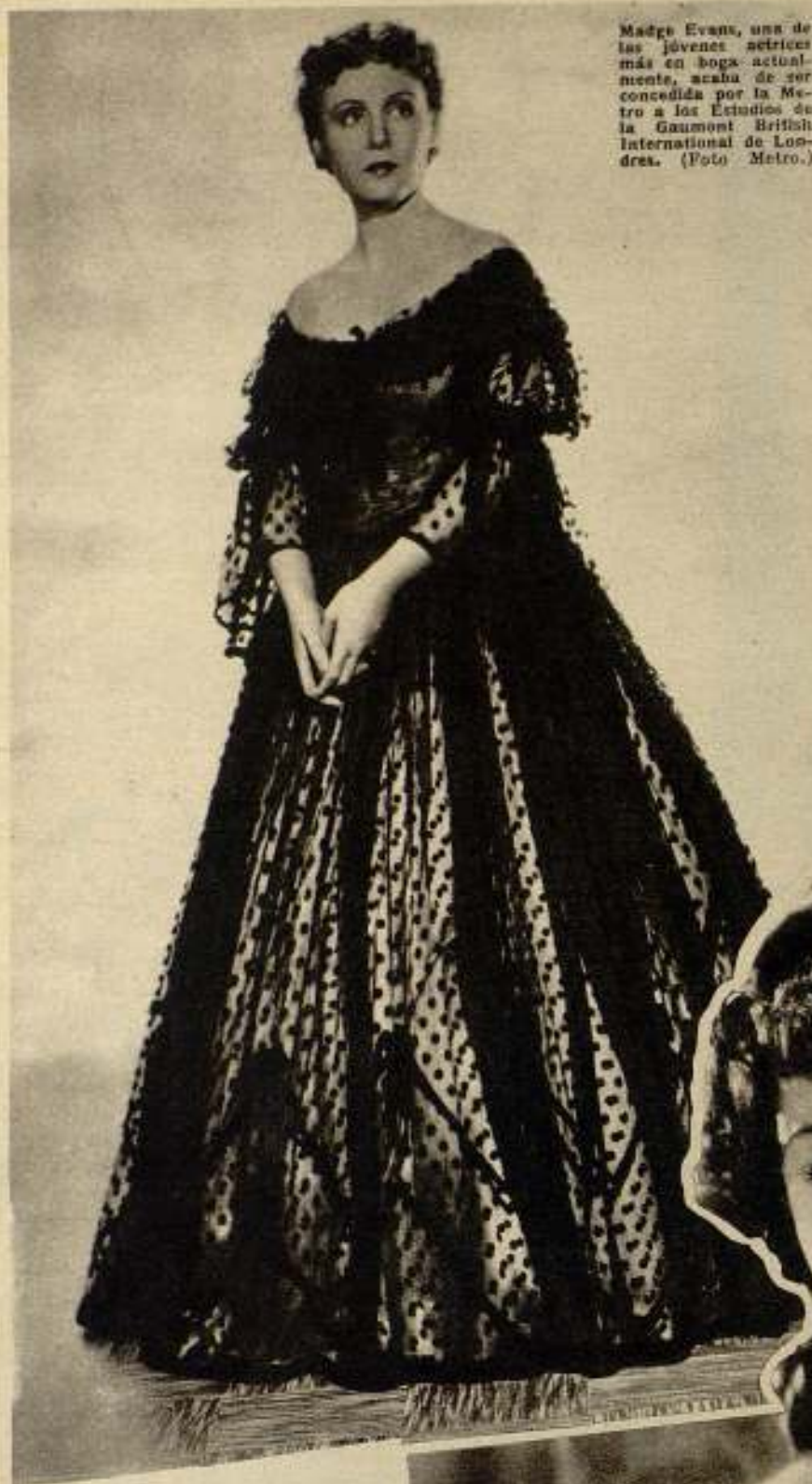
Madge Evans, una de las jóvenes actrices más en boga actualmente, acaba de ser concedida por la Metro a los Estudios de la Gaumont British International de Londres. (Foto Metro.)

ce ser una segunda naturaleza en el ser humano. Ramón Novarro, por ejemplo, cuya ascensión a la gloria y cuya colosal fortuna las debe a Hollywood, adonde llegó sin otro legado más que el de las esperanzas, para convertirse en uno de los actores de mayor prosapia en el mundo entero, acaba de hacer declaraciones que entristecen el espíritu de los que aún creen en el sentimentalismo de la lealtad... Ramón Novarro se expresa en términos poco gratos a Hollywood. Dice que no volverá a prestar su contingente a las películas americanas y que la colonia del cinema sólo le deja amarguras y sentimientos de rebellón. Sin embargo, Ramón Novarro jamás hubiese llegado a la posición artística y económica en que se encuentra actualmente si no hubiera sido por esa misma candidez proverbial de Hollywood, donde figuras anónimas llegan al pínaculo de la gloria en un espacio brevísimo por cierto.