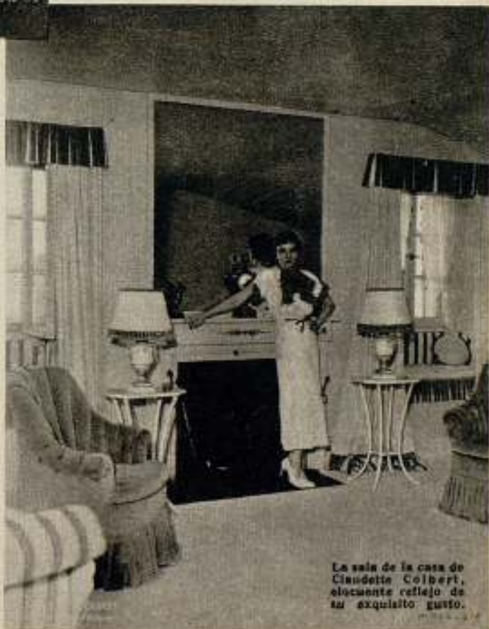
La sala de la casa de Claudette Colbert, elegante reflejo de su exquisito gusto.