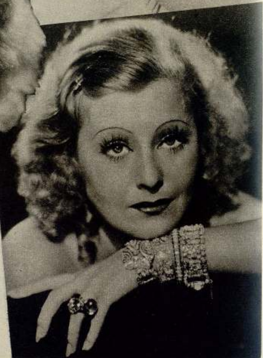
Lillian Harvey vuelve al patrio suelo para reanudar sus interrumpidos servicios filmicos y cosechar nuevos laureles.

Esta entrevista a la gran actriz británica es, quizás, una de las más interesantes en nuestra carrera de periodistas cinematográficos. Cicely Courtneidge tiene todo el «savoir faire» de las artistas continentales. Sin ser joven, su personalidad es atrayente y fascinadora. Contemplamos llenos de admiración y entusiasmo el juego diplomático entre la actriz