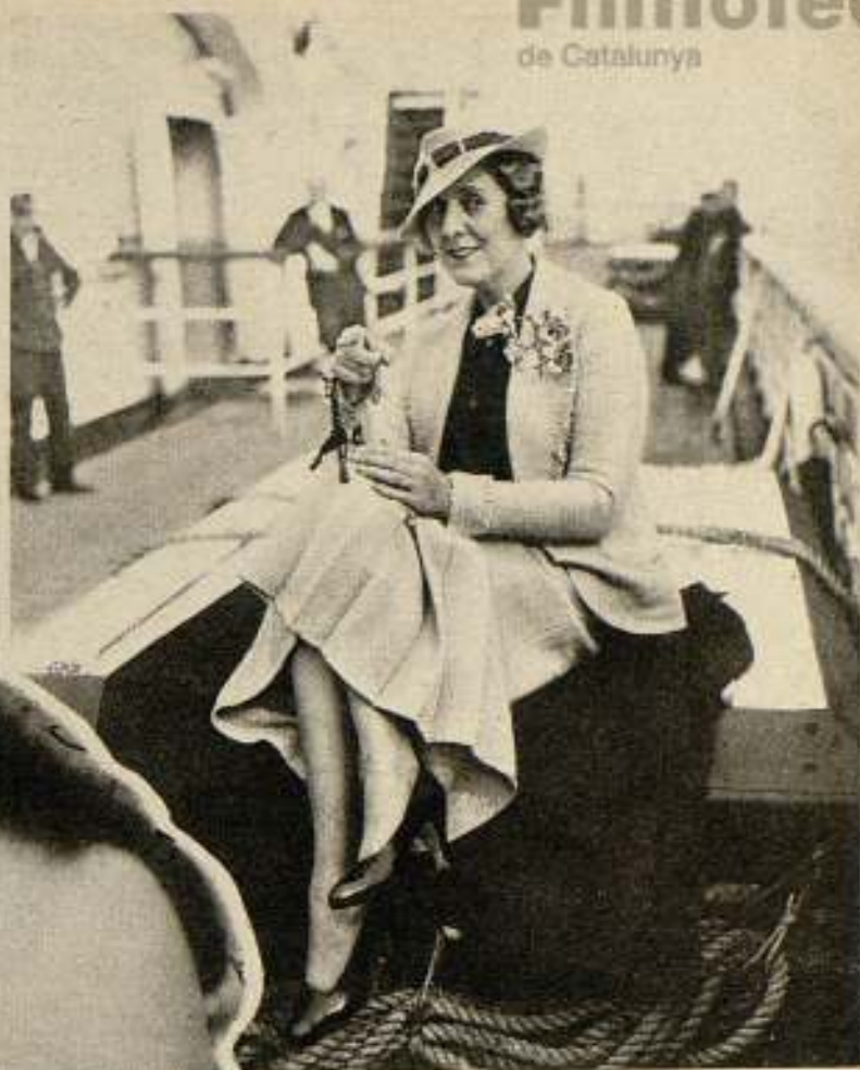
Cicely Courtneidge, la gran actriz de carácter, inglesa, que acaba de llegar a Hollywood, importada por la M. G. M.

Para Cicely, cada obra, por mala que haya sido, tiene un ángulo, una escena, un punto digno de encomio. Llevada por su entusiasmo patriótico, cita infinidad de películas producidas en Inglaterra, que pueden compararse favorablemente con las mejores producciones de la América y otras que son, sin duda, insuperables en cada detalle que las producidas por Hollywood.