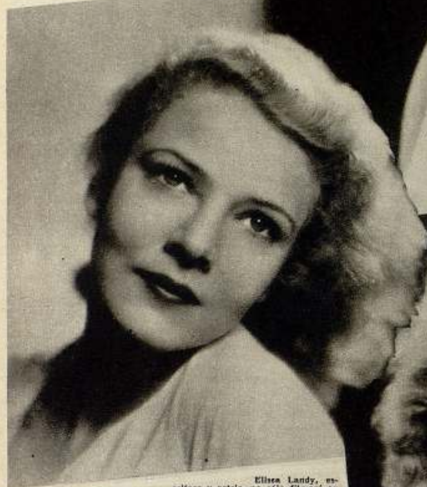
Elissa Landi, escritora y actriz, no sólo filmará en Londres, sino que ha sido favorablemente contratada por una compañía francesa, con un salario excepcional.

intercambios de estrellas, la casa filmadora de la Metro-Goldwyn-Mayer importa la primera actriz inglesa, y dos días después de haber despedido al grupo de artistas antes mencionados nos encontramos entrevistando a Cicely Courtneidge, estrella continental de fama bien establecida en el teatro legítimo, en la pantalla y en la radio de Londres.