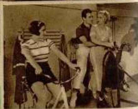
Tres escenas de «Julietta compra un hijo», película española de la Fox cuyo principal papel interpreta la genial artista Catalina Bárcena.