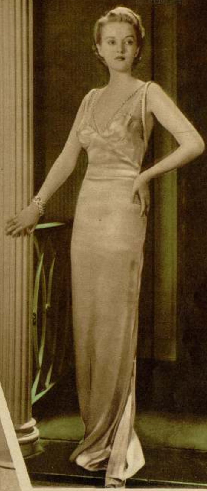
Vestidos para noche presentados por los artistas de la Univer- sal Phyllis Brooks (1), Valerie Hobson (2) y June Clayworth (3)