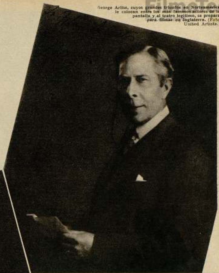
George Arliss, cuyos grandes triunfos en Norteamérica le colocan entre los más famosos actores de la pantalla y el teatro legítimo, se prepara para filmar en Inglaterra.

on, a pesar de haber sido modesta mesera de café, hizo una fortuna y fama bastante grandes; para poderse asegurar más tarde un título nobiliario de la orgullosa Europa.