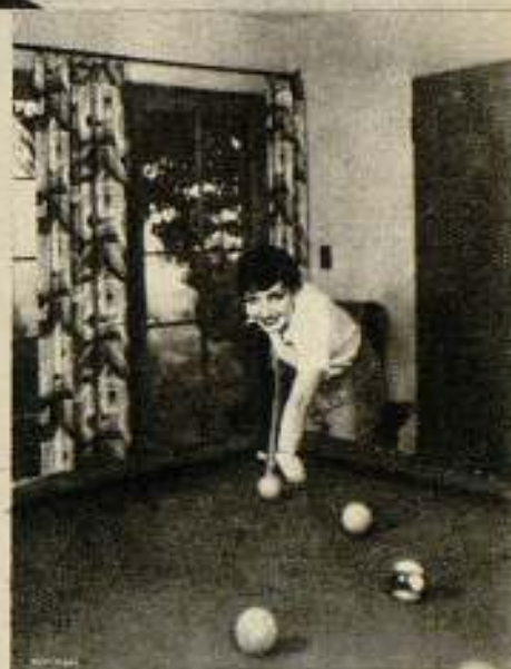
Claudette Colbert instaló un billar en su casa para entretenerse a su antojo.