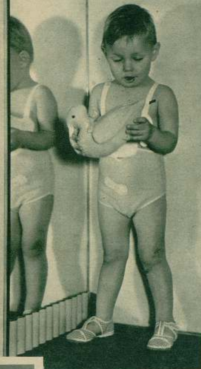
Baby Le Roy, un pequeño que triunfó plenamente «robándole» así a Chevallier la película «El soltero inocente».

Cuando uno ve el trabajo de la chiquillería cinematográfica no puede comprender que en lo que hacen exista una norma, que estén ceñidos a órdenes de director y de técnicos, que hayan aprendido un papel, que estén, sencillamente, «haciendo comedia». La impresión es más bien la de haber entrado sigilosamente en una «nursery» y asistir, en se-