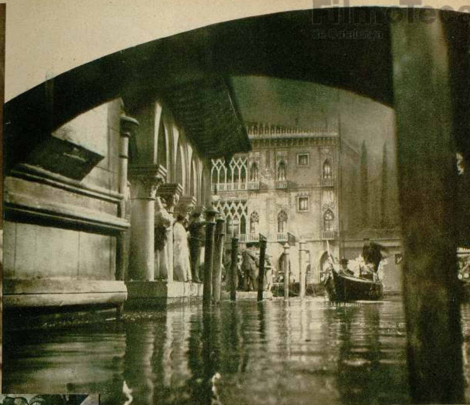
Varias escenas de la película Ufa «Barcarola» de cuya versión francesa son protagonistas Edwige Feuillère y Pierre Richard-Willm.