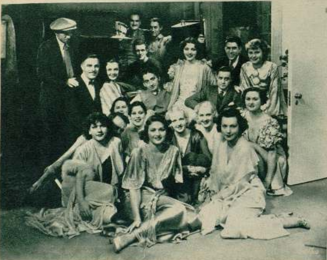
Hermoso grupo de chiquillas que tomaron parte en la película "Asegure a su mujer", producida por la casa Fox Film.