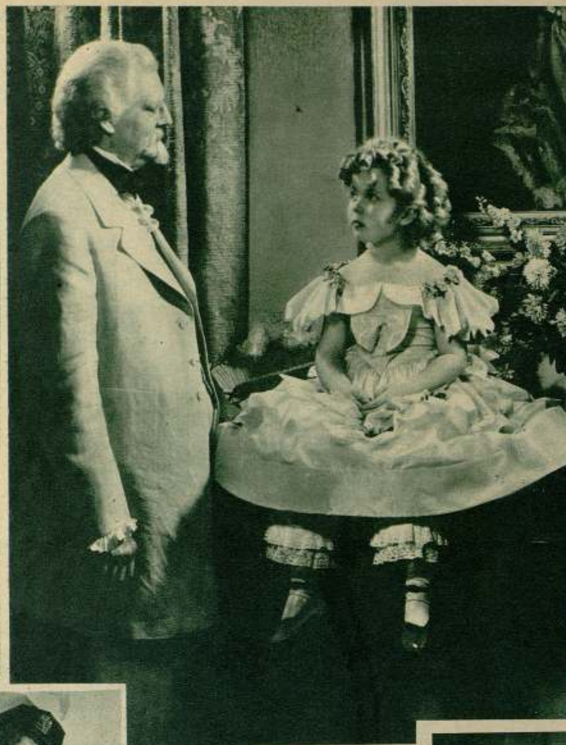
La pequeña grande artista Shirley Temple en dos momentos de su nuevo triunfo la película Fox «La pequeña coronela».

Johnny Downs, ex astro de «La Pandilla» y hoy un mocetón de veintidós años, regresó hace poco a los estudios para trabajar en una