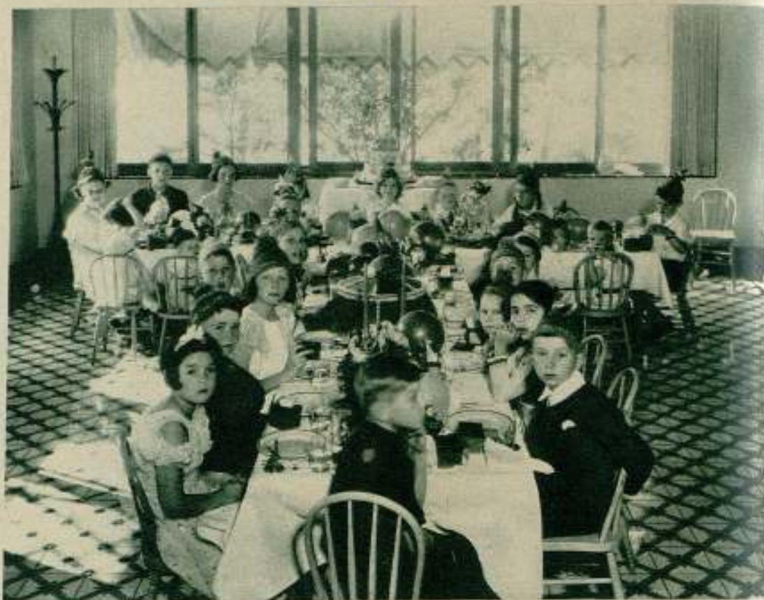
Merienda ofrecida por Shirley Temple a sus amiguitas el día de su cumpleaños.

En el Cameo, de Nueva York, sala central destinada con preferencia a la exhibición de producciones cinematográficas europeas, ha entrado en su octava semana de exhibiciones consecutivas en pleno éxito todavía, la película rusa "Chapayev", la cual, aunque no descuida la propaganda política, está realizada con un notable sentido reno-