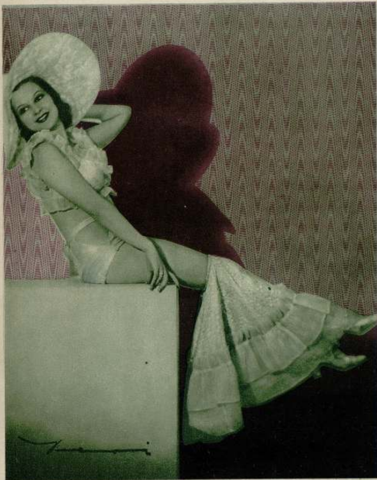
La artista española Mapi Cortés