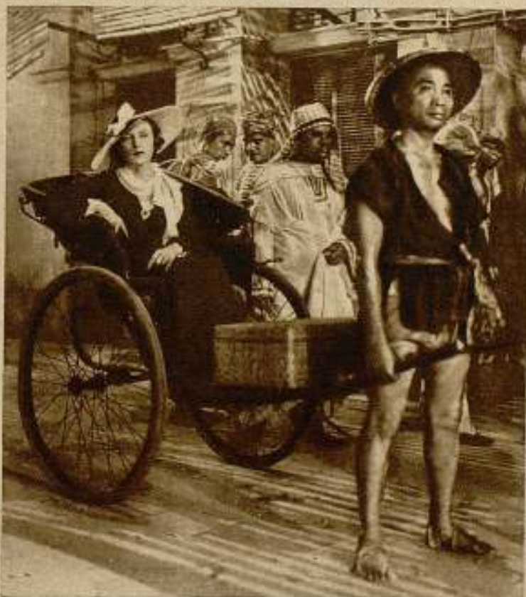
Berta Singerman en Nada más que una mujer .