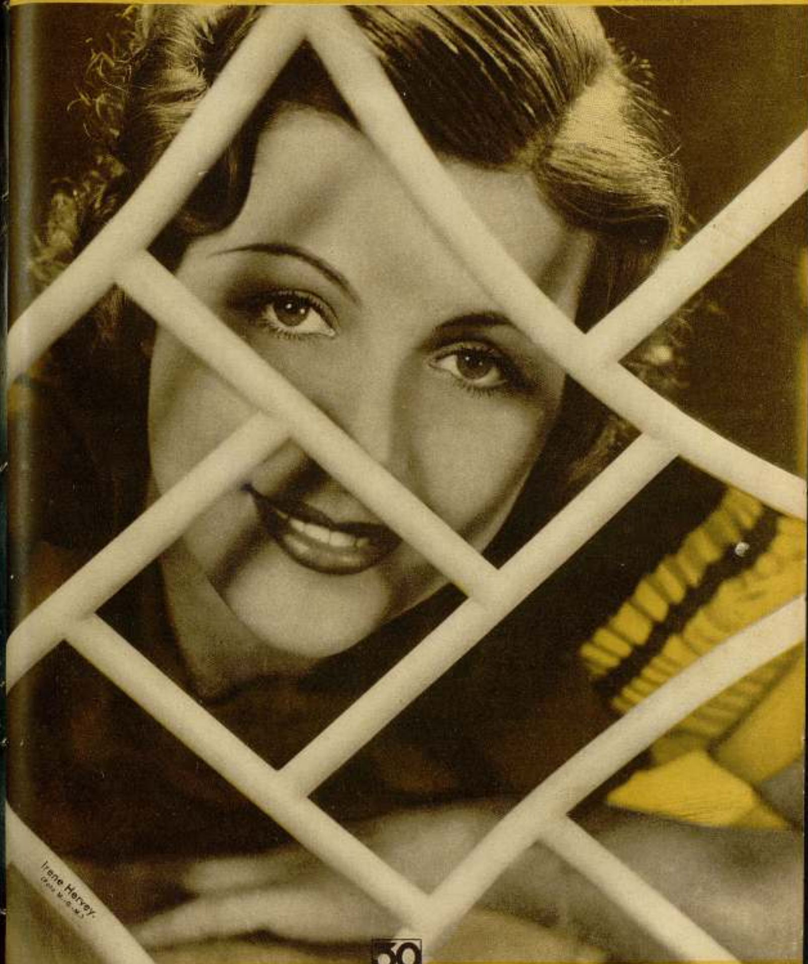
Irene Hervey. (1904-1984)