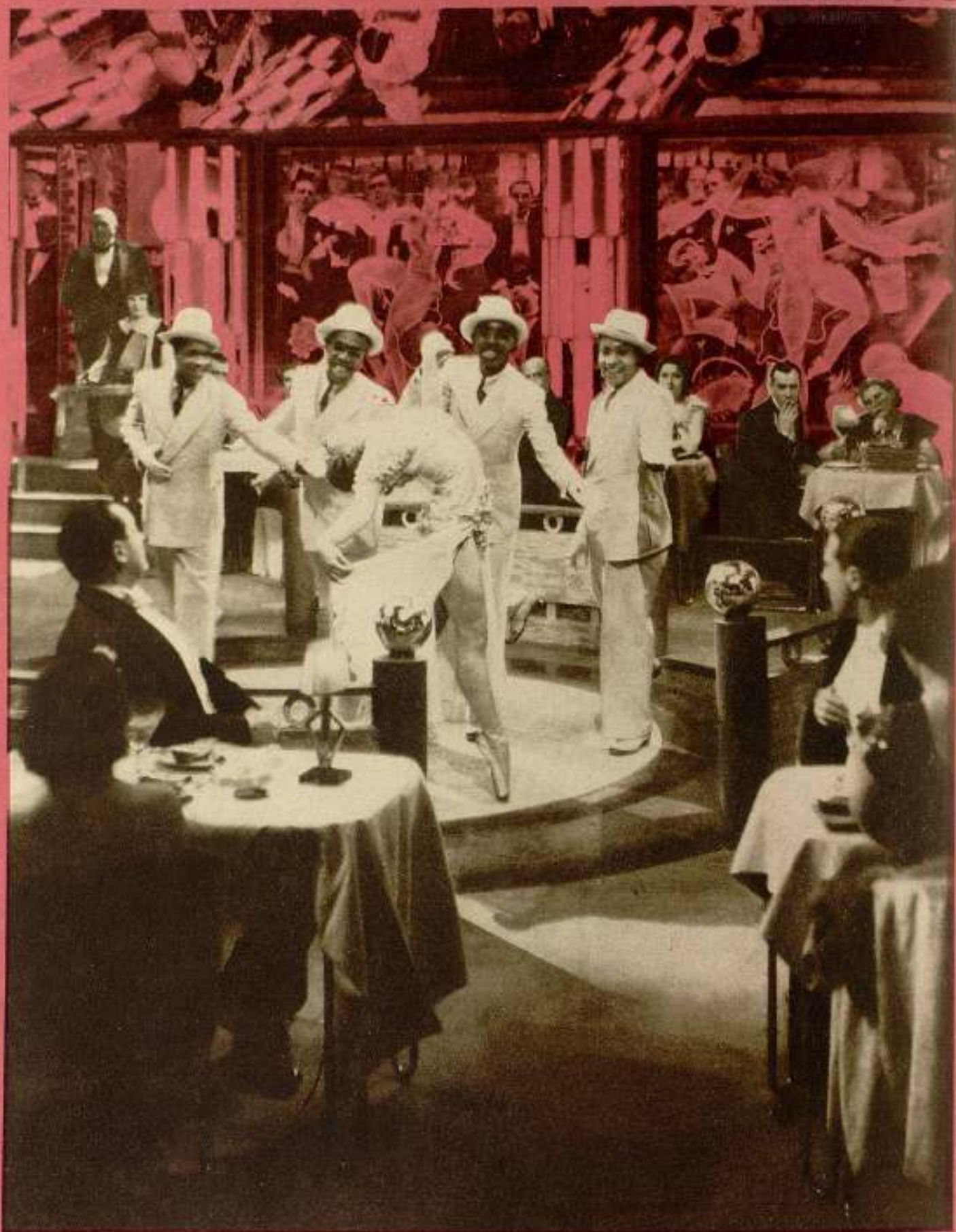
Espectacular escena de la película de Exclusivas Cines «La taquimeca se casa»