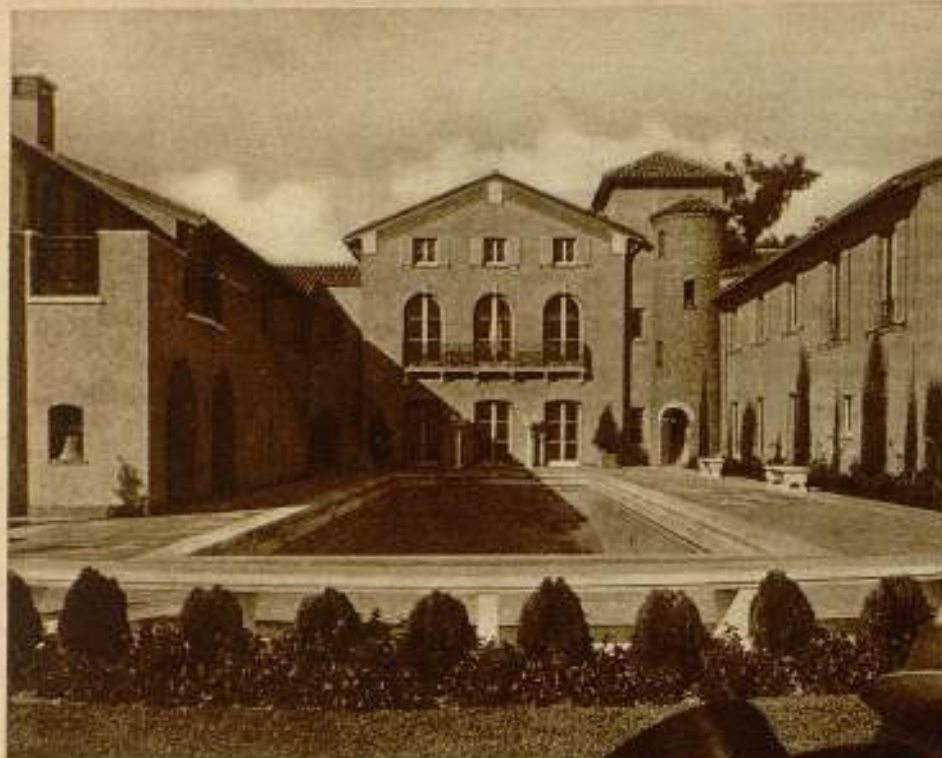
La antigua casa de Antonio Moreno, que él regaló para Asilo de huérfanos.

«HOLLYWOOD everybody!...» «Hollywood speaking!...» Antonio Moreno vuelve a nuestra pantalla. El popular actor hispano, una de las glorias más legítimas del cine, que le «universalizó» en la época de las películas mudas, va a presentarse por tercera vez junto a la inadjetable Catalina Bárcena. Ya han empezado a filmar «Mi segunda mu-