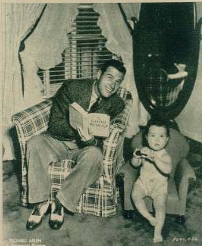
Richard Arlen enseña a su hijo a posar ante la cámara.