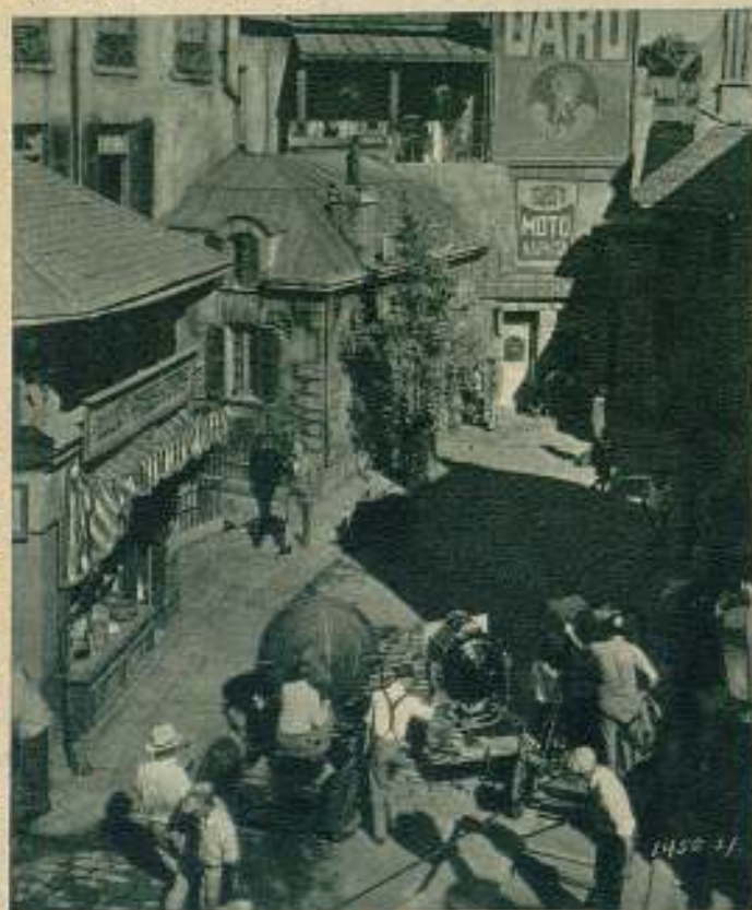
Rodando una escena exterior de la película Paramount «El modo de amar», cuyos protagonistas son Ann Dworak y Maurice Chevalier.

«Dos monjes», la película que será extraordinaria por su índole distinta y originalísima, ha continuado en pleno filmato durante la semana. Sus trabajos se están desarrollando con el celo y el tiempo necesarios para cristalizar la factura de una gran película, pudiendo decirse de ella que será una de las más gratas sorpresas que los filmadores nacionales darán al público en lo que resta del año.