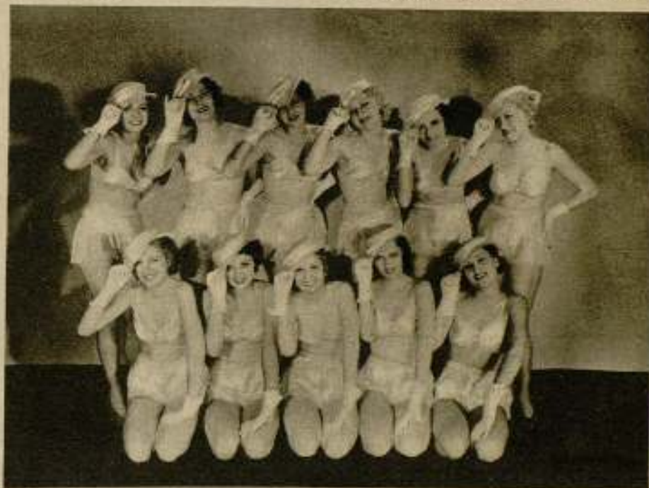
Grupo de bellas muchachas de la película Paramount «Cocktail musical».