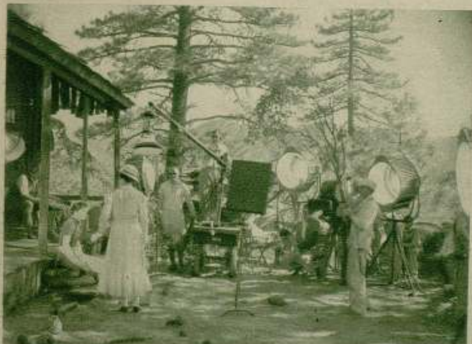
Filmando películas a dos kilómetros de altitud. Katharine Hepburn interpreta una escena de la película «Spittire» que acaba de hacer en las montañas de San Jacinto, al sur de California.

Tres películas magníficas rodará Alfred Hitchcock rápidamente, contratado por la Gaumont British.