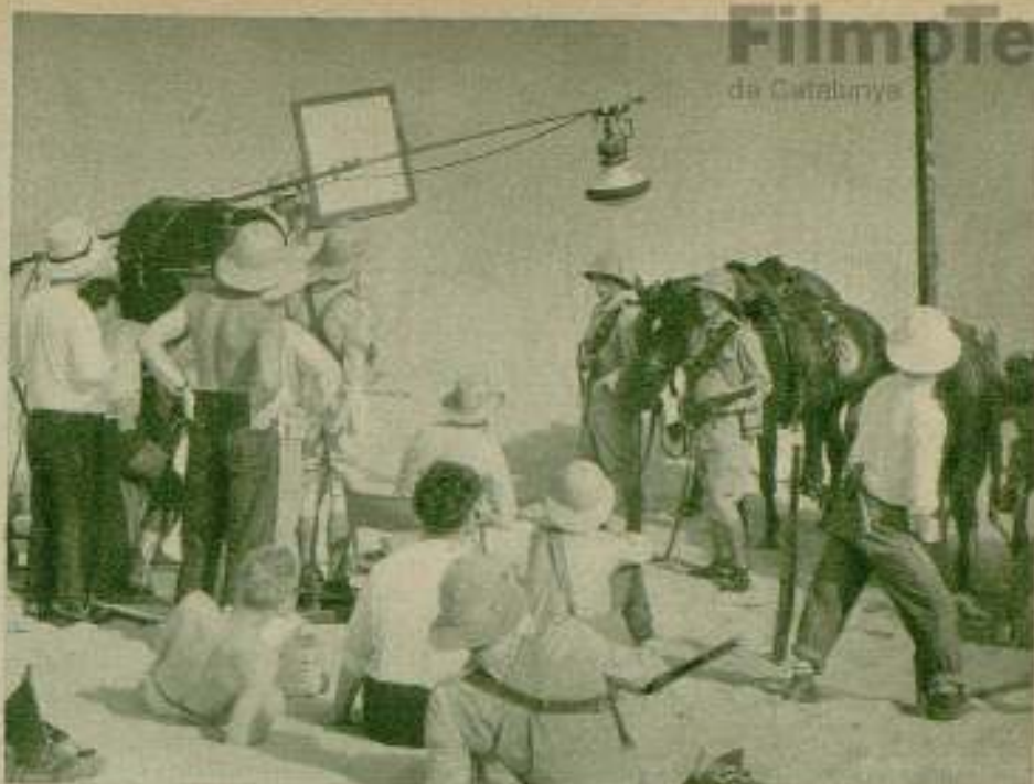
Las dificultades de filmar escenas en el desierto son aparentes en esta escena de «La patrulla perdida», de la R. E. O. Radio. Boris Karloff y Reginald Denny son los actores.