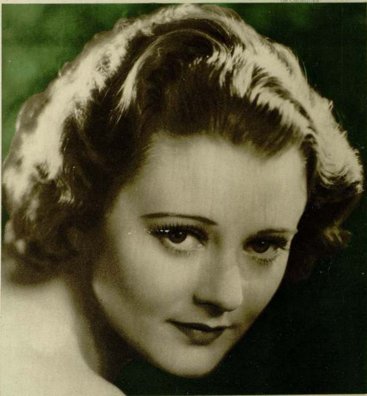
La joven y guapa artista de la Fox Heather Angel