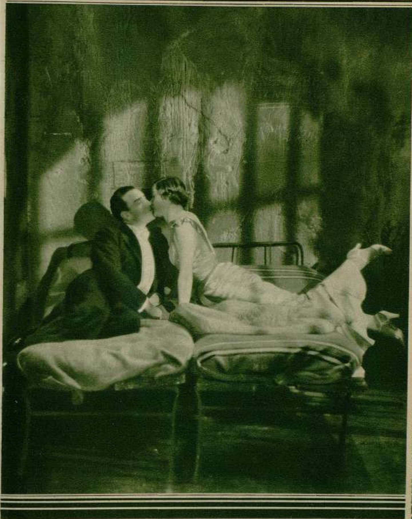
Marie Glory y Jean Murat en una escena de la divertida película de Exclusivas Cines «La taquimeca se casa»