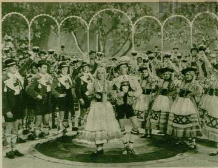
Belísima escena de conjunto de la película «La bailarina», de Metro-G.-Mayer.

quiere, pero no me ha dado jamás una respuesta definitiva. La gente dice que estamos comprometidos y hasta ha supuesto un matrimonio secreto entre nosotros. ¡Qué más quisiera yo!...—