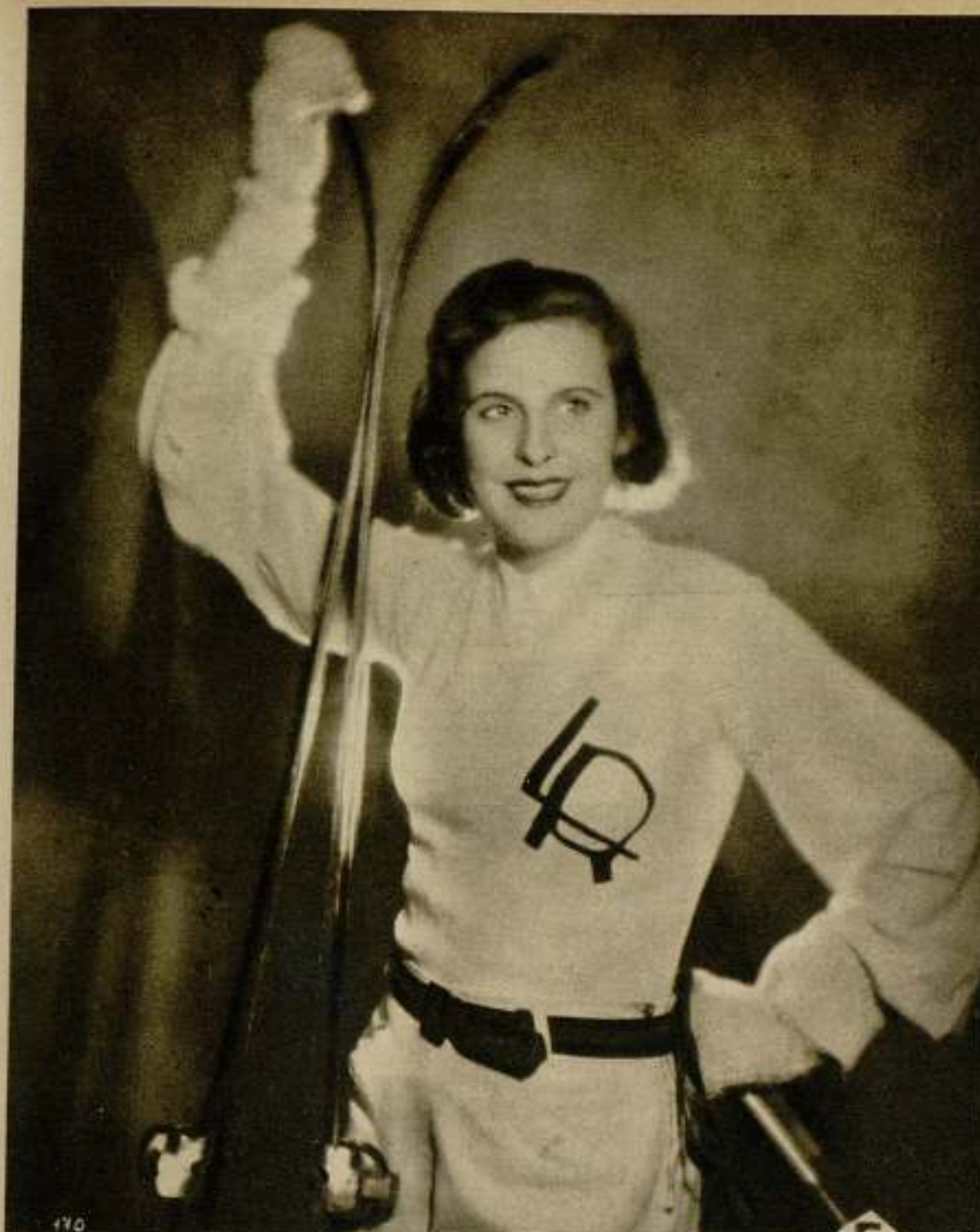
Leni Riefenstahl, la connotada actriz que demostró su gusto refinado, su conocimiento de la verdadera escuela cinematográfica, su extraordinario talento con «Luz azul», bellísima película de la que fué argumentista, director y protagonista.

mación de esta última cinta, el productor Samuel Goldwyn aseguró en un millón de dólares la vida de esta insignificante muchacha.