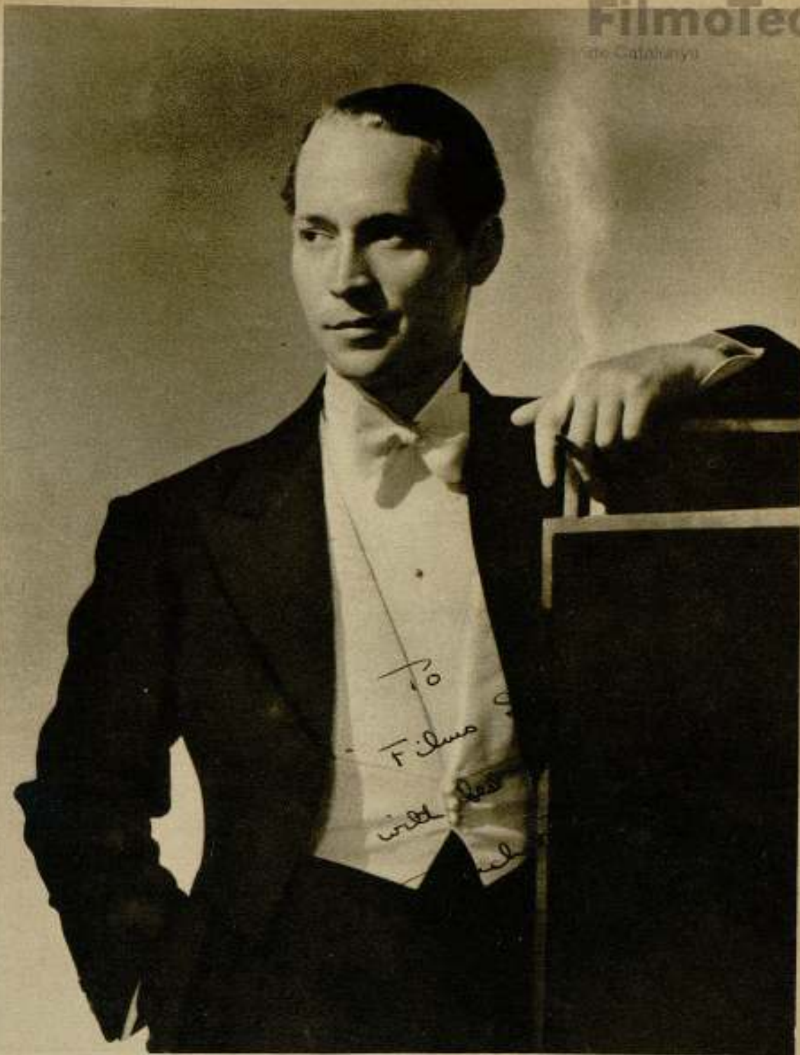
Franchot Tone, el nuevo galán joven, que confiesa francamente estar enamorado de Joan Crawford... (Foto dedicada a FILAS SELECTAS.)