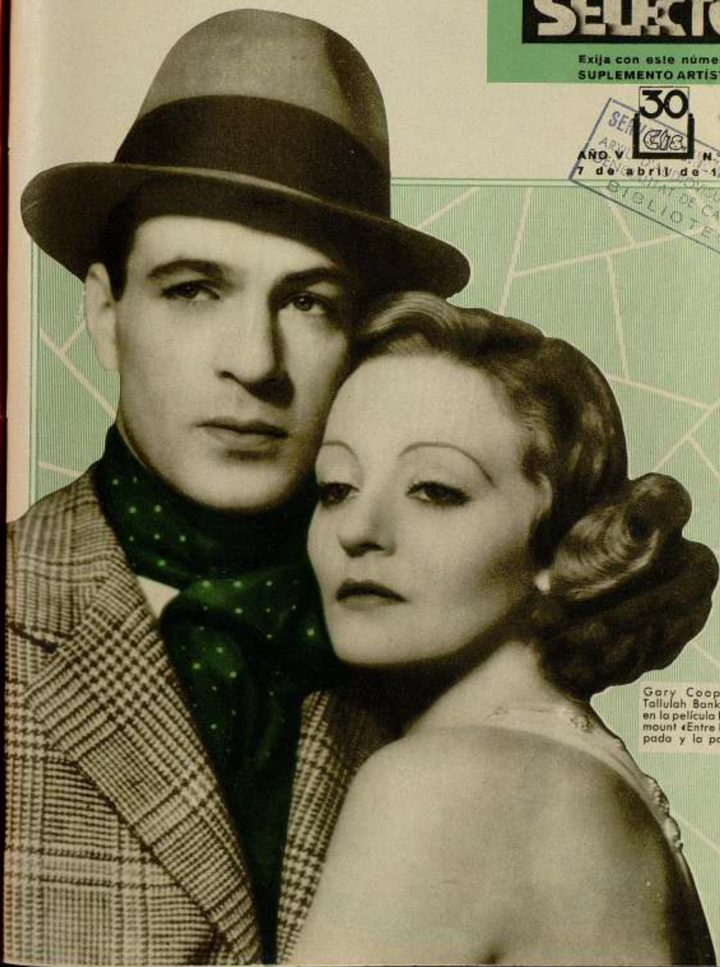
Gary Cooper y Tallulah Bankhead en la película Para- mount «Entre la es- pada y la pared»