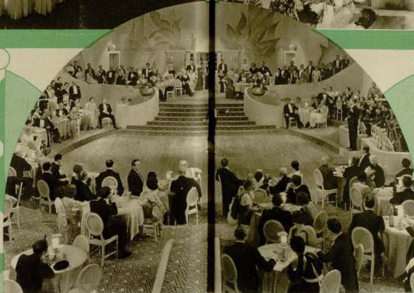
Tres escenas de conjunto de la espectacular película Warner Bros-First National