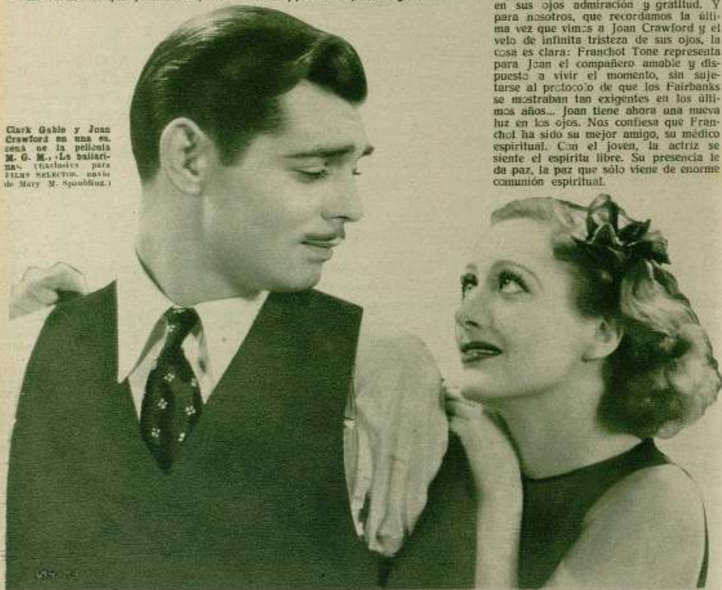
Clark Gable y Joan Crawford en una escena de la película M. G. M., «La bailarina».

Joan mira al joven con ternura. Hay en sus ojos admiración y gratitud. Y para nosotros, que recordamos la última vez que vimos a Joan Crawford y el velo de infinita tristeza de sus ojos, la cosa es clara: Franchot Tone representa para Joan el compañero amable y dispuesto a vivir el momento, sin sujetarse al protocolo de que los Fairbanks se mostraban tan exigentes en los últimos años... Joan tiene ahora una nueva luz en los ojos. Nos confiesa que Franchot ha sido su mejor amigo, su médico espiritual. Con el joven, la actriz se siente el espíritu libre. Su presencia le da paz, la paz que sólo viene de enorme comunión espiritual.