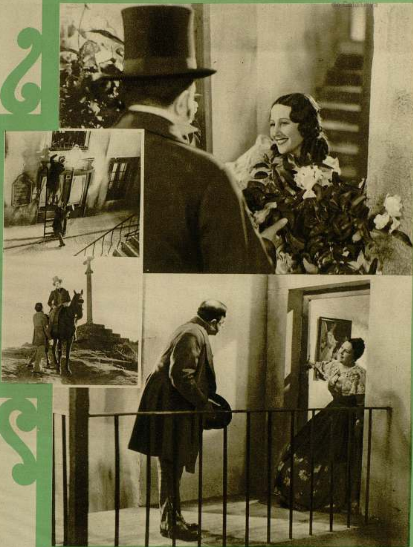
Escenas de la película española «Doña Francisquita»