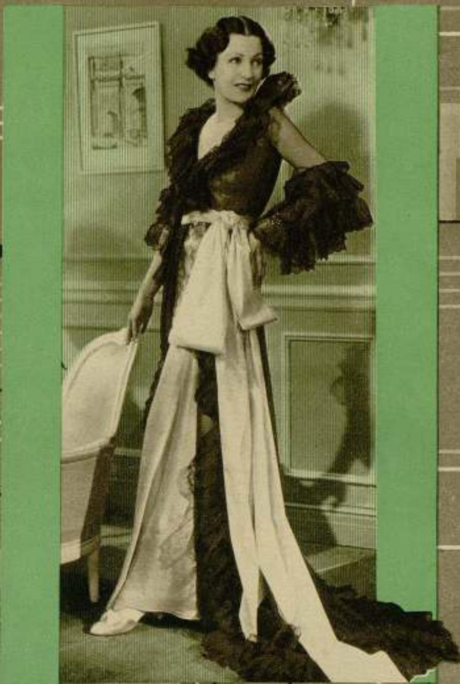
La celebrada estrella Juliette Compton luciendo un rico deshabillé que usa en la película de Artistas Asociados «La máscara del otro»