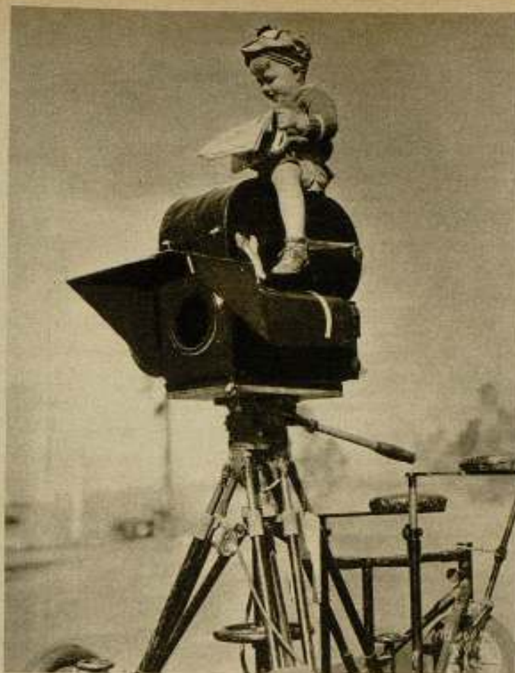
Spanky Mac Farland, héroe de las comedias de «La Pandilla» de Hal Rosson M.G.M., leyendo la página cómica de un periódico entre escena y escena de su próxima película.

Bert Wheeler y Robert Woolsey, empezarán a filmar «Cockeyed Cavaliers», siendo ésta la siguiente producción pa-