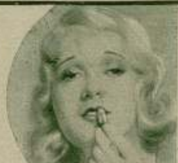
Anita Page, estrella de la Metro Goldwyn-Mayer, aplicándose el lápiz «MICHEL»

Los intérpretes principales Richard Barthelmess, Bette Davis y Dorothy Jordan afirman en «Esclavos de la tierra» su bien cimentada fama.