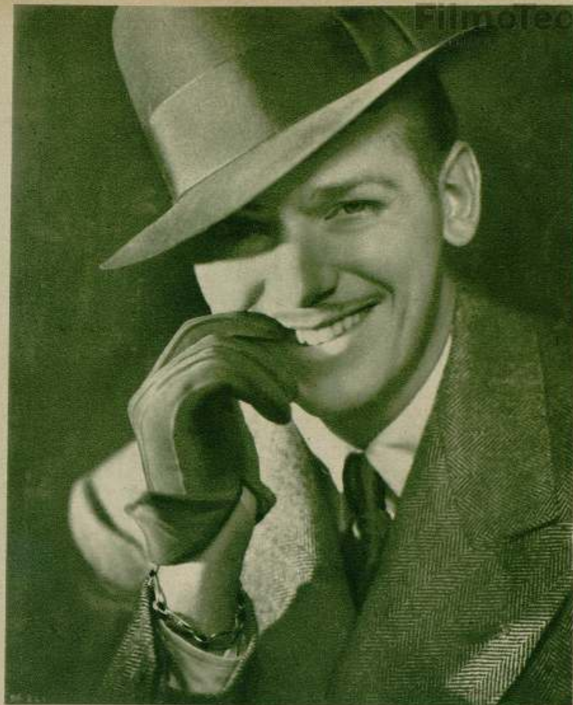
¿Qué piensa Douglas de la posibilidad de un enlace entre su ex esposa y su mejor amigo?...

Así, el amigo intermediario tiene la oportunidad de apreciar triamente los errores del esposo y las virtudes de la mujer. Y cuando la mujer que está por medio es Joan Crawford, bella, joven, talentosa, hay que convenir en que las simpatías han de ir a ella sin la menor vacilación. Empero, de esto a sentir una