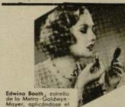
Edwina Booth, estrella de la Metro-Goldwyn- Mayer, aplicándose el lápiz "MICHEL"

Orphos Productos "P." de la República, 62, Barcelona Remite ptas. 0.50 en sellos de correo para que m. manden muestra de las cuatro cremas Orphos más principales.