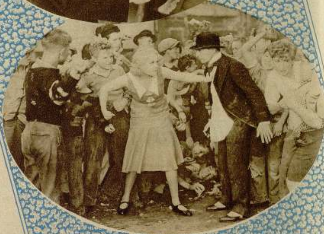
Tres escenas de la divertidísima pellicu- la «Calles de Nueva York», de la que es protagonista Buster Keaton con Anita Pa- ge y Cliff Edwards.