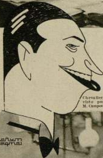
Chevalier, visto por M. Campos.