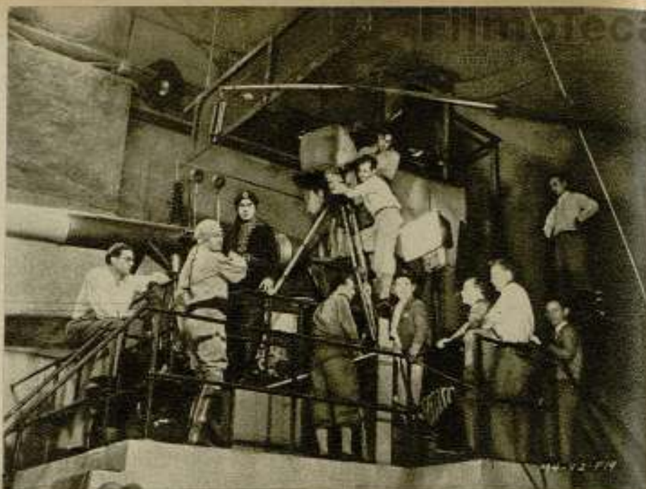
Edmund Lowe y Bela Lugosi retrados de los comienzos de la Fox durante el ensayo de una escena de la emocionante película «Chanchulito el mago».