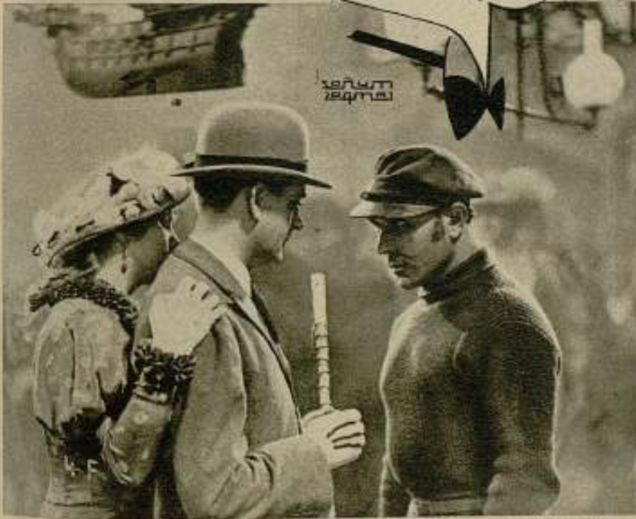
Escena del film «El signo de la Cruz» (La cruzada de la vida), una de las obras más celebradas de Pabst, presentada por Warner Bros. First National, en Studio Cines, el viernes de la semana anterior.

En ambas películas lo más notable son los «make-ups». Casi se ha creado «carne artificial», que ofrece a la cámara fotográfica la misma impresión que la natural. El problema de la vivisección será tratado de nuevo en esta reciente película.