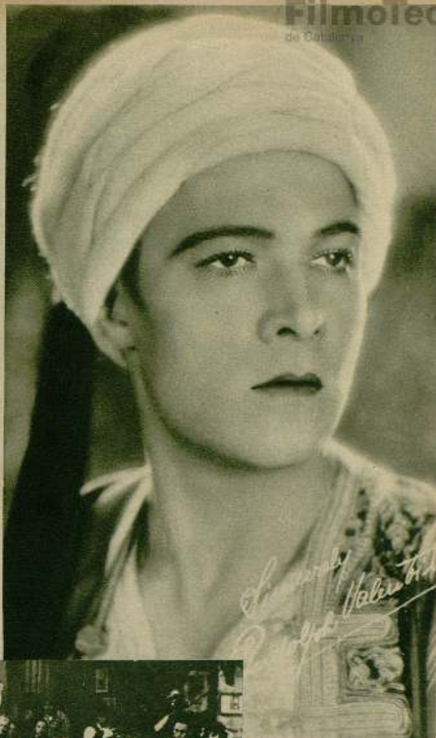
Rodolfo Valentino en «El hijo del Caído»

dicen de él. Y al cuerpo le entran por las narices y por los oídos los gases de la vanidad, se hincha como si fuera un globo y... estalla. Eso es todo. Decía que por ese cariño desbordante que se les toma a los difuntos — en especial si se marcharon definitivamente con alguna factura nuestra sin cobrar —, muchas espectadoras demasiado románticas, que antes dedicaban sus ilusiones a Ramón Novarro o a Douglas Fairbanks, sintieron que su corazón ya no latía por ellos como un reloj excesiva-