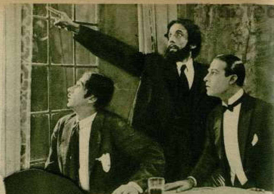
Una escena de «Los cuatro jinetes del Apocalipsis», película cuyo recuer- do va unido a Rodolfo Valentino.

Ciertamente, hacía ya demasiado tiempo que no aparecía por los estudios de Hollywood un hombre con el pelo planchado. Ya es sabido que en cuanto se descubre a un señor que se gasta en gominas más de lo corriente, los departamentos de propaganda se apresuran a lanzar a los cuatro vientos del mundo la noticia sensacional, aunque cada día menos sensacional. Ni más ni menos que ésta: «El nuevo Valentino.»