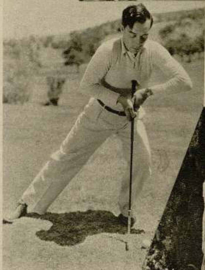
Muy defectuosa postura de golf, pero muy interesante, es la que adopta en esta fotografía, el imposible actor cómico de la Metro.