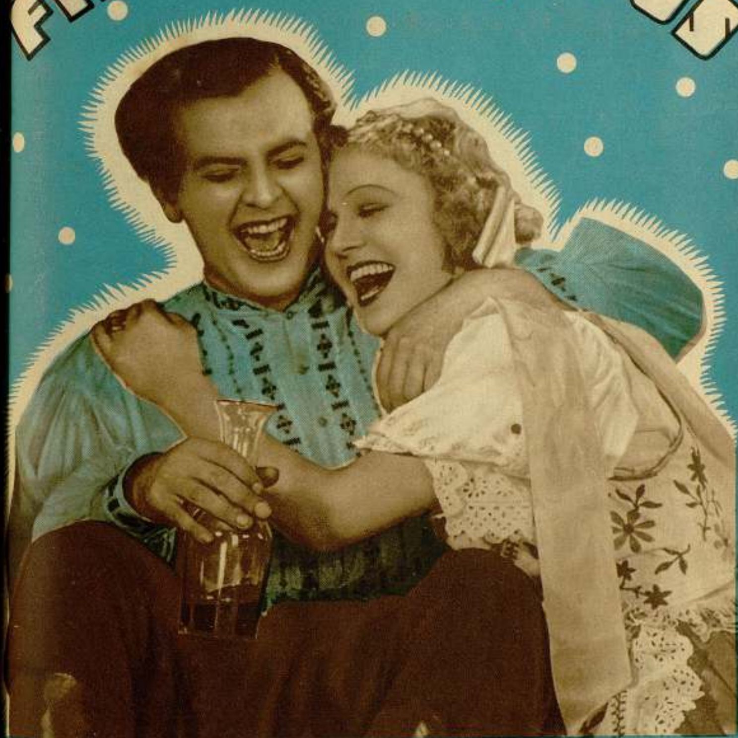
Una escena de la bella película «Victoria y su húsar» de la que son protagonistas Ivan Petrovich y Friedel Selmsier.