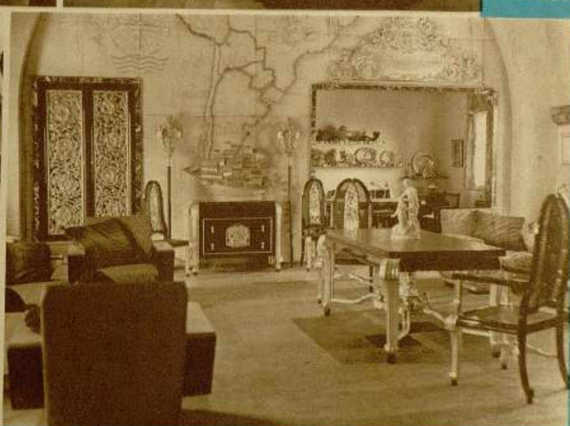
Varios aspectos del lujosísimo hogar de la ilustre actriz y estrella española Barcena que actualmente trabaja en los estudios Fox, de Hollywood.