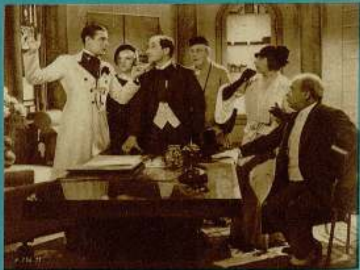
Varías escenas de la divertidísima película-opereta Paramount "Il est charmant"