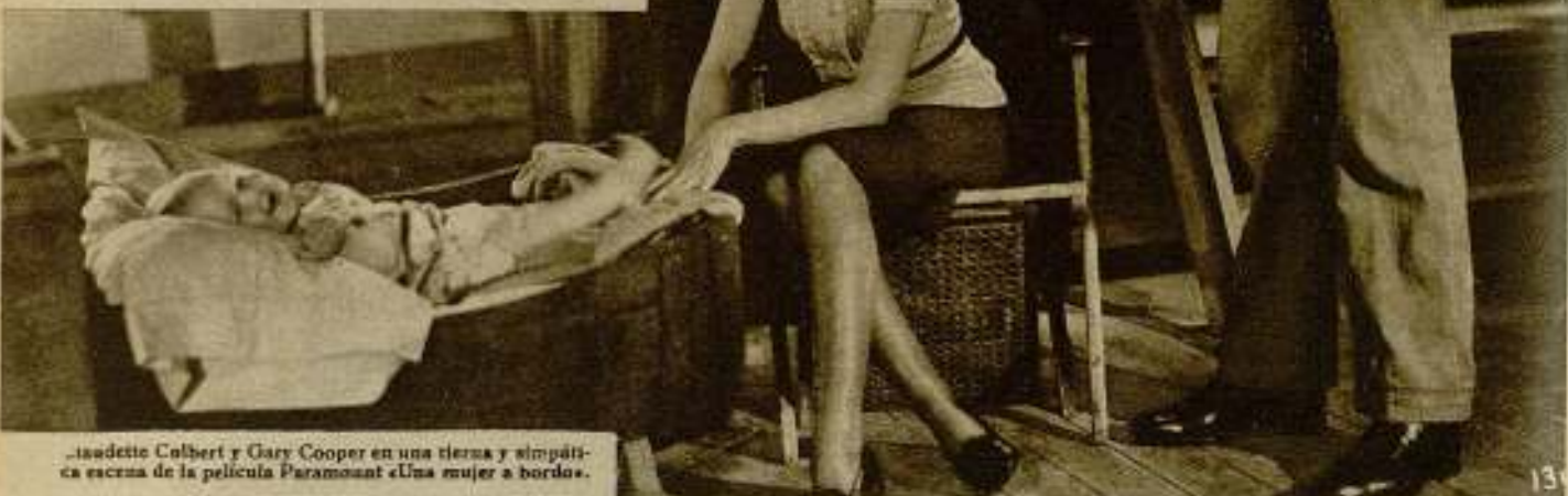
Isabelle Colbert y Gary Cooper en una tierna y simpática escena de la película Paramount «Una mujer a bordo».

Parece a primera vista que el aficionado que se limita a la práctica de la cinematografía, sin quererle buscar tres pies al gato, para nada necesita los conocimientos que nos van a ocupar. Sin embargo, hay muchos casos en los que tales conocimientos son indispensables. Precisamente, recuerdo el de un amigo mío que me devolvió un objetivo que le presté, diciéndome que no servía y que con él era imposible obtener imagen alguna sobre la pantalla: ignoraba que para que haya imagen es condición indispensable la de