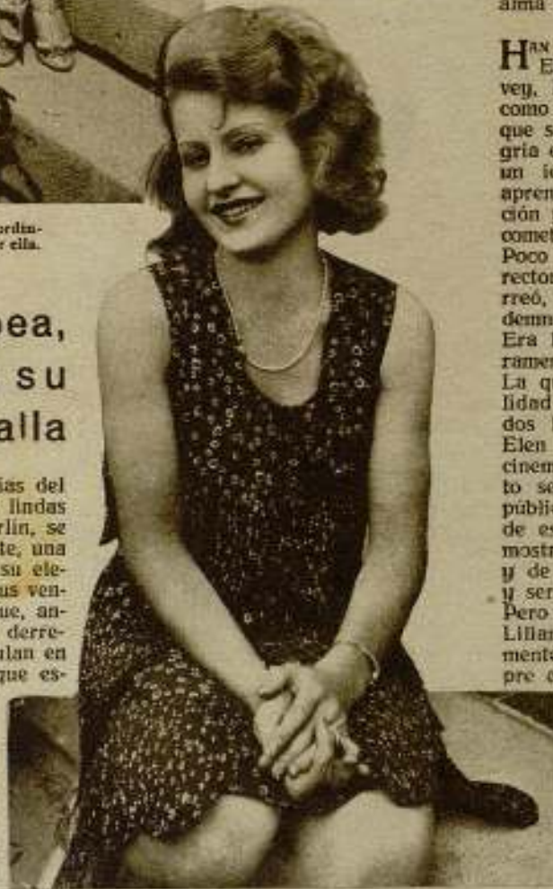
Aquí Lilian Harvey era una mujercita llena de pájaros en la cabeza, pero que gozaba de su triunfo sin pensar en Hollywood.

Es una mujer hecha y derecha. Es Lilian Harvey una jovencita inglesa que las circunstancias le trajeron al país alemán y que en él pasó los horrores de la guerra. De la gran guerra. Es una mujercita a la que acechan mil peligros. Los americanos pretenden seducirla, conquistarla. Ella es una mujer que se debe en cuerpo y alma al pueblo alemán que le dió la vida.