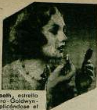
Edwina Booth, estrella de la Metro-Goldwyn-Mayer, aplicándose el lápiz "MICHEL".