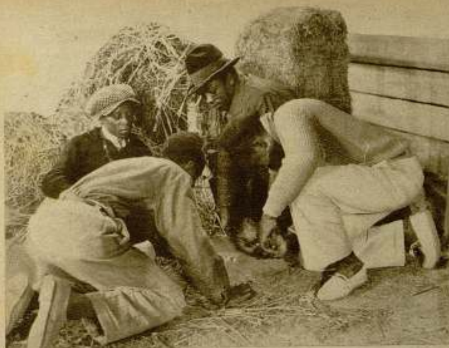
Todos los colores, todas las razas en una figuración de cine. El color dominante es el negro. Negros de Harlem, negros de Tombuctú, negros claros de la Habana, que marchan con un ritmo lento de danza...

amor «a lo» Jack London. Pero — para mí — Gravey está más cerca de Chevalier que de Chaplin: un Chevalier estilizado. ¿Qué galanes integralmente de cine hay, pues, en Francia? Si acaso, Jean Murat, en lo maduro, y Roland Toutain, en lo juvenil. Poca cosa, en fin de cuentas. Y buscar entre los figurantes no ofrece mayores posibilidades. Dominan, en una «figuration» de cine, los «gigolós» sin trabajo y los «boys» de las revistas de «Mistinguette» vendidos a menos. Esto, en cuanto a Francia. La zona extranjera — muy reducida desde que el crimen de Gorguloff excitó el «chauvinismo» galo — se halla bajo la dominación de Rusia. Chaves Nogaes — cuando, entre los rusos de París, buscaba datos para «Lo que ha quedado del imperio de los Zares» — debió haberse dado una vuelta por Joinville.