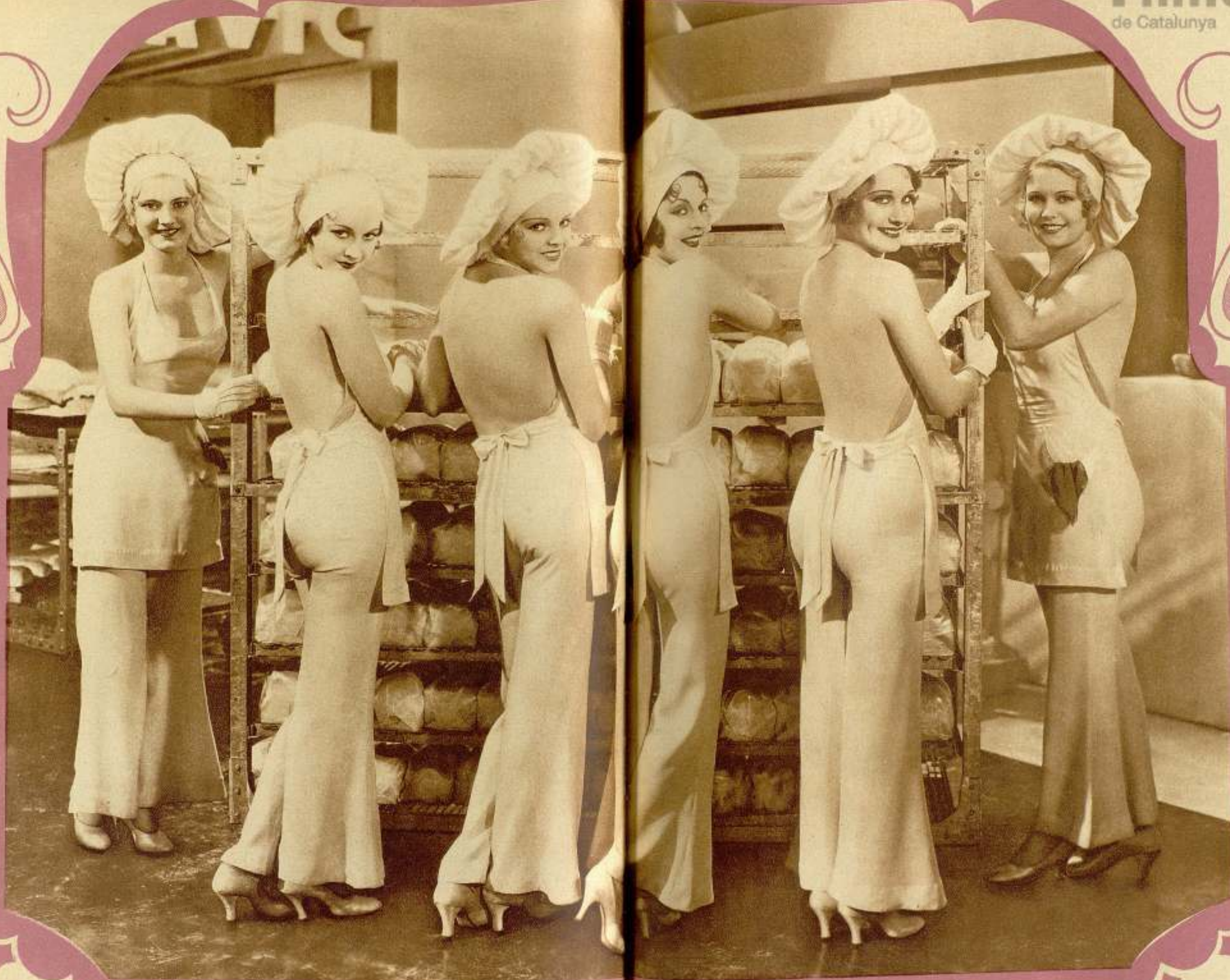
Alegre y juvenil grupo de muchachas que podremos admirar en la película «Palmy Days», en la próxima temporada