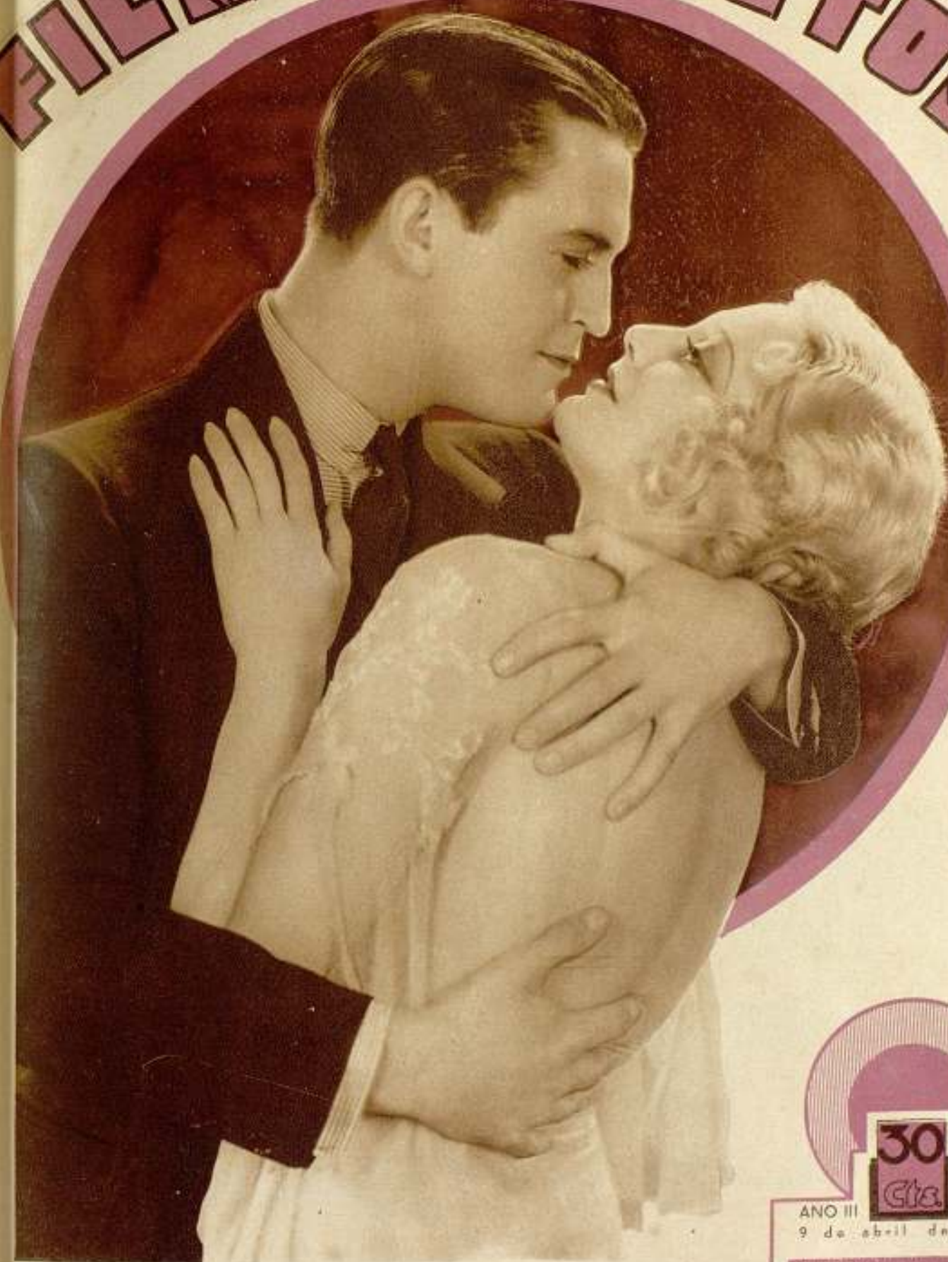
Alison Lloyd y Chester Morris en la película «Corsair» producción de Roland West