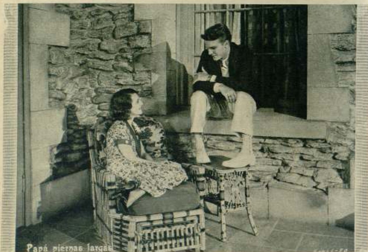
Papà piernas largas