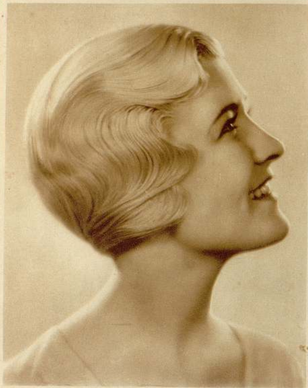
LAURA LA PLANTE