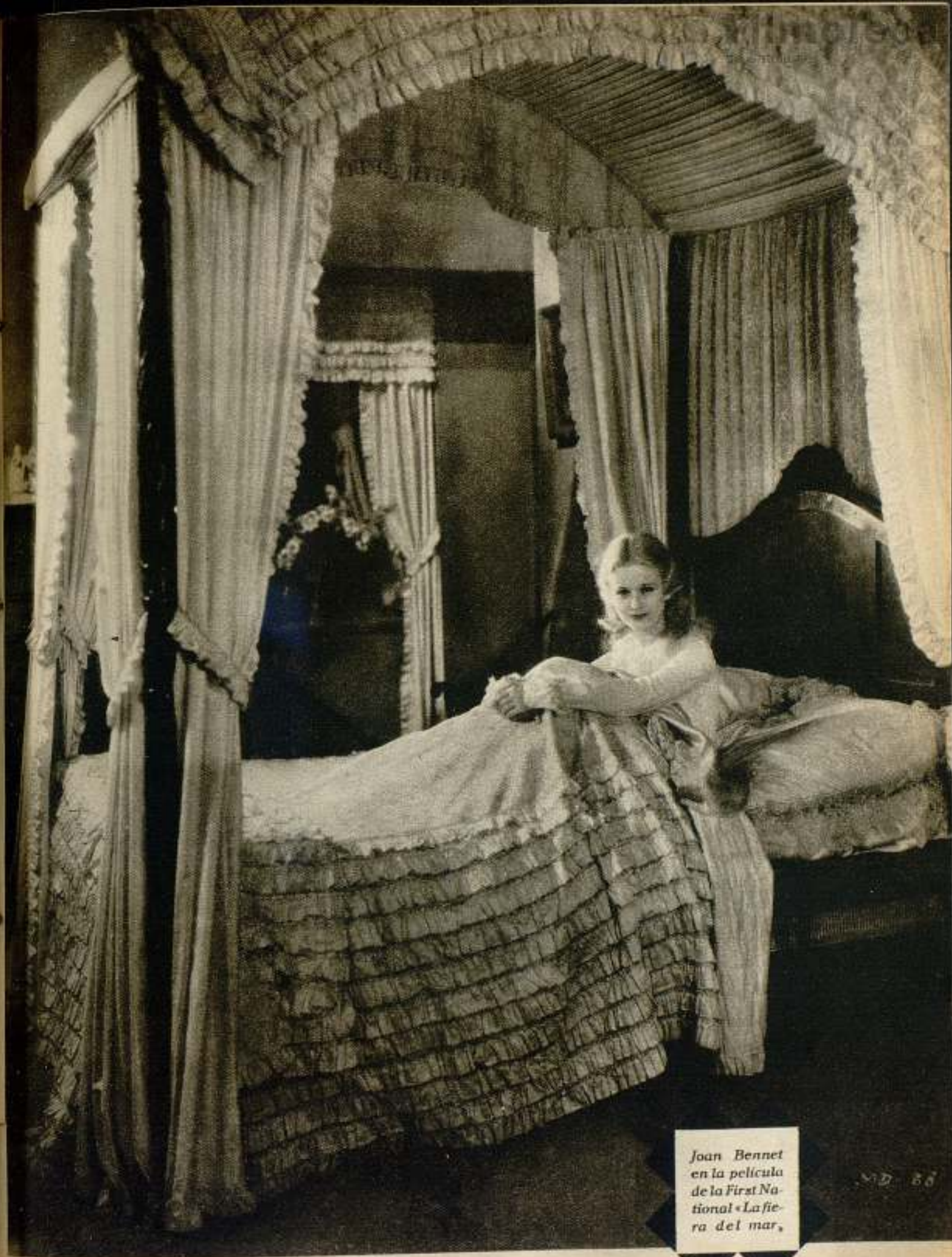
Joan Bennet en la película de la First Na- tional «La fie- ra del mar».