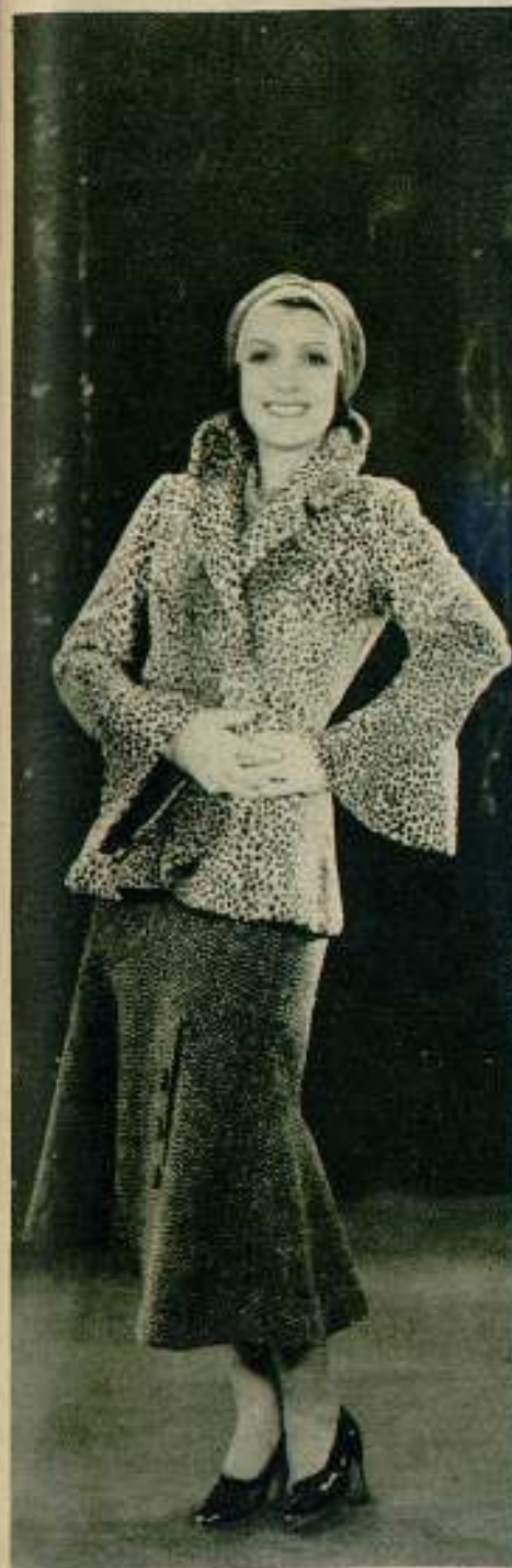
Conchita Montenegro, encantadora estrella de la Metro-Goldwyn-Mayer, aparece más linda que nunca en su elegante abrigo corto de piel de leopardo, que luce en la película hablada en español "Su última noche".