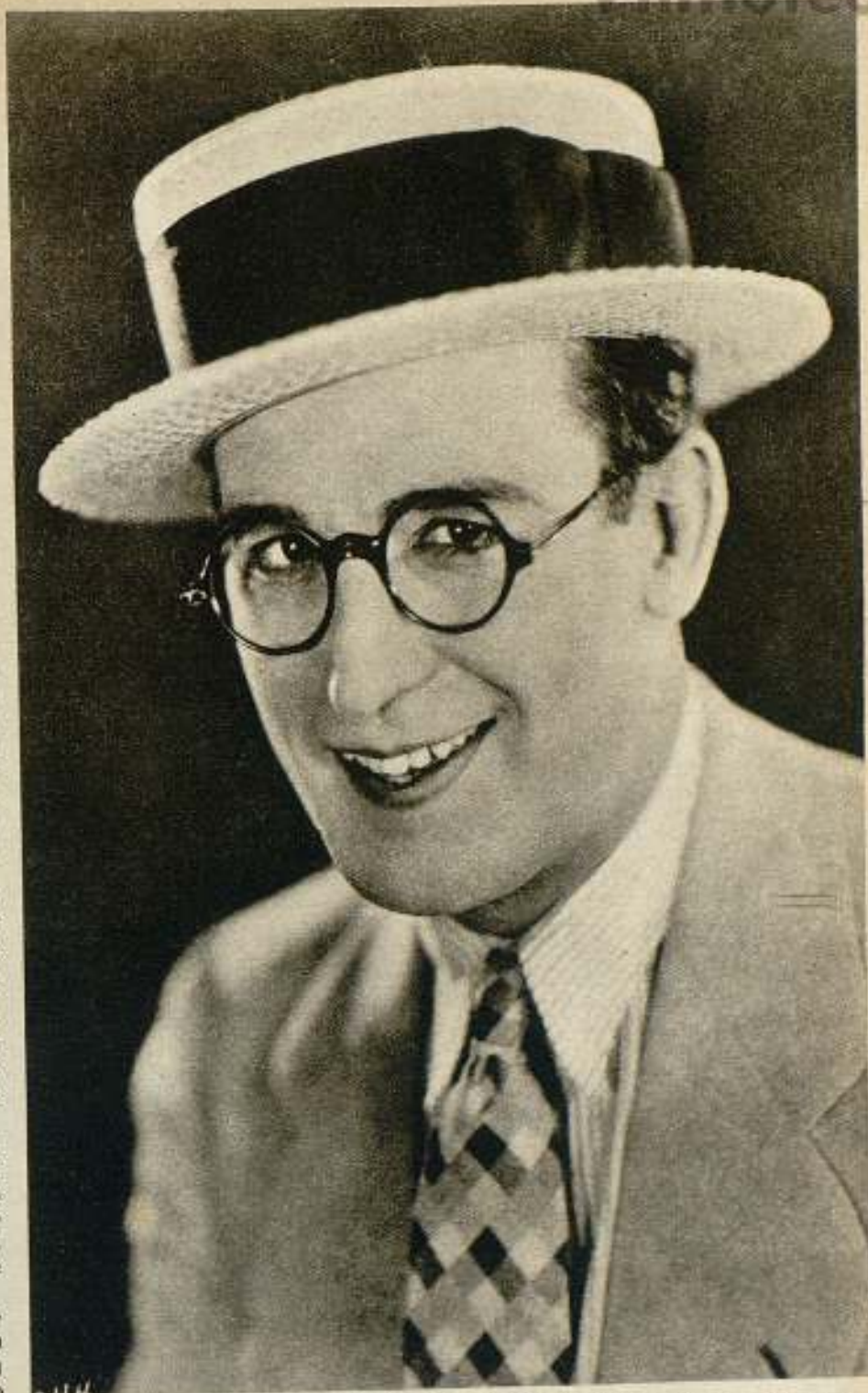
Harold Lloyd, el divertido actor de las gafas sin cristal, contra quien intentaban realizar un atentado

A la día siguiente, pude comprobar que todo cuanto había oído desde el pequeño pórtico cubierto de enredaderas era cierto.