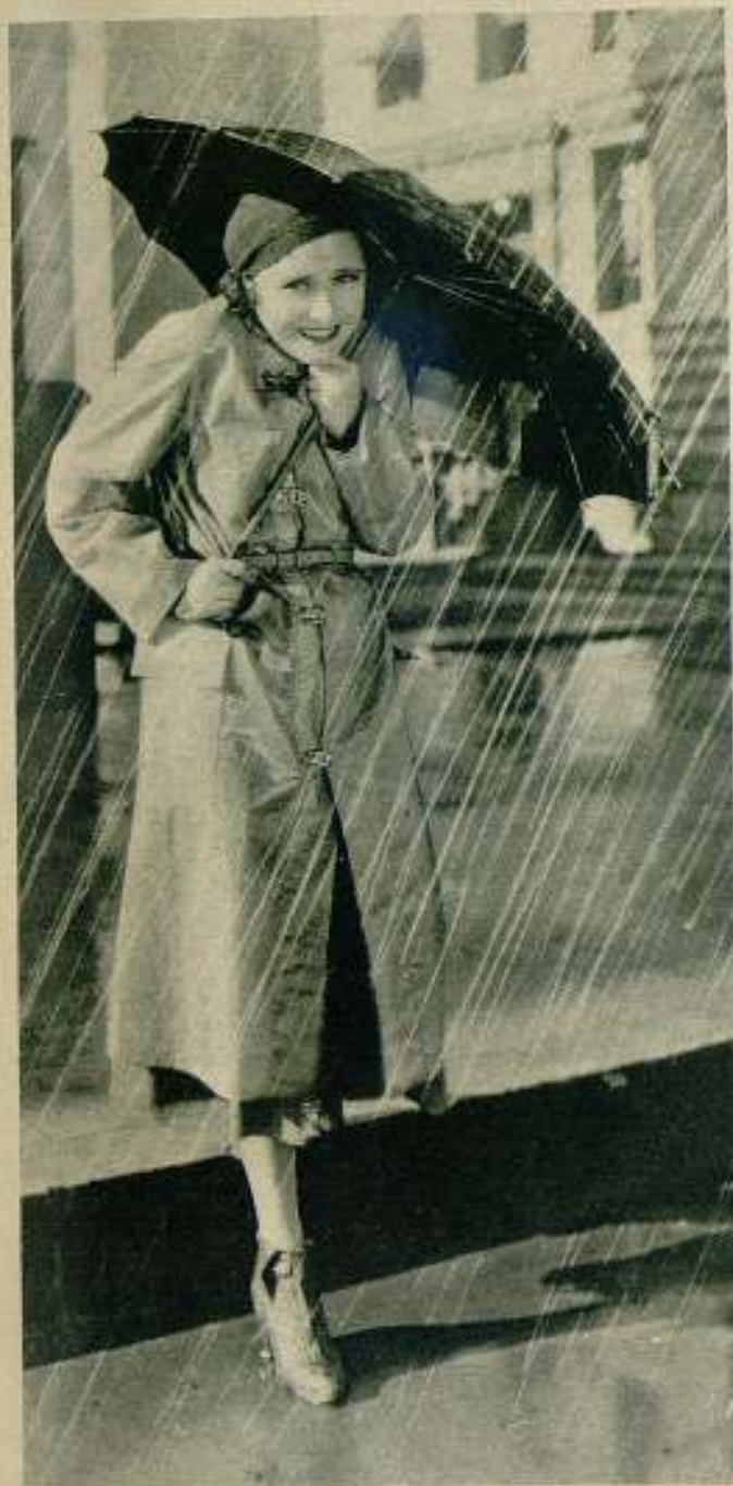
Kathlyn Crawford, actriz de la M.G.M., sonríe bajo la lluvia de abril.

L A APROBACIÓN FEMENINA.— La mujer, que en los Estados Unidos tiene poderosa influencia que hace sentir por medio de los numerosos clubs femeninos, acaba de dar su «visto bueno» a varias de las producciones «Columbia». La Federación General de Clubs Femeninos, la Federación Internacional