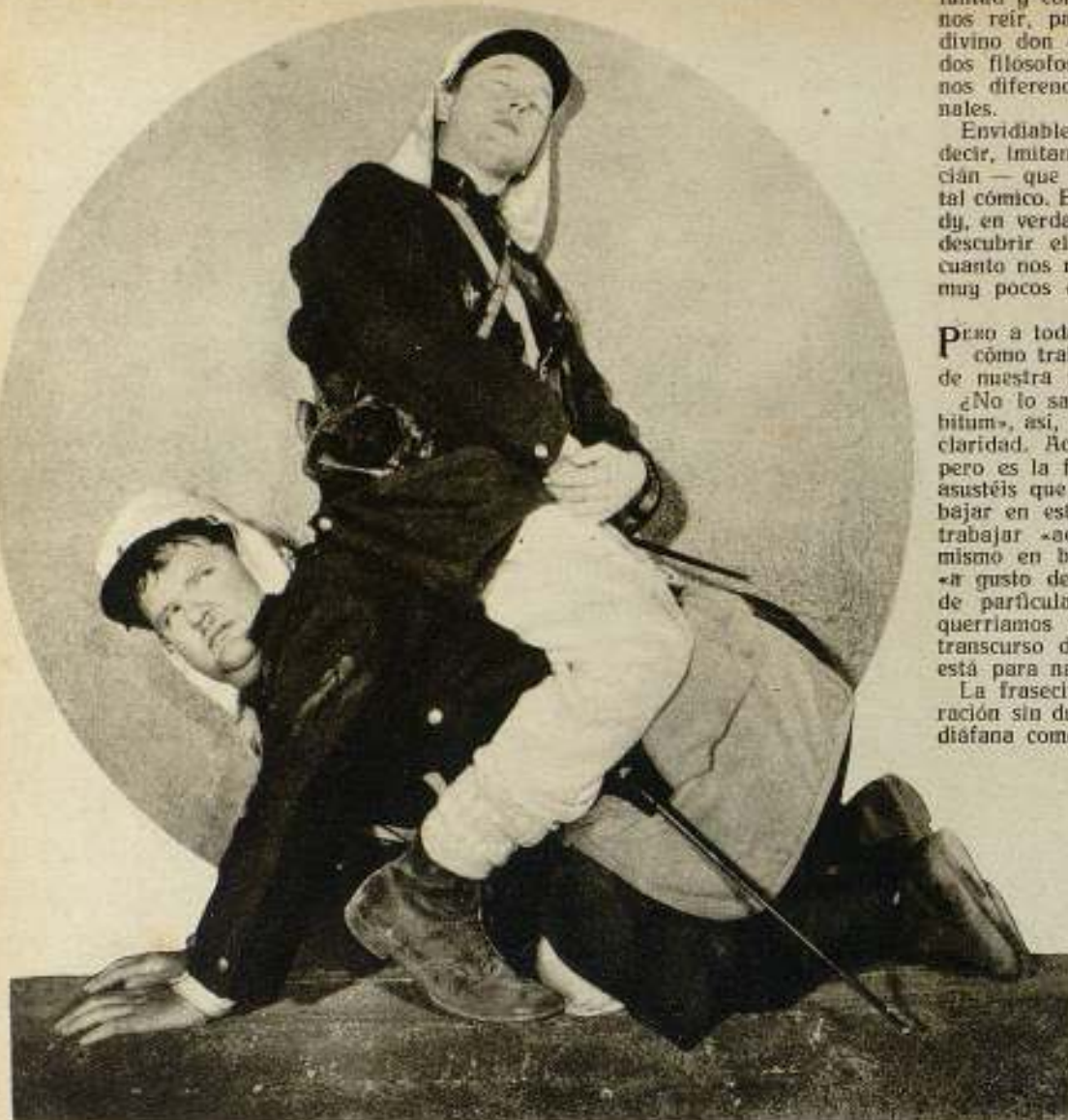
Stan Laurel y Oliver Hardy, con la indumentaria que lucen en su nueva comedia marca Hal Roach.