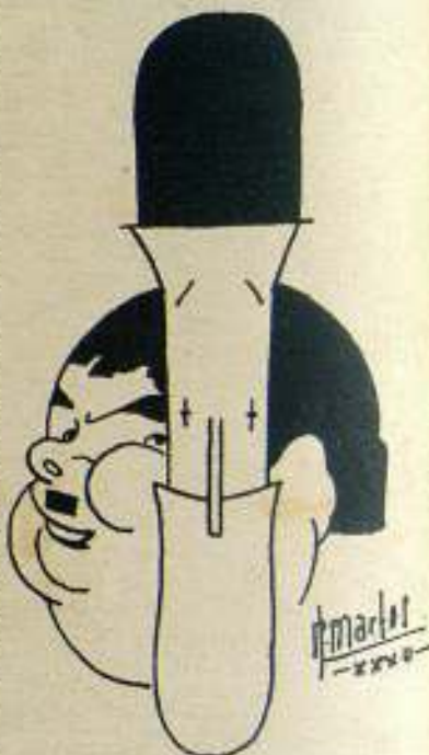
Stan Laurel y Oliver Hardy

Los primeros metros que ayer fueron proyectados por