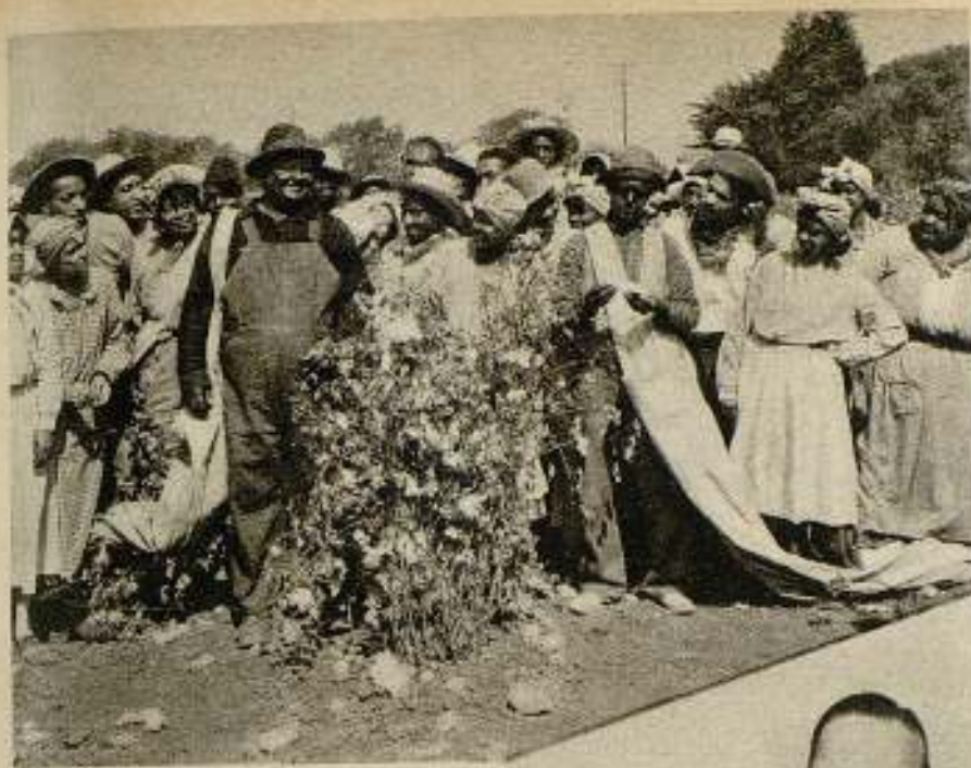
Stan Laurel y Oliver Hardy, en «De bote en bote», comedia de Hal Roach - M. - G. - M.