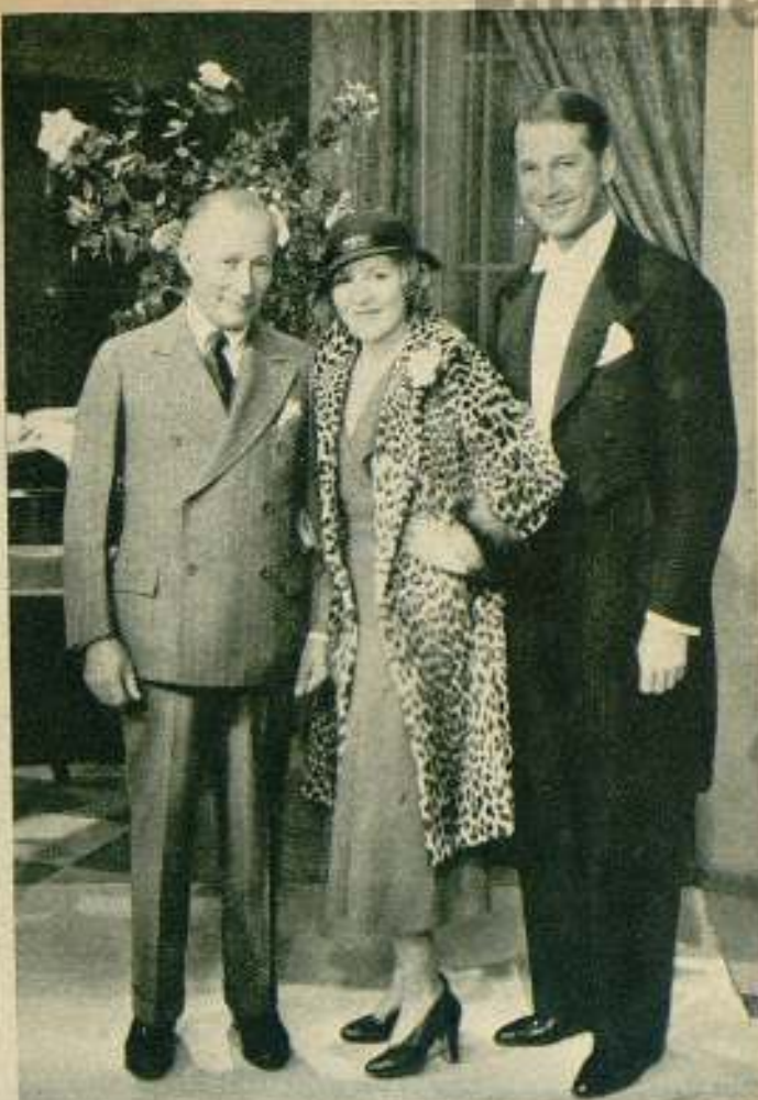
Recientemente la celebrada estrella Mary Pickford, sin duda para recordar sus primeras actuaciones para la pantalla, fué a visitar a Adolfo Zukor, presidente de Paramount Pictures, bajo cuyos órdenes empezó a trabajar. Véanla en esta fotografía acompañada de dicho señor y de Mauricio Chevalier, durante su visita.

de Damas Católicas, el Congreso Nacional de Padres y Maestros de la División de Los Angeles, el Club Universitario Femenino de Los Angeles, la Sociedad Nacional de las Hijas de la Revolución (Norte) Americana y la Sociedad de Jóvenes Cristianas con sus informes mensuales concordaron en extender su aprobación unánime a las siguientes películas de «Columbia»: