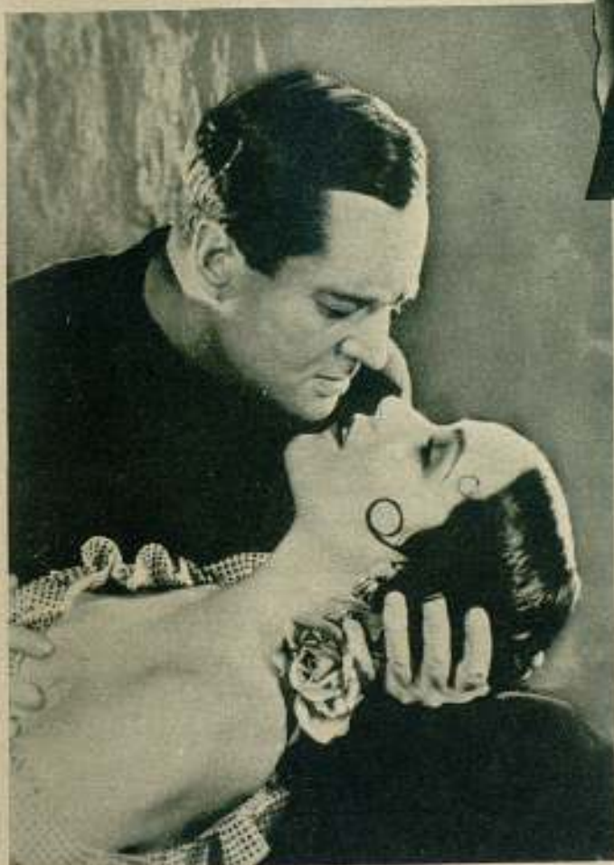
Véase en esta fotografía una escena de amor entre Edmundo Lowe y Dolores del Río en uno de sus más célebres films.

Siempre aparece guapa y también siempre nos atrae lo que a la postre significa mucho esta «vedette» de la pantalla que tan imitado ha sido físicamente por otras actrices de habla hispana desde el advenimiento del cine hablado.