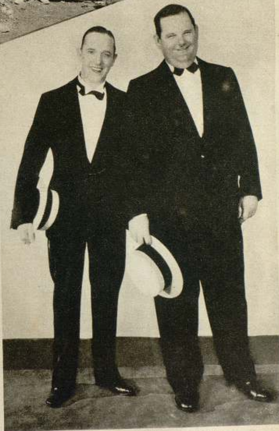
Laurel y Hardy, elegantemente ataviados para un momento cómico.