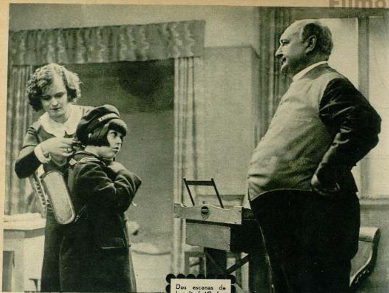
Dos escenas de la película "Burbu- jas de Champán"