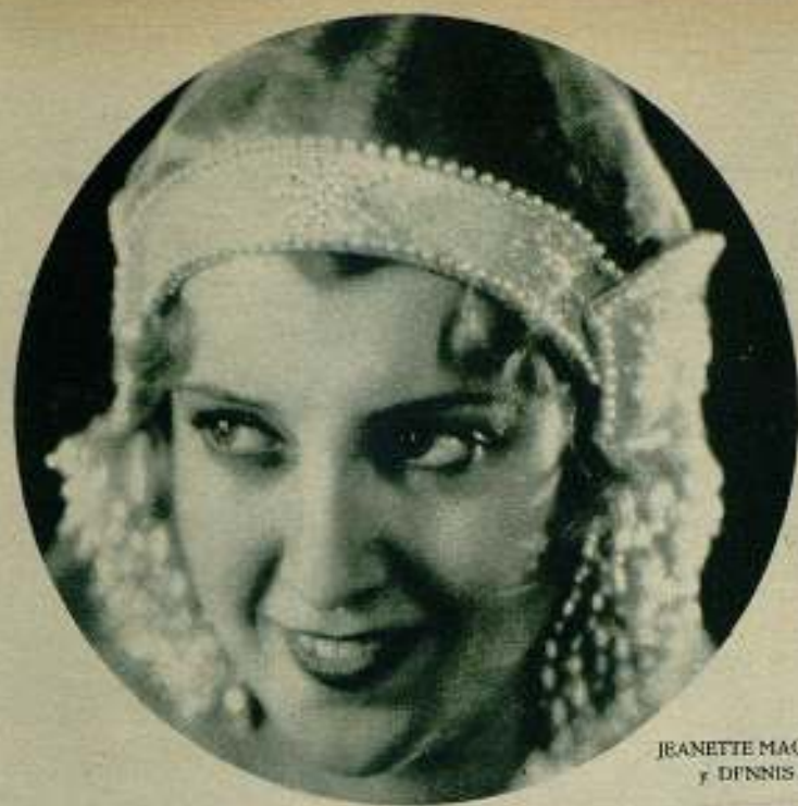
JEANNETTE MAC DONALD y DENNIS KING