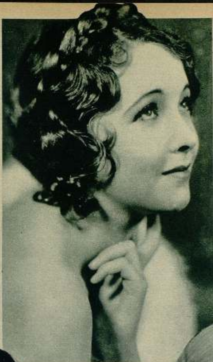
Helen Twelvetress tan angelical y sutil, inspiró el más amargo de los odios en Hollywood...

La flamante marquesa de la Falaise de la Coudrége, tuvo el primer gran miedo de su vida cuando Constance dejó caer sus ojos adormecidos