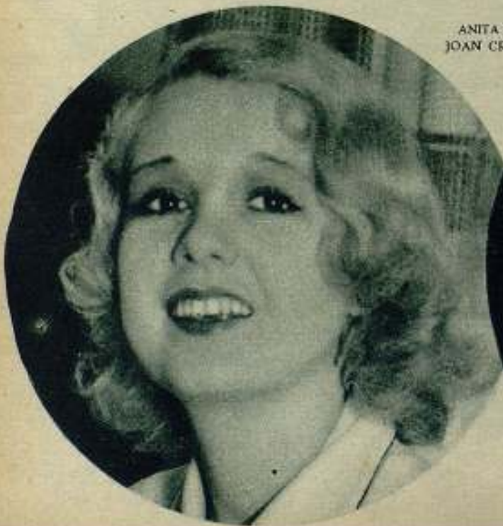
ANITA PAGE y JOAN CRAWFORD

Se terminó el film y Clara y Gary dieron gracias a Dios al verse libres del terrible martirio que para los dos significaba el tener que poner una caricia donde de buena gana habrían puesto un puñetazo; pero no hace mucho la «Paramount» resolvió que filmaran juntos «Calles de la ciudad». Los dos protestaron violentamente y dijeron que irían