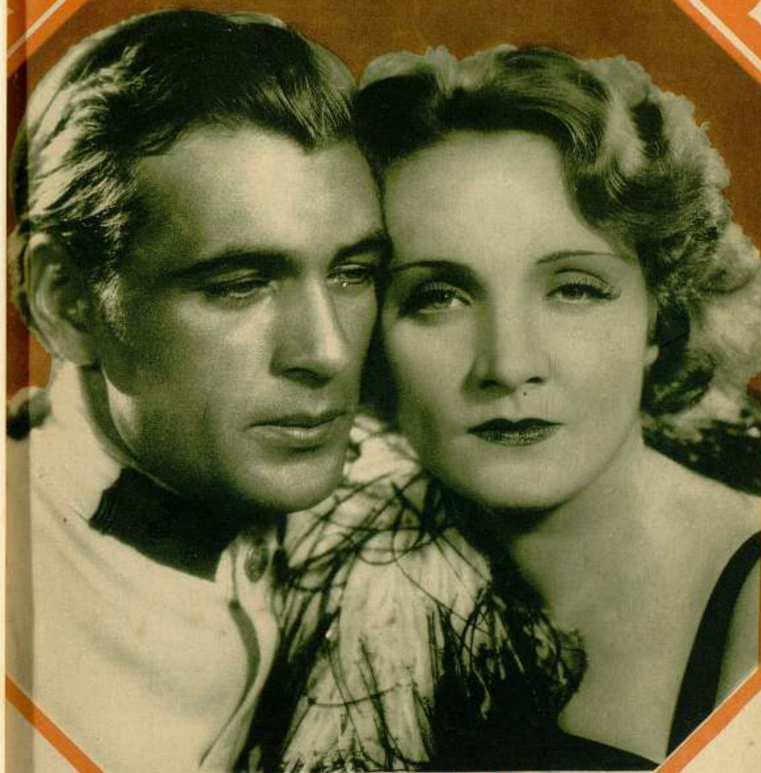
Marlene Dietrich y Gary Cooper, héroes del gran film Paramount "Marruecos"