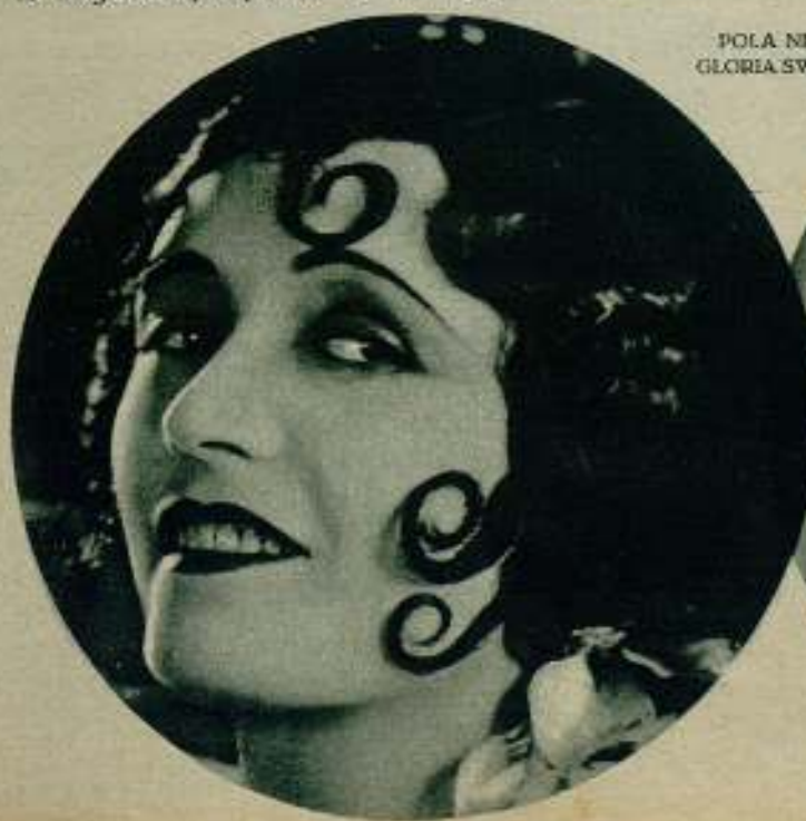
POLA NEGRI y GLORIA SWANSON