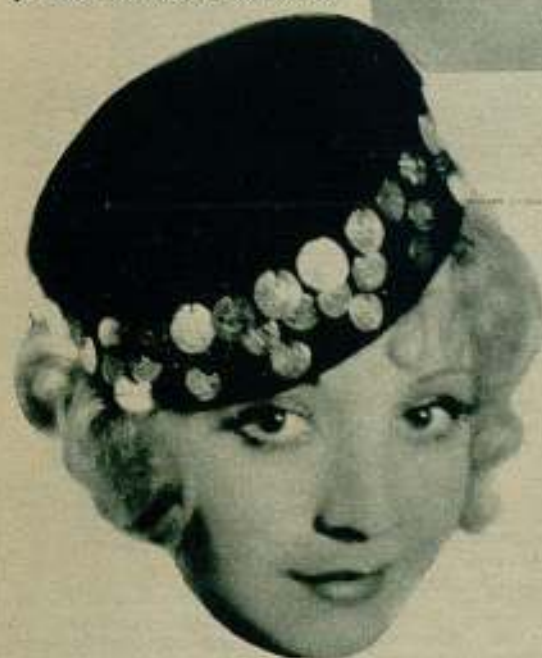
Alice White fué el tormento de las mujeres de Hollywood, estrellas y sencillas ama de casa.

y llenos de sabe Dios qué promesas, sobre la figura elegante de su Henri la Bailly. Aunque su orgullo de mujer y de actriz no podía dejarle saber al mundo, ávido por penetrar en los jardines secretos de su vida, que ella había sido desbancada en el afecto del marqués por la belleza exótica de Constance, Gloria se divorció del noble francés gracias a la crueldad de aquellos celos