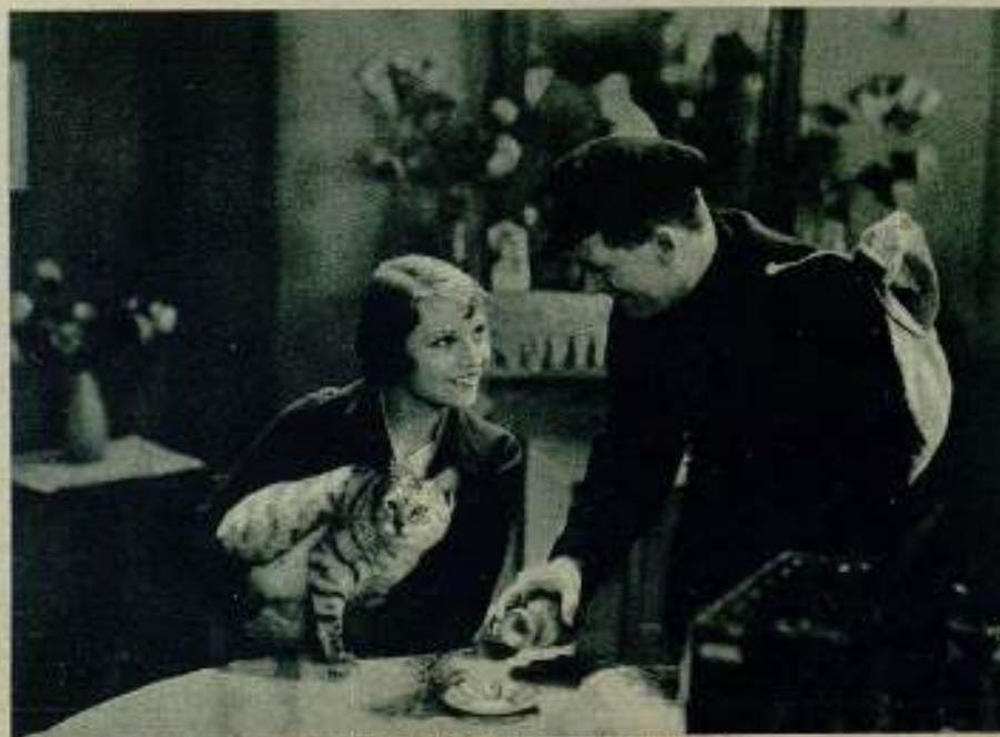
Annabella y Albert Préjean en «Un soir de Rafle».