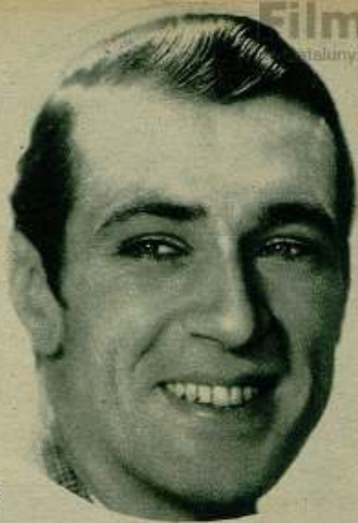
CLARA BOW y GARY COOPER

Cuando vemos en la pantalla cómo dos amigas entrañables se abrazan, se acarician y se sonríen; cómo dos camaradas fraternales se estrechan la mano y se dan en la espalda golpes afectuosos; cómo dos enamorados se estrujan con vehemencia y se dan besos kilométricos y voraces, no podemos menos de creer que tras esos impulsos existe realmente el afecto entre los dos protagonistas de la escena.