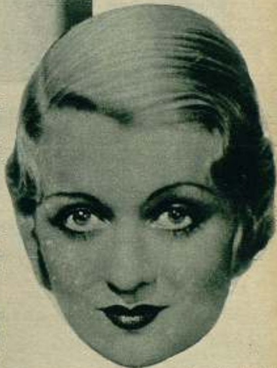
El ejemplo más curioso de odio que registra la historia del cinema, es el que sienten las mujeres de Hollywood, en su inmensa mayoría, por Constance Bennett.