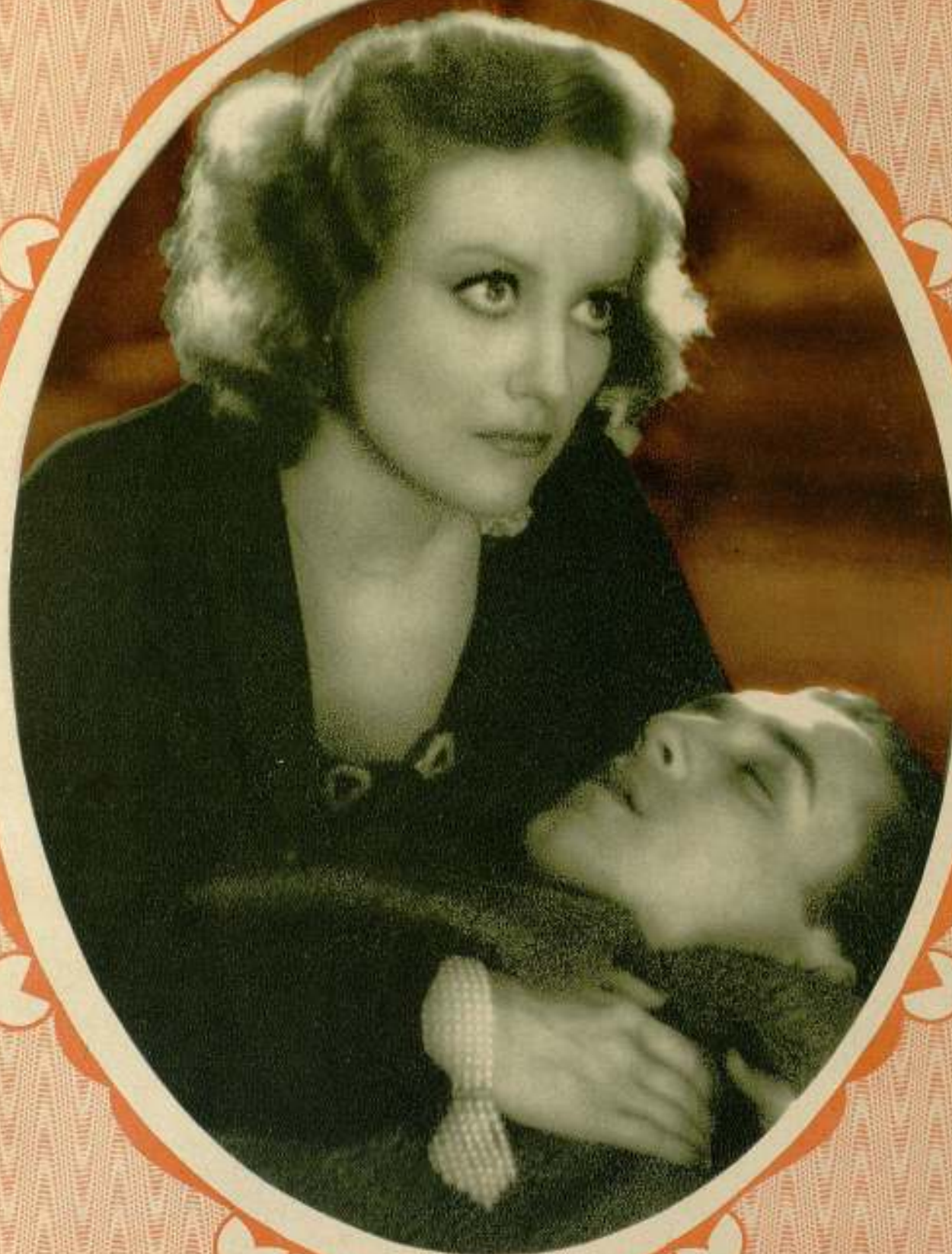
Joan Crawford y William Bakewell, en una emocionante escena de la película Metro-Goldwyn-Mayer, "Danzad, locos, danzad"