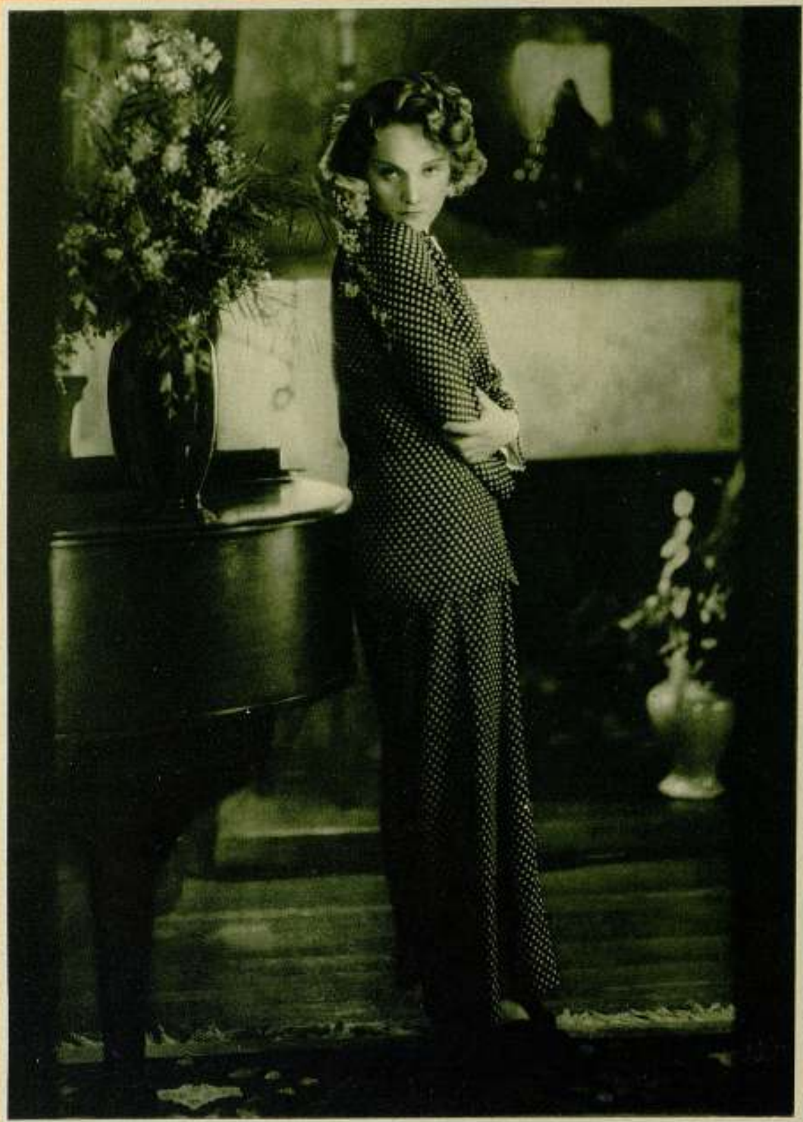
Fotografía hecha recientemente en el hogar de Hollywood de la gran estrella Marlene Dietrich protagonista genial de la película "Maruscos".