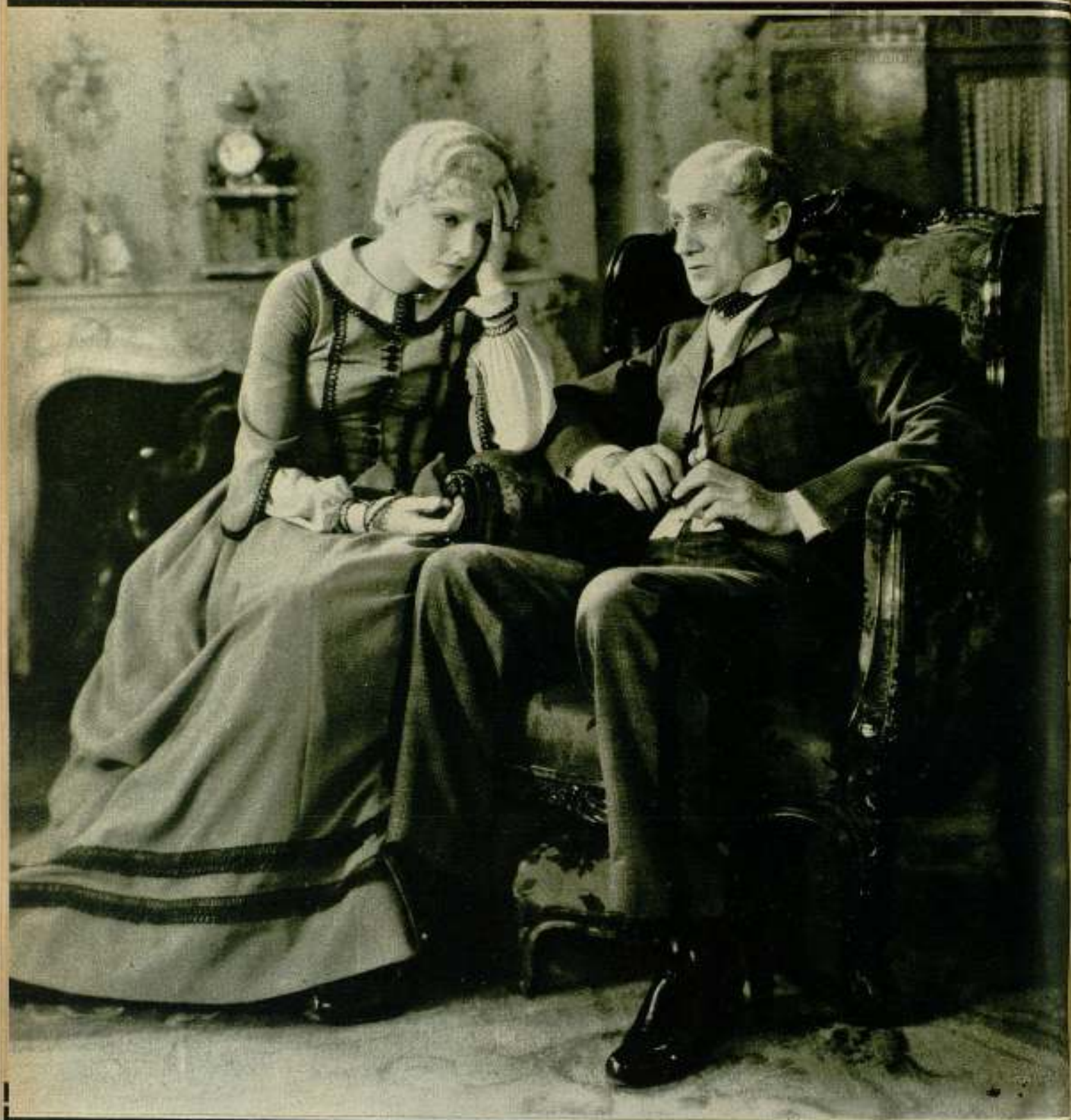
Una escena entre Ann Harding y O. P. Heggie, en la película Fox "Vidas Truncadas"