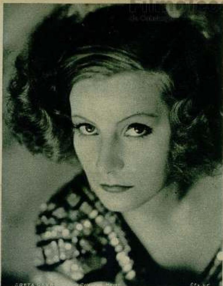
Greta Garbo tiene un magnetismo personal extraordinario

—Pero Greta, aunque ustedes no lo reconozcan — in-