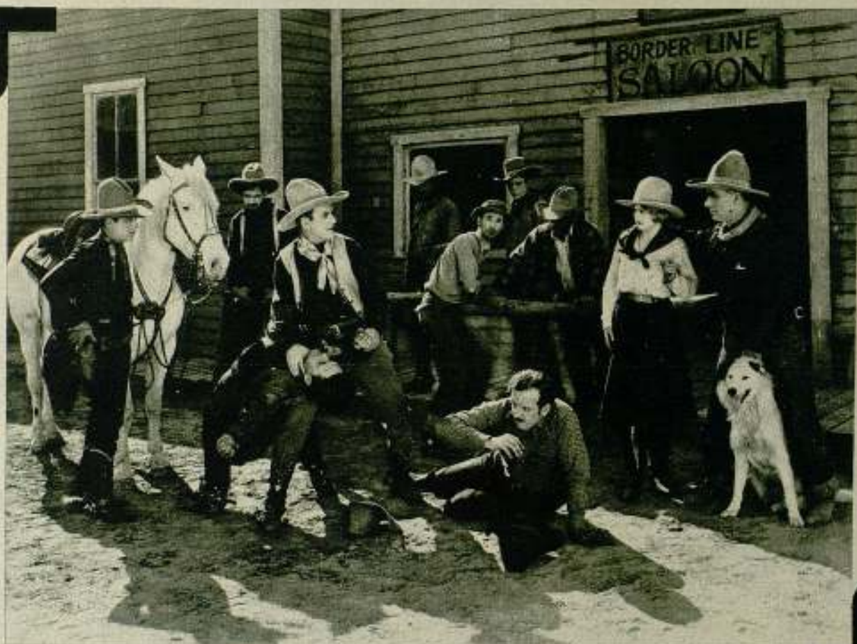
Típica escena de una película del Oeste es ésta de «La venganza de Centella».

Si, ya sé... Durante unos doce años han venido cortándose las llamadas películas del Oeste por un mismo idéntico patrón. Con más o menos tiros, con más o menos puñetazos — pero con tiros y puñetazos siempre —, con indios o sin ellos, con vacas o con caballos, los elementos descritos más arriba, y jugados invariablemente en torno a jinete, damisela y villano, han servido para componer, no una, ni dos, ni veinte películas del género, sino quinientas, mil, tres mil, cien mil... Si, ya sé. Era mucha va-