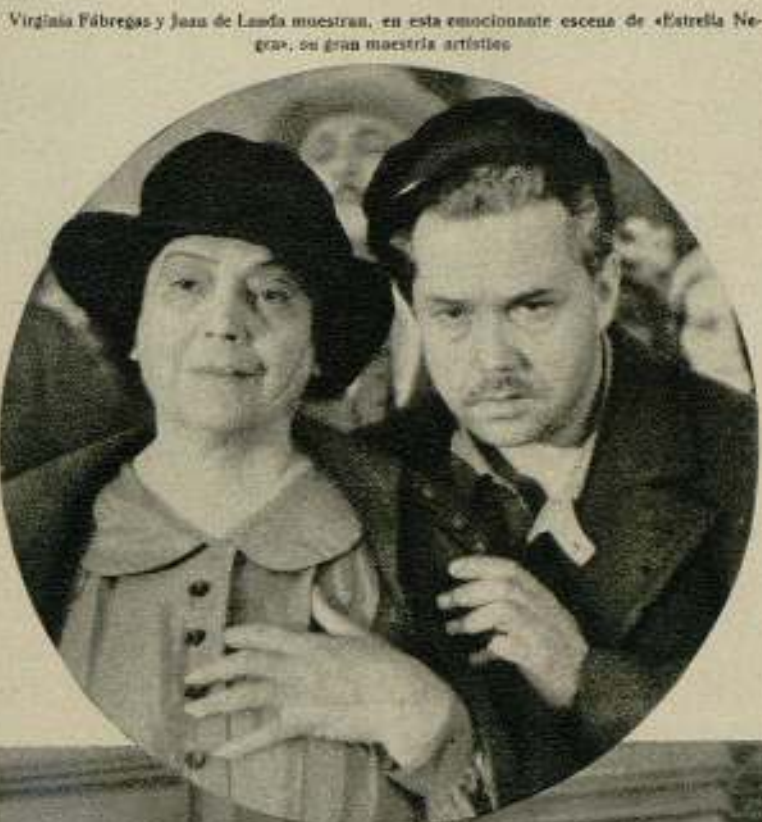
Virginia Fábregas y Juan de Landa muestran, en esta emocionante escena de «Estrella Negra», su gran maestría artísticas