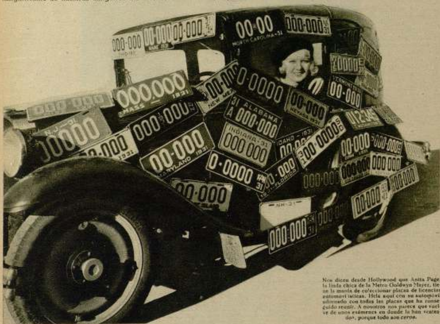
Nos dicen desde Hollywood que Anita Page, la linda chica de la Metro Goldwyn Mayer, tiene la manía de coleccionar placas de licencias automovilísticas. ¡Béla aquí con su automóvil adornado con todas las placas que ha conseguido reunir. A nosotros nos parece que suelve de unos exámenes en donde la han tentado, porque todo son cerros.