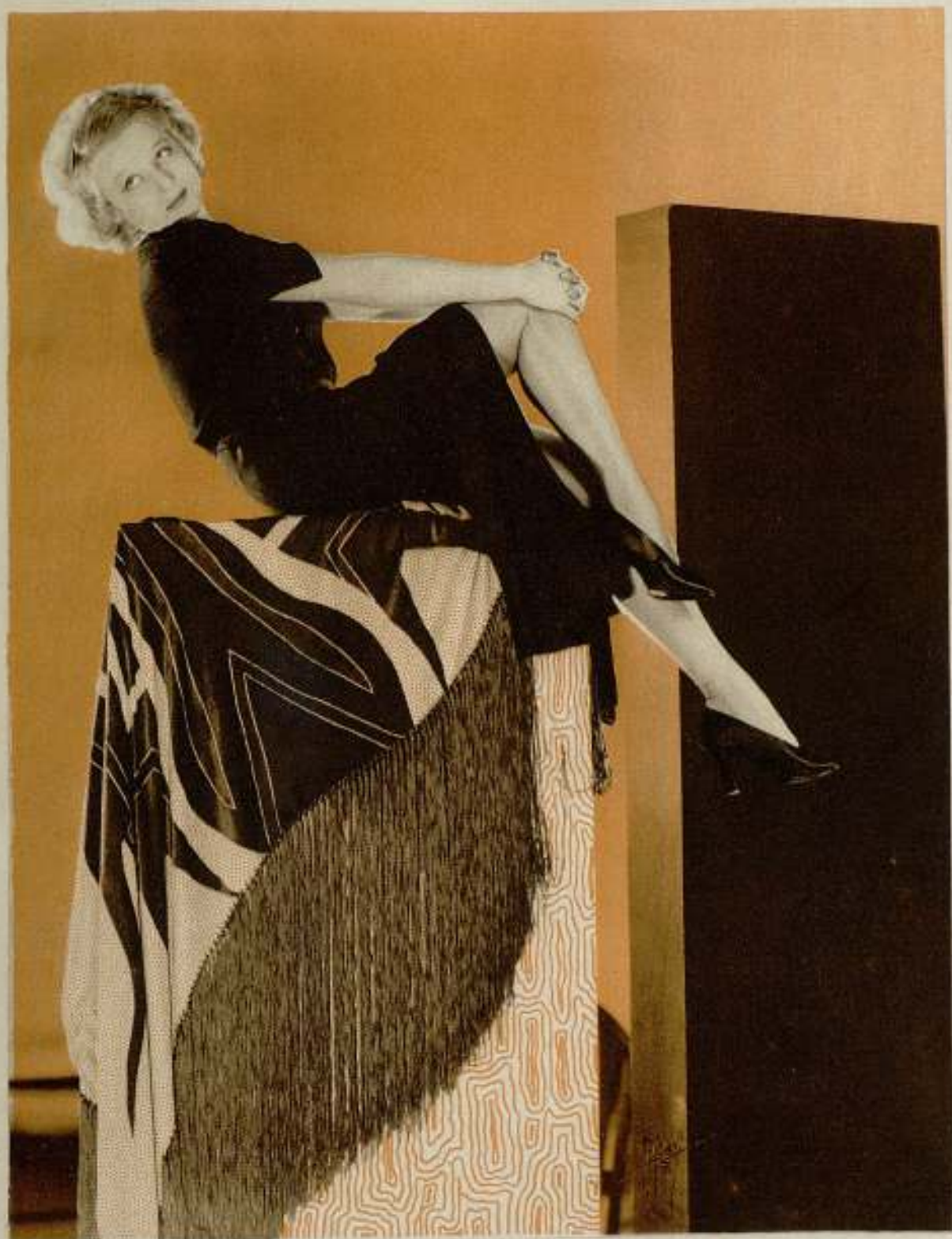
Greta Nissen, artista de la Fox