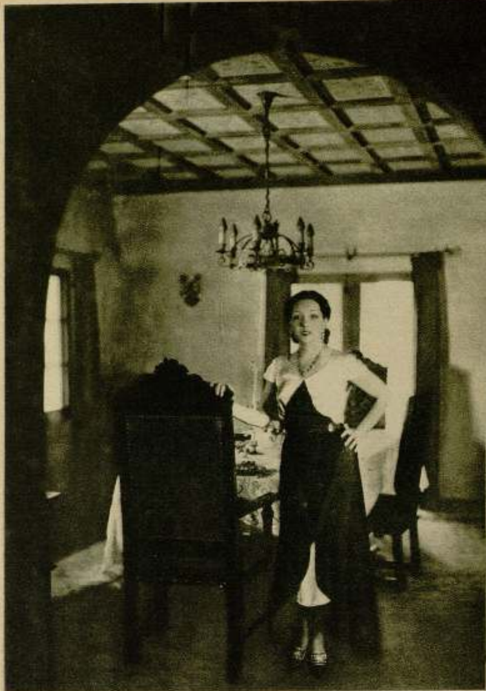
Con la frescura de sus diez y ocho años y su belleza rubia y delicada, June Mac Cloy, nueva estars de Paramount, se apresta a la conquista del público, que casi ha olvidado ya a las estrellas de antaño.

Esta muchacha, Wynne Gibson, tan joven como bonita, es una de las muchas que aspiran a ocupar los puestos que dejaron vacantes las antiguas figuras del cine mudo.