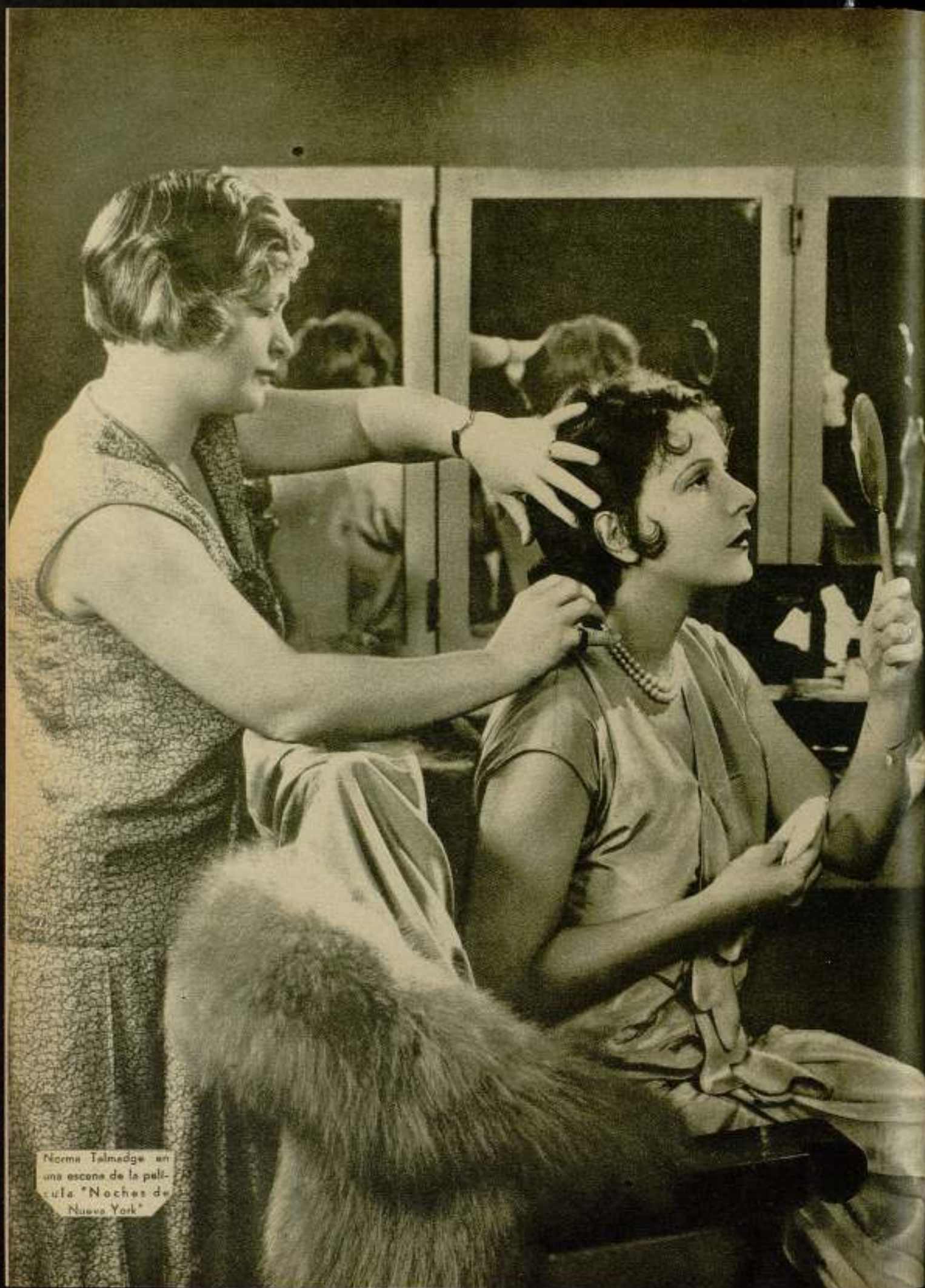
Norma Talmadge en una escena de la película "Noches de Nueva York"