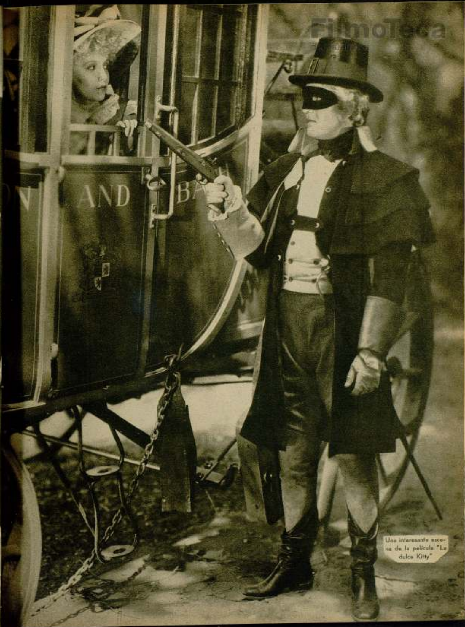
Una interesante escena de la película "La dulce Kitty"