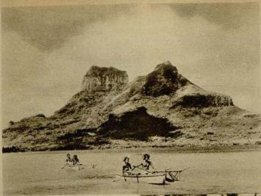
Las tranquilas aguas del Pacífico y la vegetación exuberante de sus islas son adecuado marco en que se desarrolla la trama emocionante de la película.

Basada en una novela de su compatriota Sudermann, hubo de acomodar su final de hondo y acusado dramatismo a las imposiciones de un criterio más comercial que artístico; pero ni esta claudicación ni el triunfo sin precedente de su película cumbre lograron vencer el poder arrollador que el nuevo descubrimiento del «cine» parlante traía consigo.