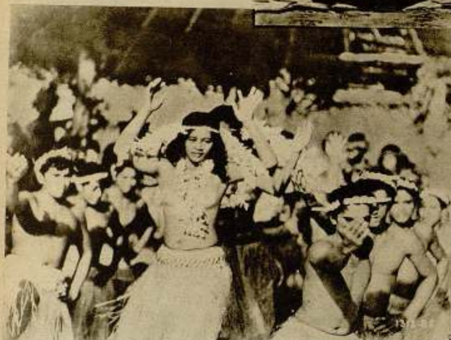
Danzas típicas en las islas del Sur.

V es entonces, al ser descubierta por él una técnica nueva que da al cinematógrafo aun más universalidad, ya que, suprimiendo narraciones y diálogos escritos — no pulcramente en la mayoría de los casos — permite a cada espectador interpretar todas las situaciones de la película, sean cuales fueren su temperamento o su raza, cuando un descubrimiento en el cual desde hacía muchos años venían comprometiéndose talentos y millones, da al traste con esa concepción maravillosa que del arte cinematográfico tenía Murnau.