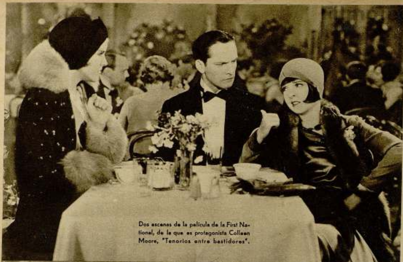
Dos escenas de la película de la First National, de la que es protagonista Colleen Moore, "Tenorios entre bastidores".