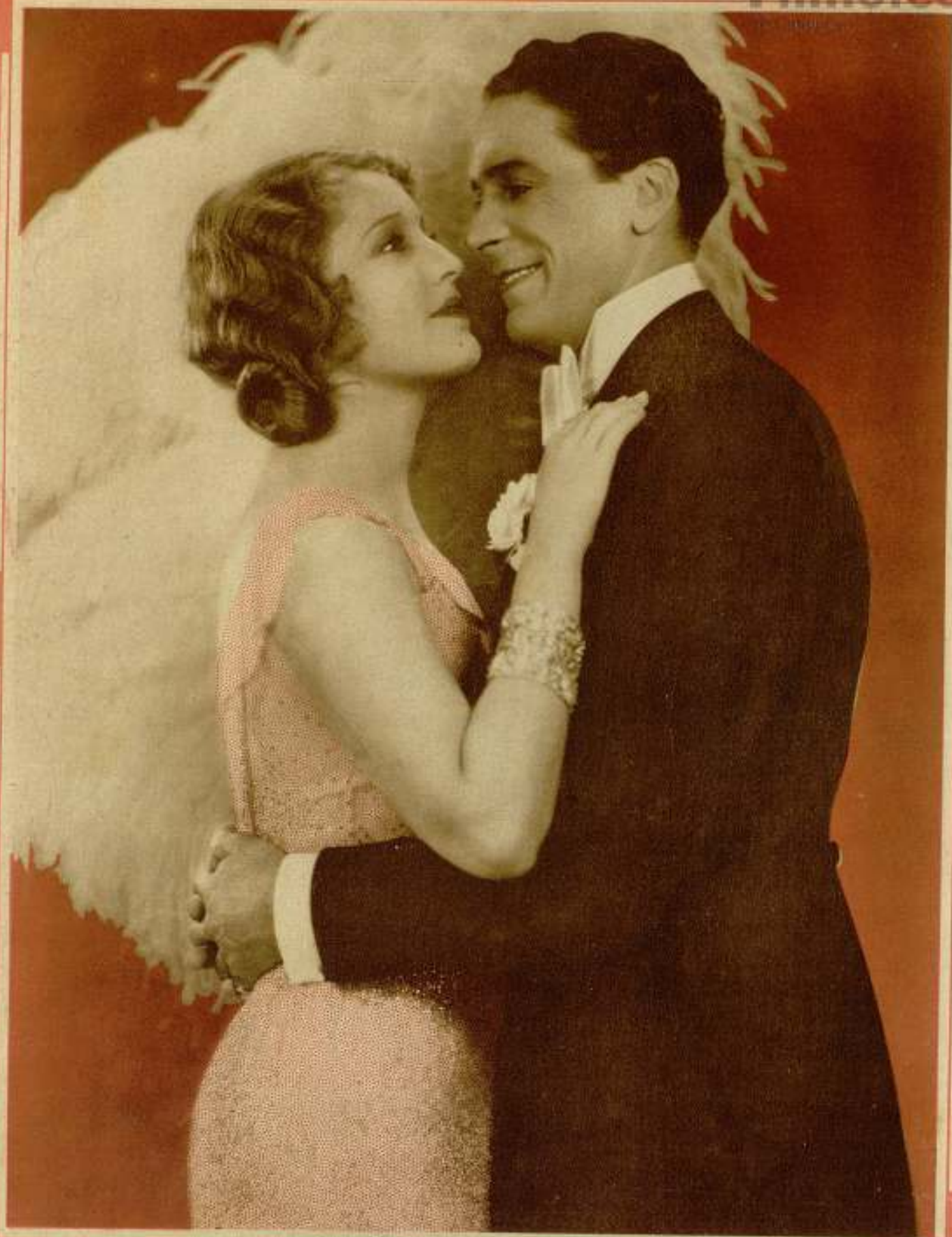
Jeanette Mac Donald y Jack Buchanan en una escena de la película Paramount, dirigida por Ernesto Lubitch, MONTE-CARLO.