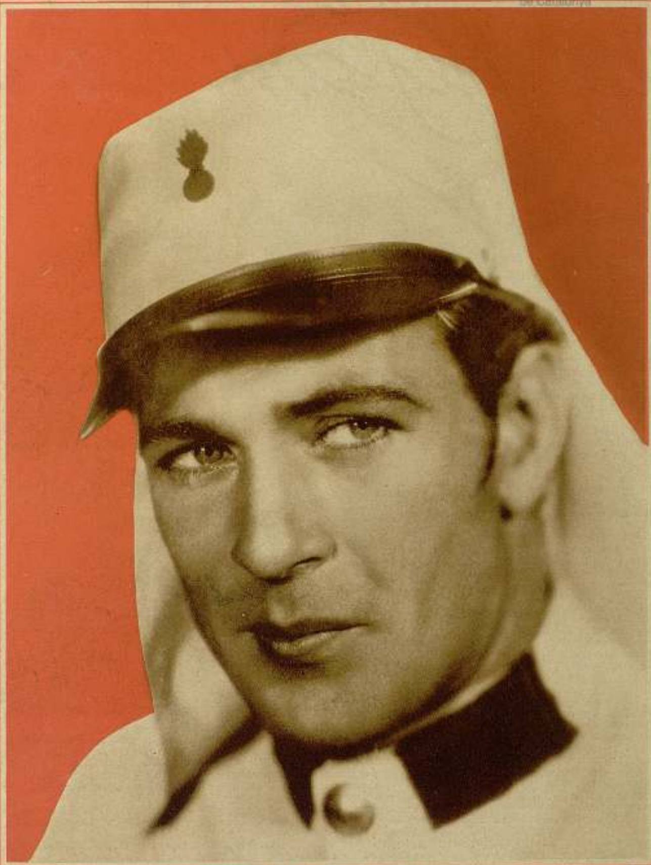
Gary Cooper, tal como aparece en la película "Marruecos" próxima a estrenarse, de la que es protagonista en unión de Marlene Dietrich y Adolfo Menjou.