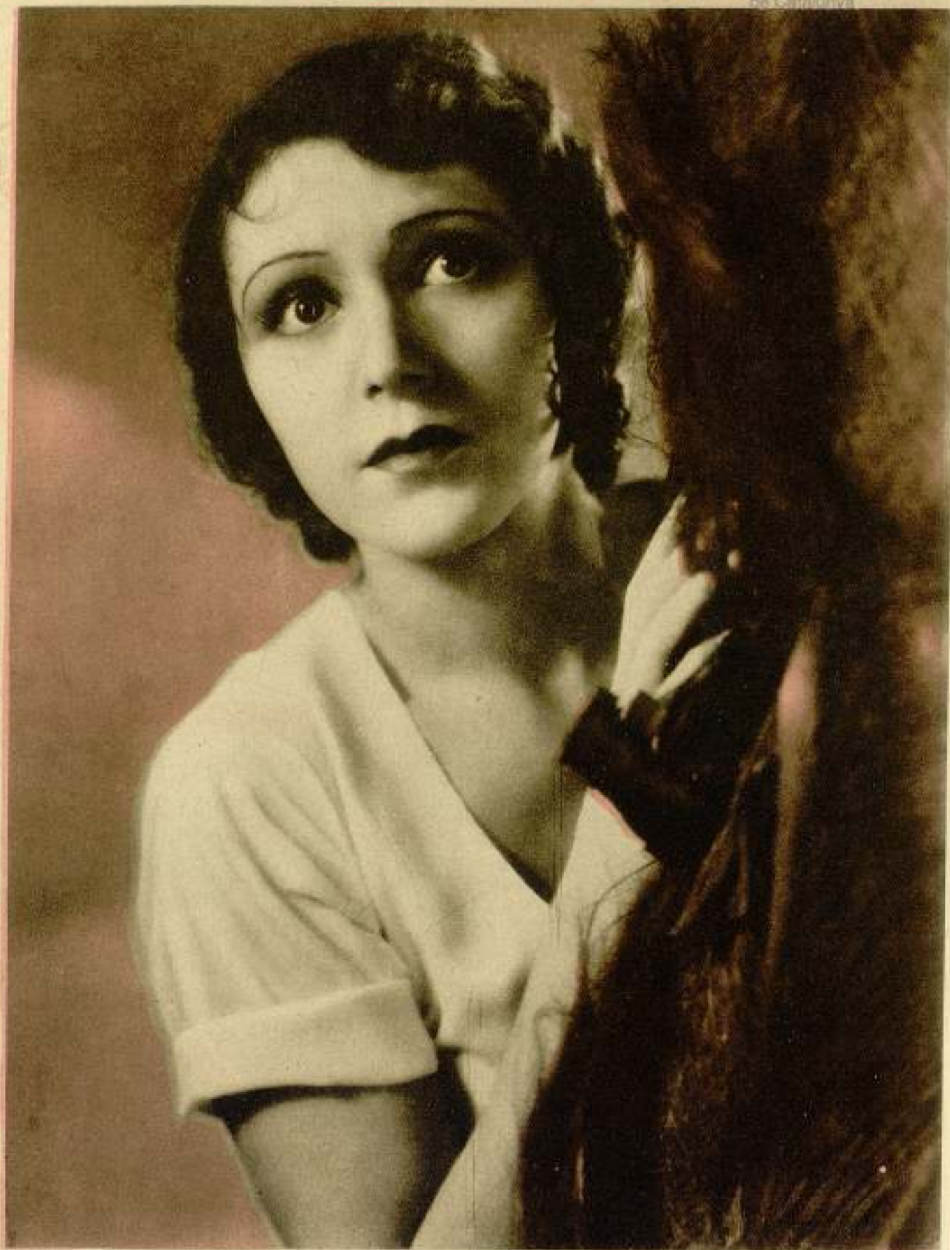
Rosita Moreno en la película EL DIOS DEL MAR de la que es protagonista ES UN FILM PARAMOUNT