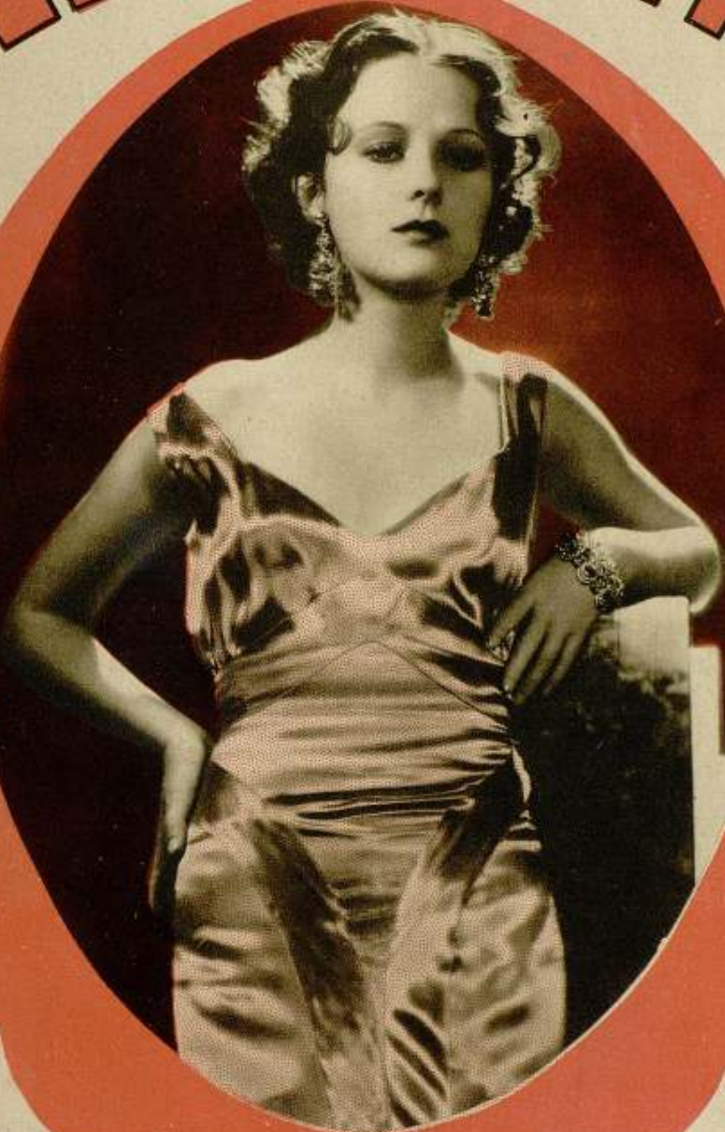
DOROTHY JORDAN, la deliciosa ligerusa de la Metro-Goldwyn-Mayer