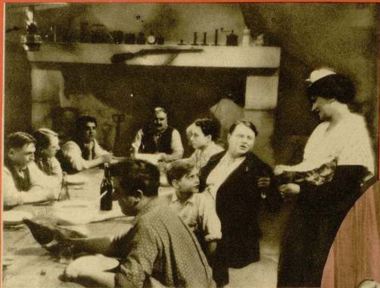
VARIAS SCENAS DE LA MOCIO- NANTE LÍCULA PATHENATAN LA ARESIANA