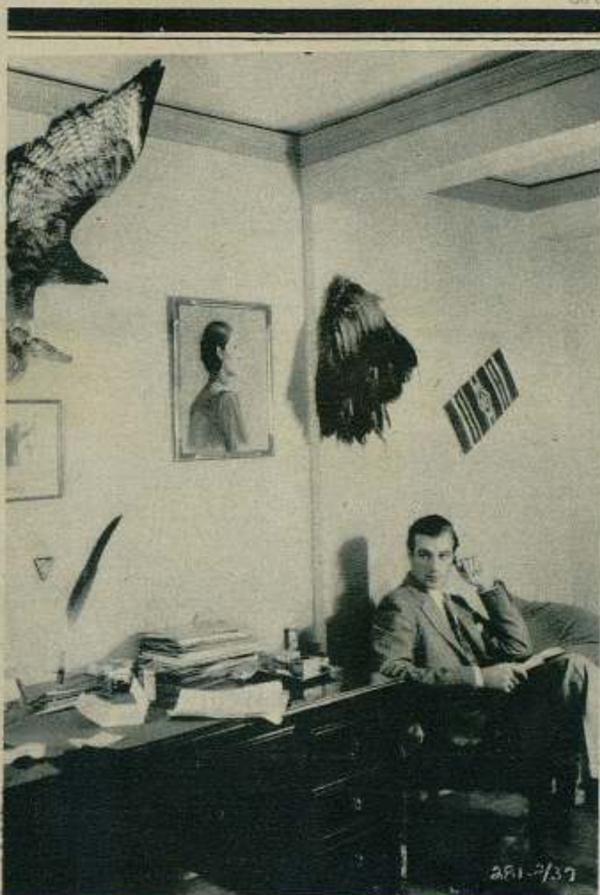
GARY COOPER, ESTRELLA DE LA PARAMOUNT

El establecerse en una ciudad californiana no es empresa tan fácil como parece. Los editores de los periódicos locales no parecían admirar grandemente su talento, y tuvo que limitarse a trabajar por cuenta de un fotógrafo, buscando clientes de casa en casa. Después se dedicó a vender espacio para anuncios, por cuenta de un teatro que anunciaba en el telón. Finalmente fracasó rotundamente y se quedó totalmente arruinado. Con los últimos diez centavos se compró un pe-