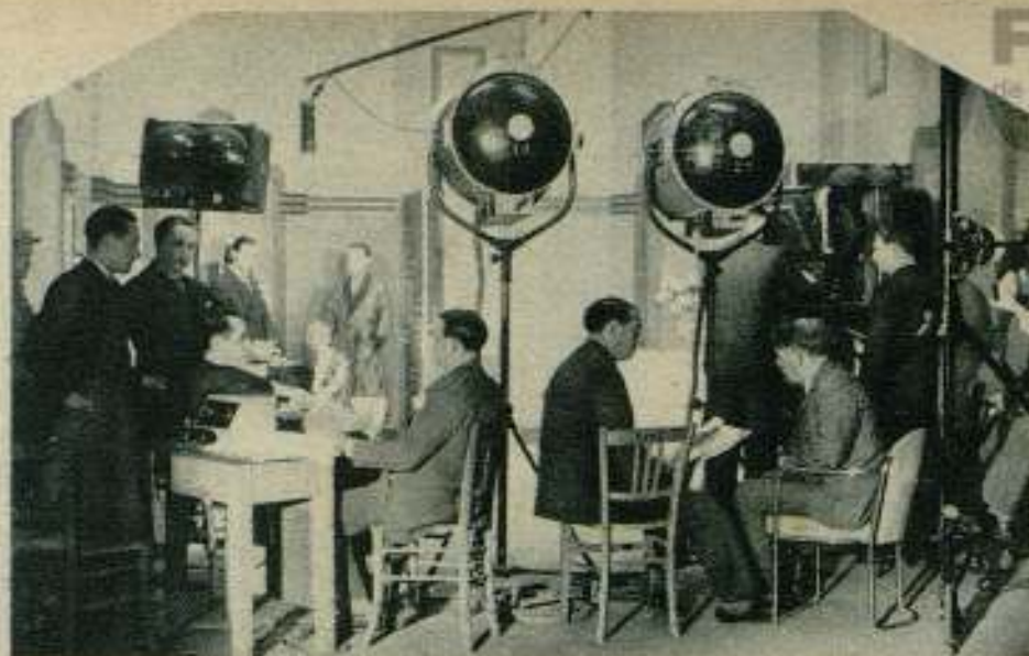
Impresionando la película Paramount MARIONS-NOUS

Es una mañana de sol espléndida. Cosa bien rara, por cierto, en este París de constante cielo nebuloso, pero a pesar de su frecuente llovizna, hay un algo, en su ambiente, tan grato y acogedor, que sentimos la necesi-