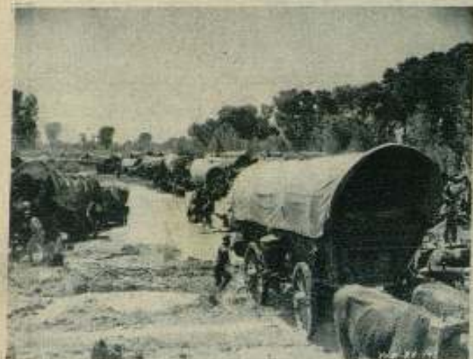
Una interesantísima escena de la película «Horizontes nuevos».

La epopeya del pueblo ganqui — un pueblo heterogéneo y multiforme por demás — es la colonización de las tierras del Oeste. Una empresa que a los norteamericanos les complace recordar cuando sienten, punzante, la nostalgia de los grandes hechos históricos que definen el carácter de las na-