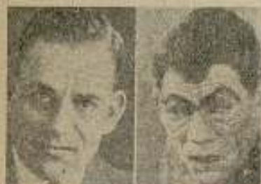
Lon Chaney, el hombre de más caras del cinematógrafo, tal como es y tal como puede ser.

De este modo todos estaréis conformes en que el que crea un rostro crea un alma, y el que