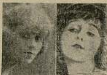
Betty Balfour, la rubia de suave remembranza británica, en su rostro verídico y en uno fingido.

Tres son los resortes mágicos en la musa cinematográfica como en todas las musas del hu-