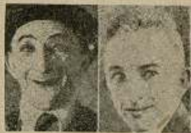
Larry Semon, en las películas y en la vida privada.

Los argumentos cinematográficos expresan momentos de pasión y estados de sentimiento;