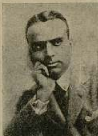
Douglas Fairbanks, protagonista de S. M. el Americano

A fin de proteger con urgencia a la familia real, nuestro héroe cabalga en rápido corcel para requerir el auxilio de las tropas leales restadas a Palacio. Seguido de los soldados adictos, rompe el asedio que los rebeldes tienen puesto al palacio, pudiendo encontrarse cerca del rey a punto de impedir que firmase la abdicación que Sarzeau imponía por fuerza. Después de salvar a la familia real, las tropas mandadas por él dan la batalla decisiva a los rebeldes, restableciendo por completo el orden público. El rey, henchido de júbilo y de gratitud, entrega a Douglas un cofrecito en el que se encierran todas las pruebas de su nacimiento. Y en el mismo aposento real, Douglas se encuentra con su madre, que no es otra que la princesa, hija de Felipe IV, el cual abdica a favor de su nieto, a quien el pueblo, gozoso de contar con un monarca joven y valiente, lo proclama satisfecho su rey, al grito entusiástico de «Viva Douglas I».