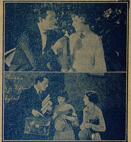
Lois Wilson, McAvoy y Elliott Dexter en la película "Solamente 38"