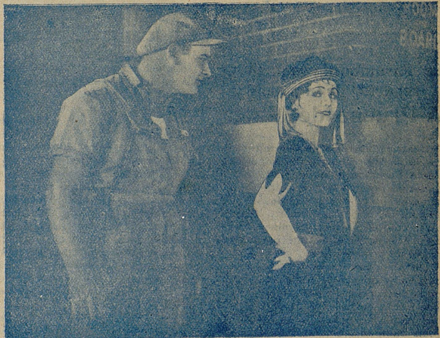
Gladys Walton en la hermosa producción «Jugando con fuego»