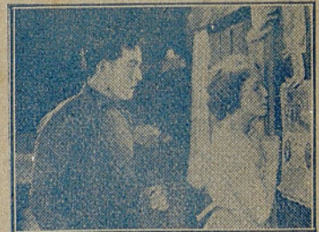
Sessue Hayakawa y Bessie Love en «El misterioso Doctor Wang»