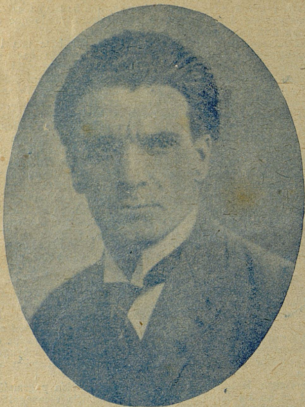
Interesante personaje de «El hombre de las tres caras»

Mientras Muguette prodiga a su padre los más tiernos cuidados, Roberto de Grisolles, acaba de almorzar en casa de los Morant de la Sellenave. Después del almuerzo, Susana Morant telefona al castillo de las Aguilas para recibir no-