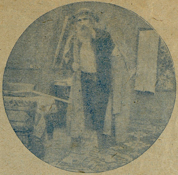
El viejo mendigo, enigmática figura que aparece en la película «El hombre de las tres caras»

desierto. Cuando Bert llega al lugar donde Jim dejara a María, el miserable hace creer a la joven que su amigo murió de cansancio y de sed, víctima, como tantos otros, de la crueldad del desierto. Convencida María de que lo que Bert le cuenta es verdad, al llegar a Pine Gulch se casa con él.