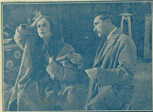
"El hombre de las tres caras" - Una escena del segundo episodio

Pascaline ha pasado la noche devorada por mortal angustia esperando en vano a Julián Marsach su querido esposo. Al amanecer se dirige a la oficina de correos para pedir noticias por teléfono cuando le llama la atención un grupo de