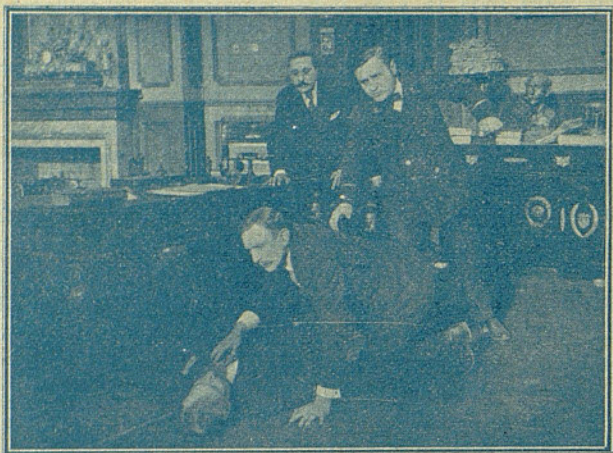
Una escena de «El hombre de las tres caras»

En la carretera de Montrouge, cerca de las puertas de París, un hombre joven todavía daba muestras de hallarse en la mayor desesperación... había fracasado en todos los negocios en los cuales fió su prosperidad y dándose por vencido en la lucha que había sostenido tan rudamente