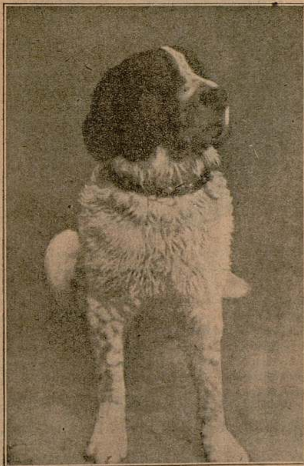
El inteligente perro GNOME que interpreta un lucido papel en la gran cinta Los Mohicanos de París

Lo cierto es que el conde Hugo y Lucille están buenos y salvos y que, de haber llegado a ellos, habrán sido los primeros sorprendidos con la noticia de su muerte.