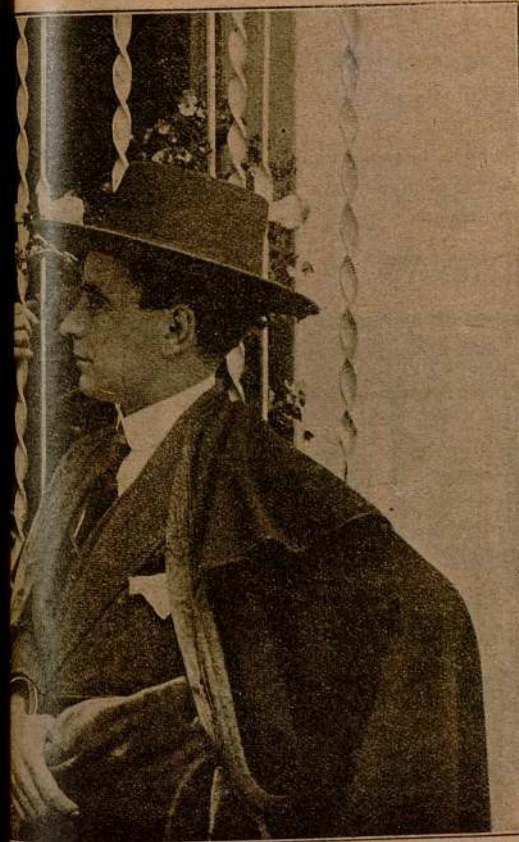
Una escena de la gran película Sangre y Arena

A través de su conversación desliza una advertencia: