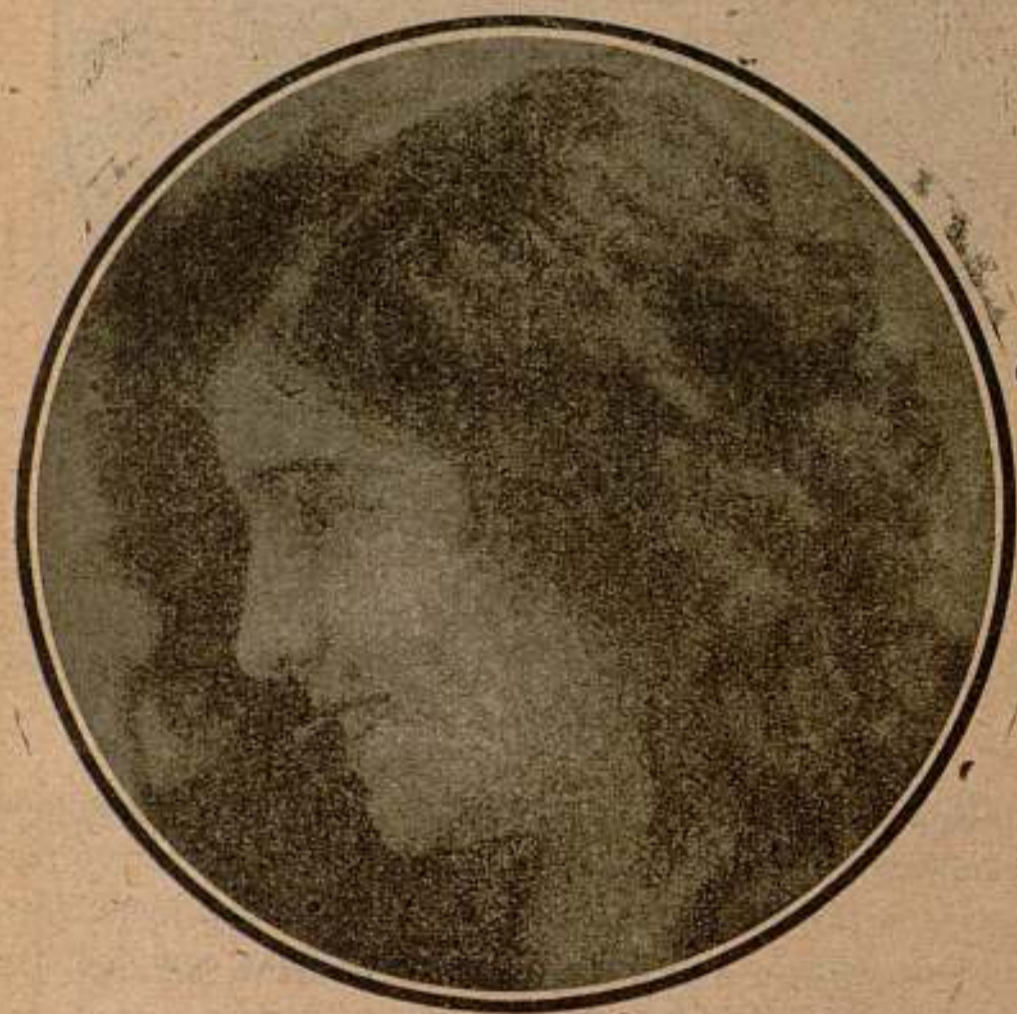
MARÍA JACOBINI, protagonista de la gran película Resurrección , editada por la «Tiber-Film», según la célebre obra del Conde León Tolstoi