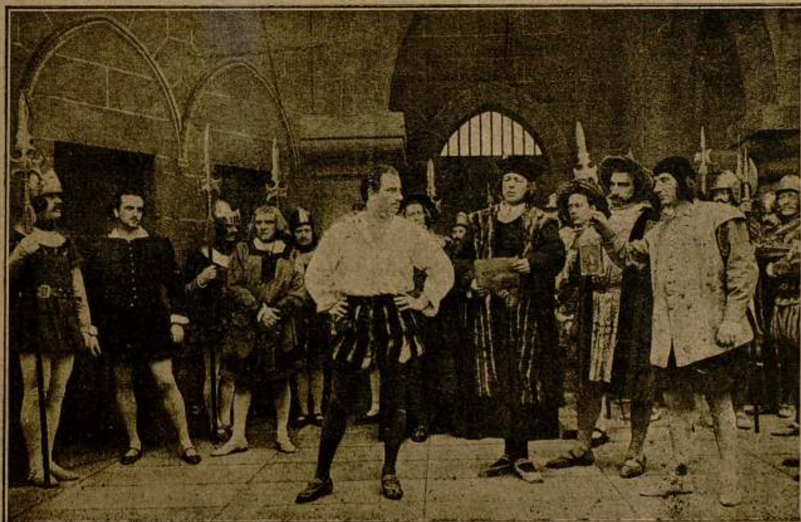
Una escena de la película María Tudor

Un solo pensamiento domina ahora a Gilbert: vengarse de Fabiano. El cincelador será el instrumento de Simón Renard y de la propia reina, puesta al corriente de la infidelidad de su favorito... Gilbert se deja acusar de una tentativa de asesinato contra la reina y denuncia como cómplice a Fabiano, que es condenado a muerte. Pero María Tudor ama todavía a su favorito y no quiere que muera. El pueblo, amotinado, reclama la cabeza de Fabiano; será Gilbert quien morirá, llevando la cabeza cu-