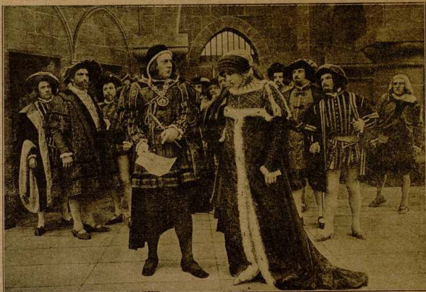
Una escena de la película Maria Tudor

Al día siguiente, a pesar de haber obtenido un verdadero triunfo, como cantante, en un difícil pa-