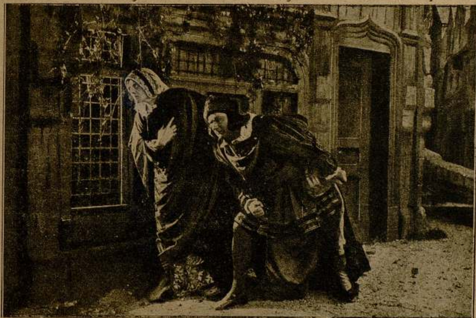
Una escena de la película Maria Tudor

Sir Miles Fleet supo que su terrible secreto había