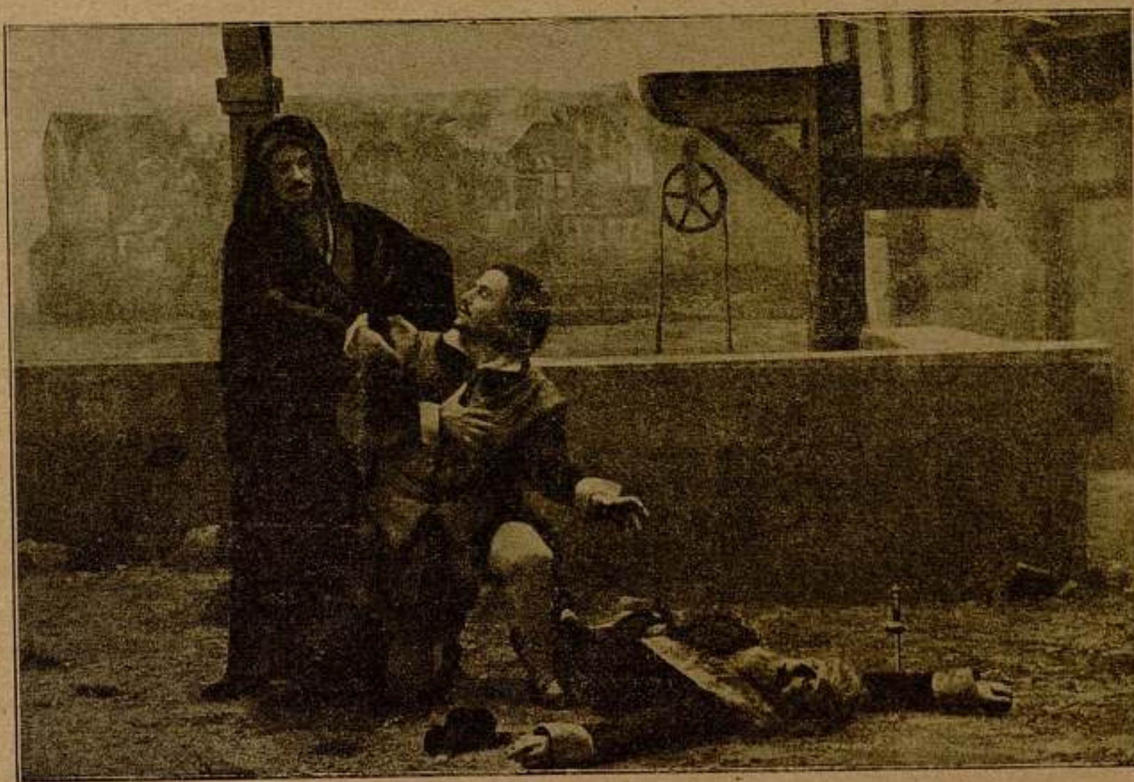
Una escena de la película María Tudor

— ¿Qué ocurre? Parece V. alarmado y he visto a una mujer que escuchaba a la puerta de su despacho y que ha corrido a reunirse con un hombre que la esperaba escondido. ¿Es quizás este hombre el que le preocupa? Dígame V. su aspecto, se lo ruego.