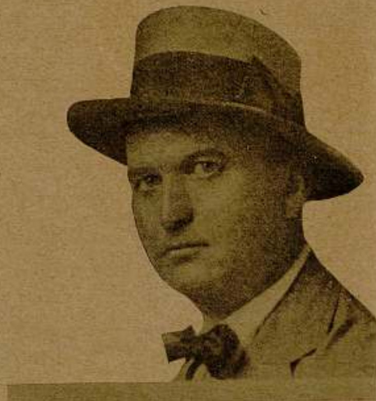
Thomas H. Ince

Así las cosas, y yendo la producción en aumento constan-