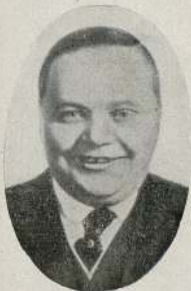
ROSCOE ARBUCKLE (FATTY)

Soy concesionario exclusivo de las producciones 1919-20