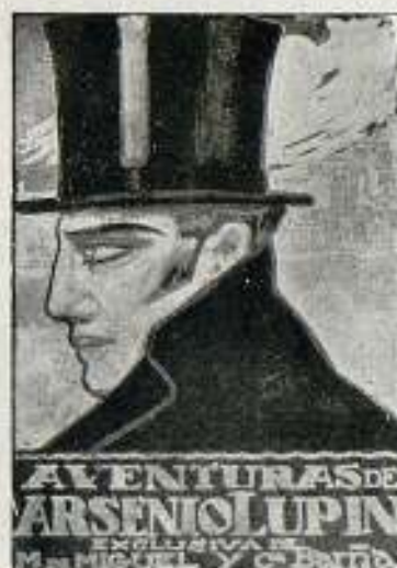
Cartel lema «AVE DE RAPIÑA», segundo premio, de 200 pesetas

Este último rasgo de la casa M. de Miguel y Compañía, sobre el de haber organizado el concurso, le valió muy merecidos elogios y frases de estímulo de la Junta Directiva que