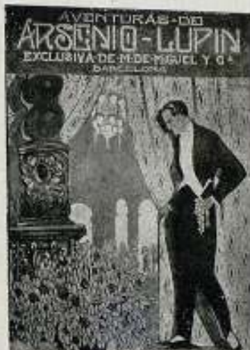
Cartel lema «AUDAZ», que obtuvo el primer premio, de 1000 pesetas

El 1.º de Febrero se reunió el Jurado que había de decidir en la adjudicación de los premios ofrecidos para el concurso