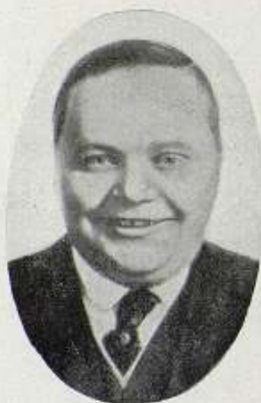
ROSCOE ARBUCKLE (FATTY)

Soy concesionario exclusivo de las producciones 1919-20