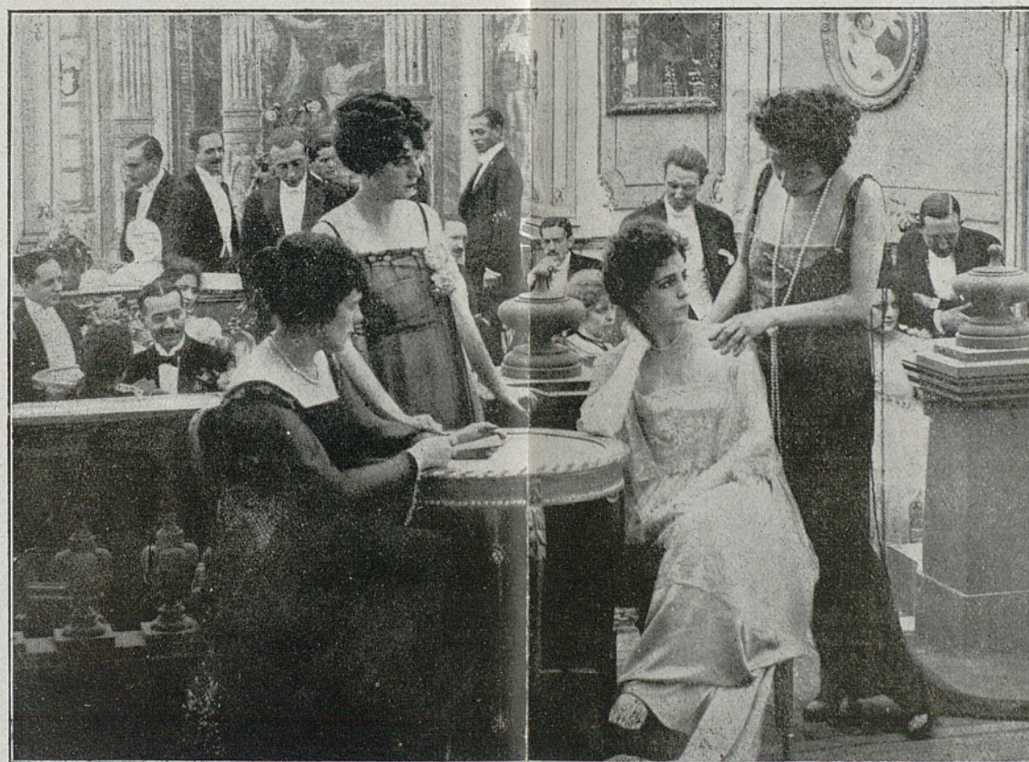
Una escena de la película "LA DICHA AJENA"

: EDICIÓN, VENTA Y ALQUILER DE PELÍCULAS PROPIAS : EDICIÓN DE PELÍCULAS DE ENCARGO - TIRAJE DE POSITIVOS TÍTULOS - AMPLIACIONES Y TRABAJOS FOTOGRAFICOS PARA CINEMATOGRAFÍA