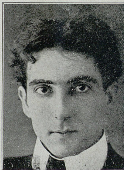
ARMAND GUERRA Director artístico y protagonista de las películas de la nueva manufactura madrileña «Cervantes Films»