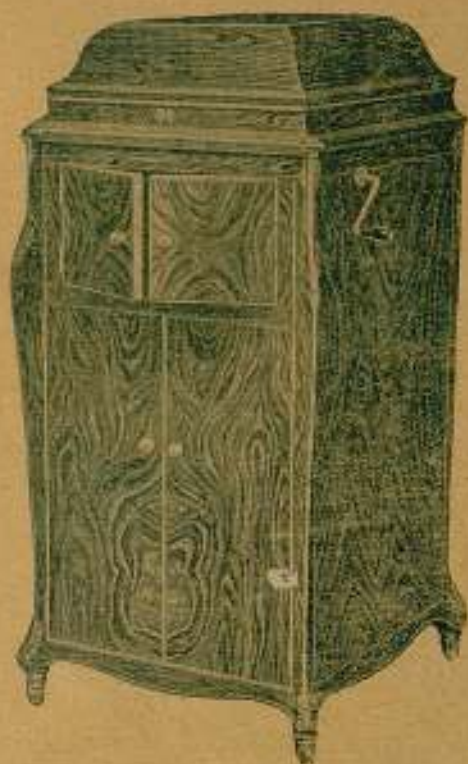
"GRAMOLA" Modelo n.º 28

En nogal circasiano; Precio: 1.500 ptas.