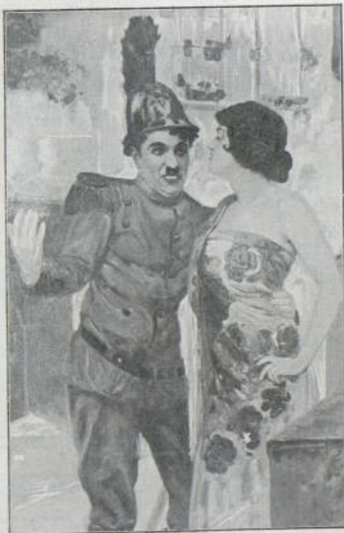
Una escena de la parodia de «Carmen», por Charlot, que tan gran éxito ha obtenido en Barcelona

Deseamos vivamente que el éxito comercial corone sus esfuerzos, así como que volvamos pronto a tener el placer de verle de nuevo entre nosotros.