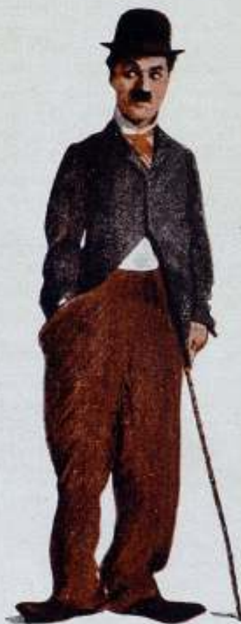
Charles Chaplin «Charlie»

El artista cómico cinematográfico de universal renombre