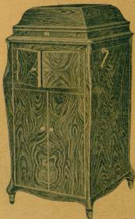
"GRAMOLA" Modelo n.º 28

En nogal circasiano; Precio: 1.500 ptas.