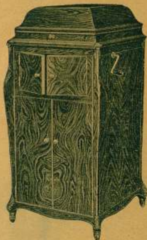
"GRAMOLA" Modelo n.º 28

En nogal circasiano; Precio: 1.500 ptas.