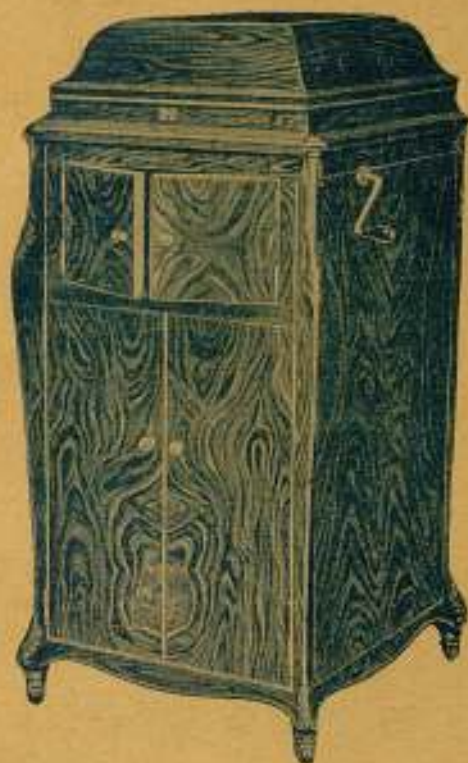
"GRAMOLA" Modelo n.º 28

En nogal circasiano; Precio: 1.500 ptas.