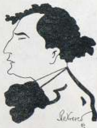
Manuscrito VICTOR EFTIMIU...

Hace tiempo relaté en una crónica, que nuestro gran autor dramático Mr. Victor Eftimiu había visitado, en Berlín, a la célebre artista María Carmi. Hoy puedo añadir que la artista se ha interesado mucho por el gusto del público rumano. Habiéndole pedido María Carmi que escribiese algunas esce-