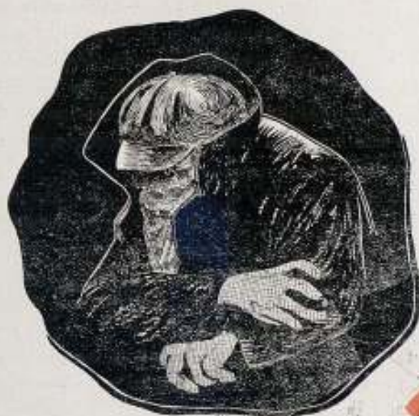
El hombre del pañuelo rojo, el intrigante personaje de LOS MISTERIOS DE NEW-YORK