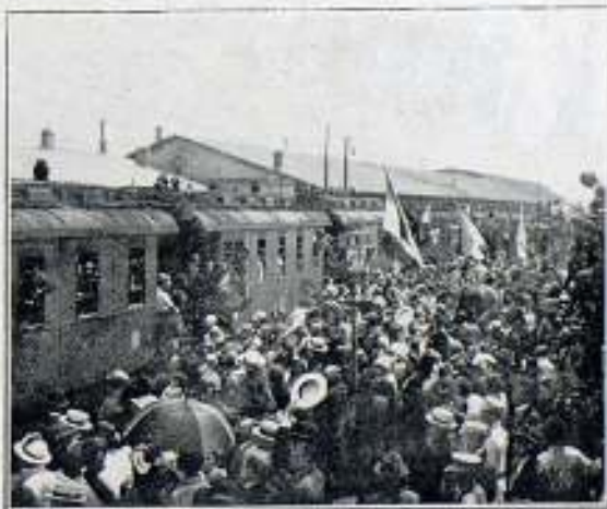
Salida de un convoy de reservistas

La alcaldía ha decidido clausurar definitivamente la Sala del «Cinema Vlaico». En Rumanía se carece de films inéditos, haciéndose pagar el metro a 1 50 francos, siendo la casa