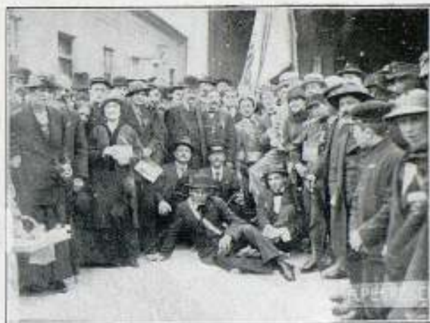
Grupo de reservistas prontos a partir

La empresa Bonetti anuncia: Flor del mal , por Lyda Borelli, «Cines»; Assunta Spina , por Bertini, «Cesar»; La dama de las camelias , por Bertini, «Cesar»; Diana , por Bertini, «Cesar».