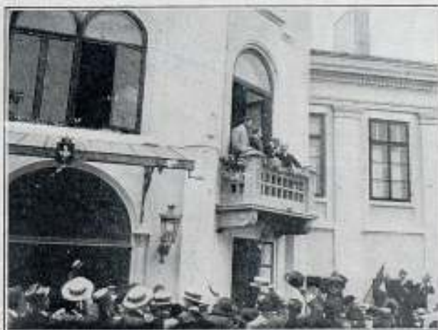
Manifestación popular de simpatía a Italia, ante el consulado de dicha nación

Con motivo de la movilización italiana, el pueblo rumano ha manifestado su simpatía por aquella nación en un acto