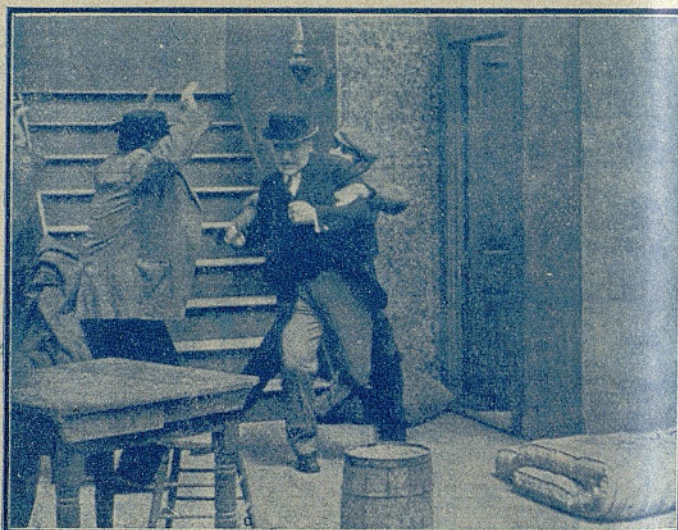
Varias escenas interesantes del drama REDIMIDOS

Un formidable incendio se declara en la casa china; entre el numeroso grupo de curiosos que han acudido a presenciar el siniestro, figura Dora y su compañero Andrés, quien ya ha cambiado completamente de vida. De pronto se sabe que en el interior de la casa incendiada queda una mujer; Andrés no titubea un sólo momento, y se lanza entre las llamas para salvarla, lográndolo al fin, no sin ha-