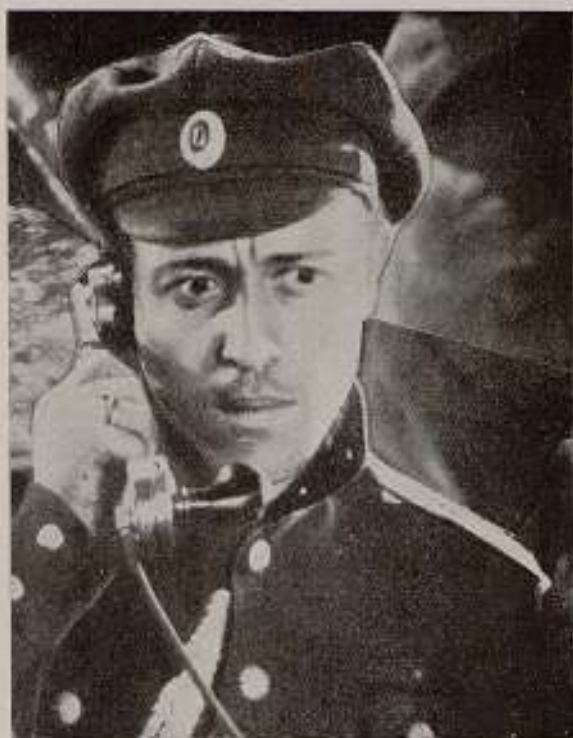
Eisenstein: «Octubre».

miento mecanista, que es una forma de la estrechez de clase, es incapaz de representar los sucesos con su verdadero significado.