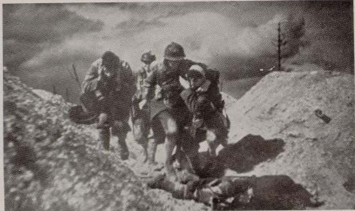
"Las cruces de madera", film francés de Raymond Bernard. En él, hoy un sentido profundamente patriótico, bélico y militarista, disfrazado de pacifismo.

el ejemplo de Benavente mayando como un gato cuando le pisan la cola, porque la República burguesa ha olfateado su monarquismo. La cita de casos análogos podría llegar al infinito. Y no en vejestorios, que casi es lógico que se conduzcan así, sino, lo que es peor, en jóvenes que ayer bramaban en las tertulias del Ateneo y en los cafés madrileños contra la Monarquía... Hoy, estos jóvenes fauves , merced a un acta de Diputado o de un enchufito, son niños buenos, incapaces de dar un disgusto al amo o jefe, que reparte las prebendas.