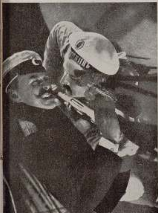
Eisenstein: «El acorazado Potemkin»

Eisenstein se ha desenvuelto en condiciones en extremo desfavorables. Sus primeros films no han sido sometidos a ninguna crítica marxista seria. El artista ha caído del primer golpe en una atmósfera de críticas globales y poco consistentes. Se le ha alabado mucho injustamente, pero no se ha puesto jamás el problema de sus antagonismos internos. Eisenstein, como todo nuestro arte cinematográfico, se ha engrandecido fuera de la