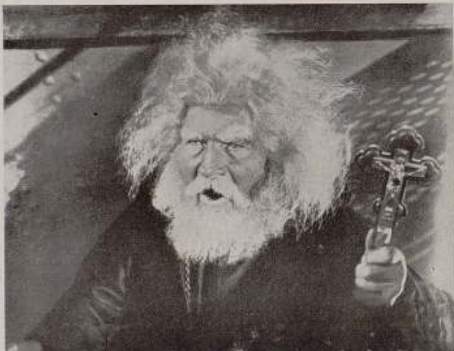
Eisenstein: «El acorazado Potemkin».

Las oposiciones de los primeros films de Eisenstein se reproducen aquí sobre una nueva base, con un carácter más vivo y más agudo. Por su tendencia general, el film debía aproximar al artista con la filosofía proletaria: sin embargo, continúa presentando trazos de su estrechez pequeño-burguesa. Hay una ruptura entre las exigencias presentadas al artista revolucionario por su época y los resultados de su propia reeducación. El hecho mismo de la aparición de Octubre atestigua que el artista progresa, pero él mismo nos convence, al mismo tiempo, de que este progreso solamente es exterior y superficial. El film muestra como Eisenstein, continuando prisionero del pensa-