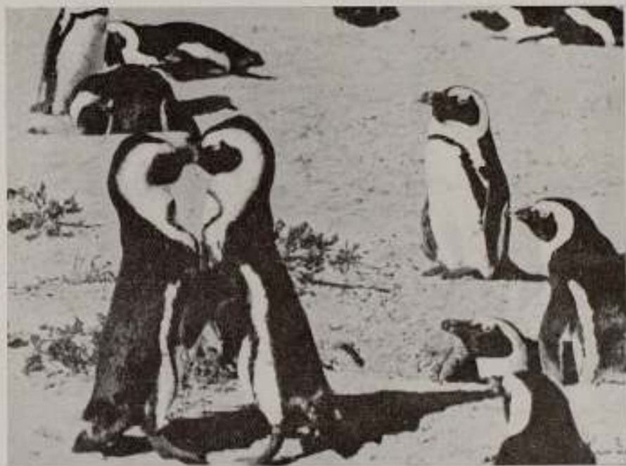
«Dassani», documental de Cherry Kearton sobre la Isla de los Pingüinos.

Muchas cosas. No tengo ninguna confianza en él. Me temo mucho que sea una prolongación del teatro manido que monopoliza los escenarios españoles. Además, hasta ahora el cine español no ha sido sino una prolongación del teatro. Los artistas que en él toman parte proceden de la escena y van a la pantalla a declamar y a lucir unos perfiles ridículos y almiarados. En España, cuando un autor (si es literario) no logra publicar sus engendros, funda una Editorial que, naturalmente, publica sus obras, o, por lo menos, una revistilla literaria. Si el autor es teatral, entonces se amanceba con una artista, reúne cuatro nulidades y, como es lógico, funda una compañía que se entrega a representar sus imbecilidades. Yo no quiero decir que la «Ecesa»