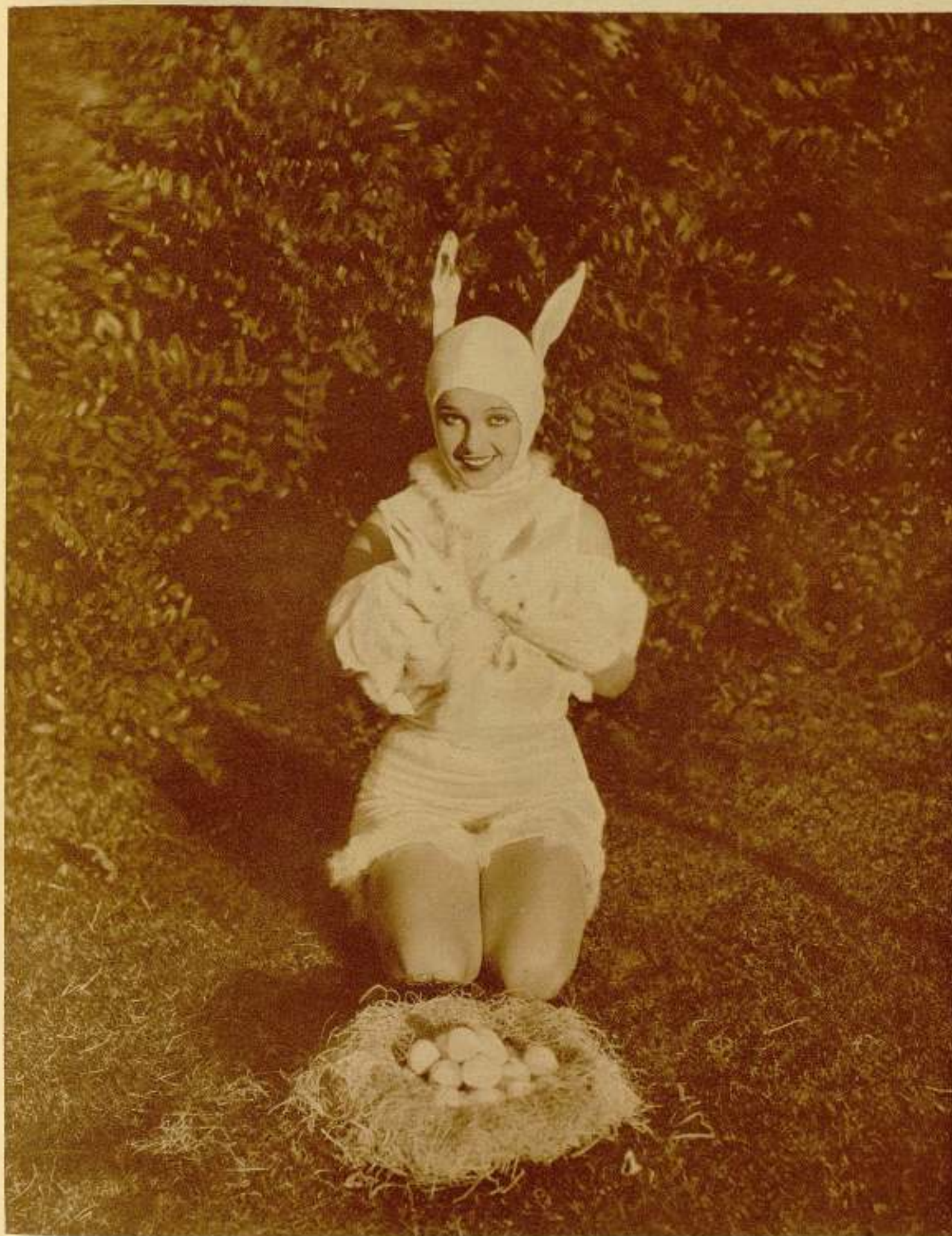
Sally Blane La preciosa "vedette" de los estudios R. K. O.