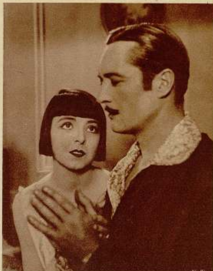
Edmund Lowe se pasa de listo. En esta cinta de la First National se empeña en enseñar, de cierta manera, a la bella Colleen Moore, inocentes juegos de manos, que no tienen otra trascendencia que la que se le quiera dar.