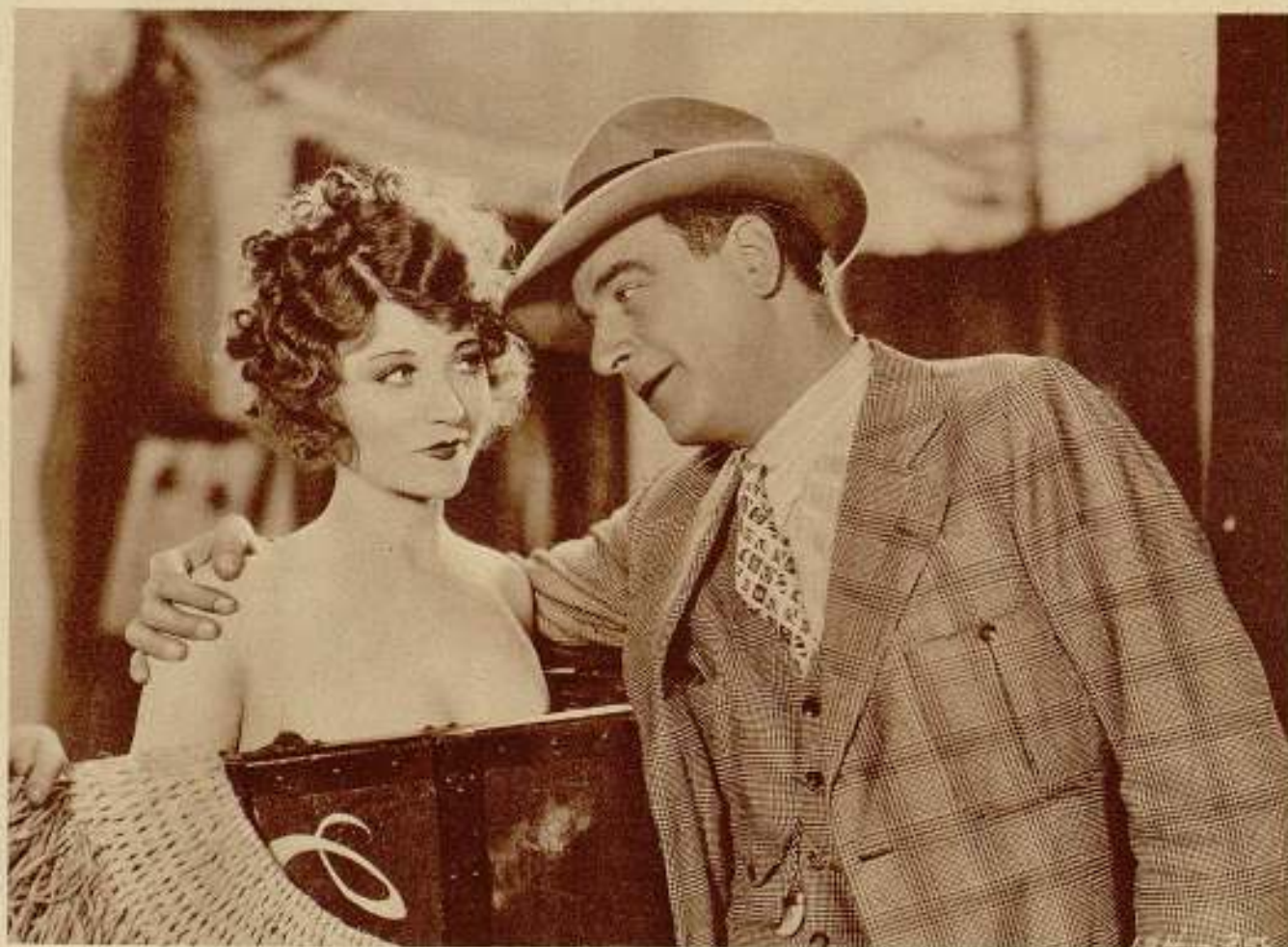
Betty Compson se disponía a esconder sus hermosas formas en un cajón de grandes dimensiones, pero Milton Sills la sorprendió de la mejor manera que se puede sorprender a una mujer. Lo que no se ha podido averiguar todavía es lo que ocurrió a estos actores de la First después de este suceso.