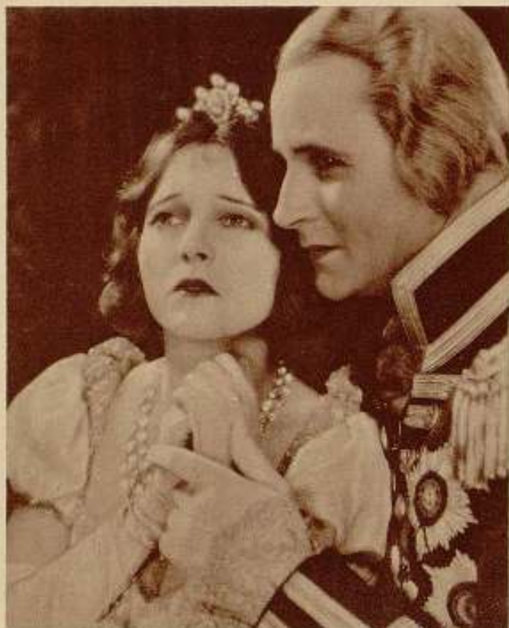
Corinne Griffith y Víctor Varconi están haciendo juntos una película, especial de Miss Griffith, y se titula "La divina Lady". Los enterados de pormenores en estos asuntos, aseguran que esta cinta de Corinne Griffith, costará un millón de dólares.