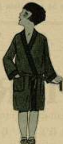
ROBE DE CHAMBRE

Nota: más gracioso que la faldita figurada de un tubo sencilla en este modelo de pijama es, seda azul obscura o rojo granate, sin otro adorno que una estrecha cinta, en el escote, de un tono más obscuro que la seda que la forma.