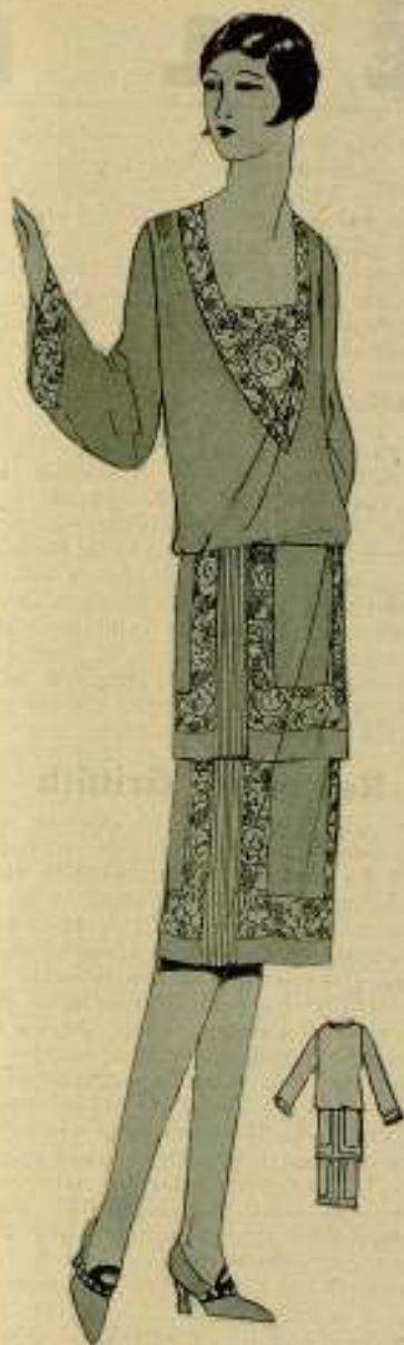
EN EL "BOUDOIR"

Lo más interesante de este modelo consiste en la combinación de los colores de la blusa y de la falda que aunque pueden ser de un sólo tono, resulta más sabio en diluir