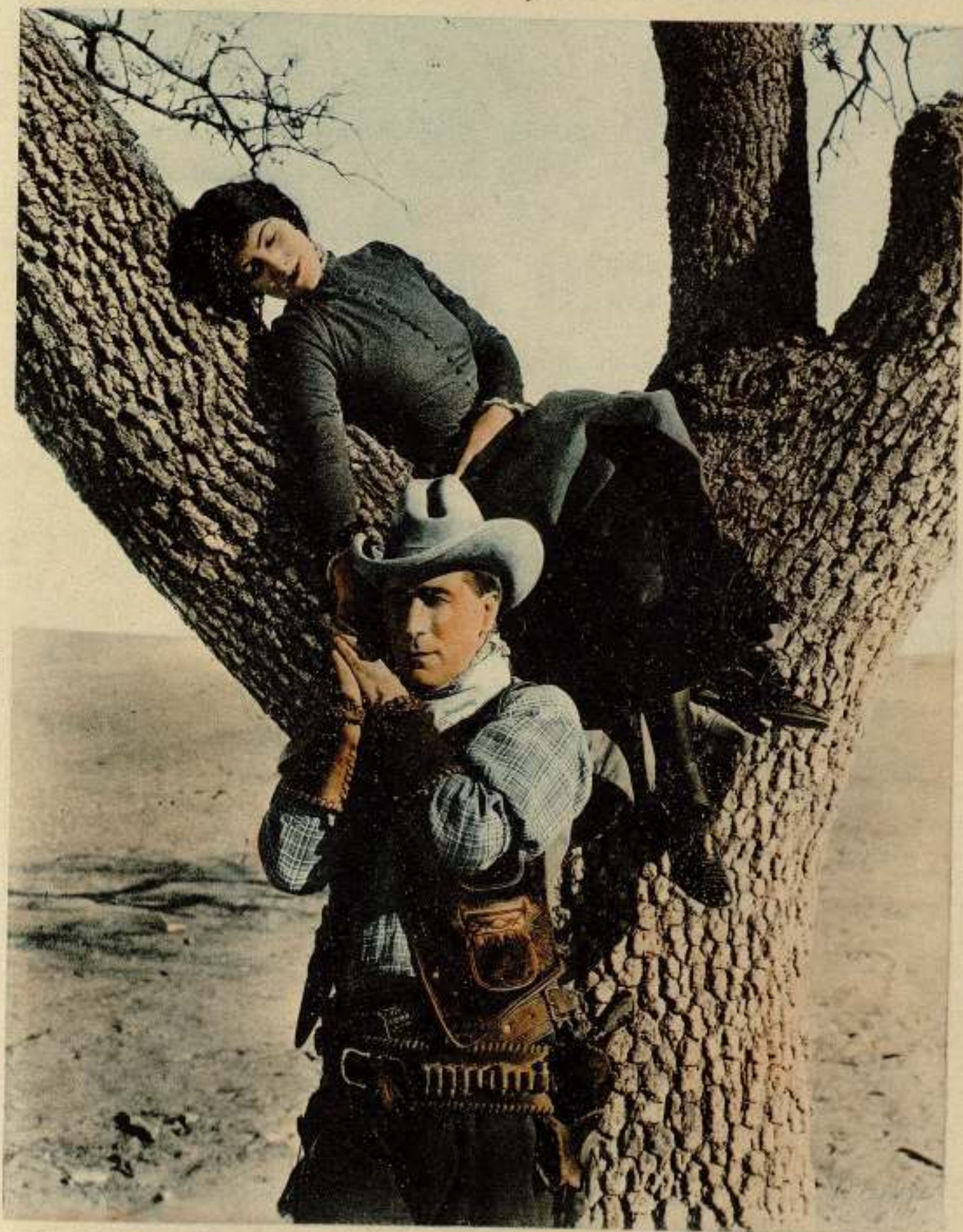
William S. Hart en «El hijo de la pradera», de LOS ARTISTAS ASOCIADOS